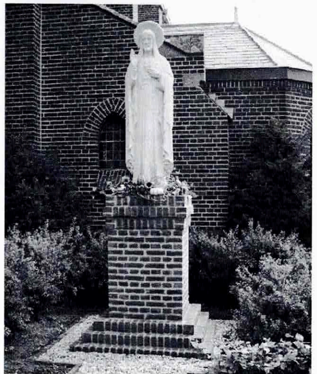
Het H.Hartbeeld anno 2003 in het Venrayse kerkdorp Castenray.

Heel Castenray is trots, dat weer een monument als teken van het christelijk geloof bij de plaatselijke parochiekerk prijkt.