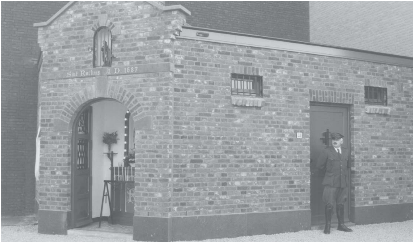
De vernieuwde St. Rochuskapel met rechts de veldwachter voor de cachotten

De felle kou op zondag 6 maart 2005 vormde geen beletsel voor een cachetvolle inwijding van de Rochuskapel in Echt. Het geweld van de nieuwbouw rond de Wijnstraat leidde er in 2003 bijna toe, dat de eeuwenoude Rochuskapel verloren was gegaan. Gelukkig werd echter tijdig wethouder Sjraar Dirks ingeseind, die er voor zorgde, dat de kapel niet afgebroken werd, maar enige meters werd verplaatst. Hoewel verplaatst, het gebouw moest in zijn geheel opnieuw worden opgetrokken en wel voor een bedrag van ruim 100.000 oude guldens