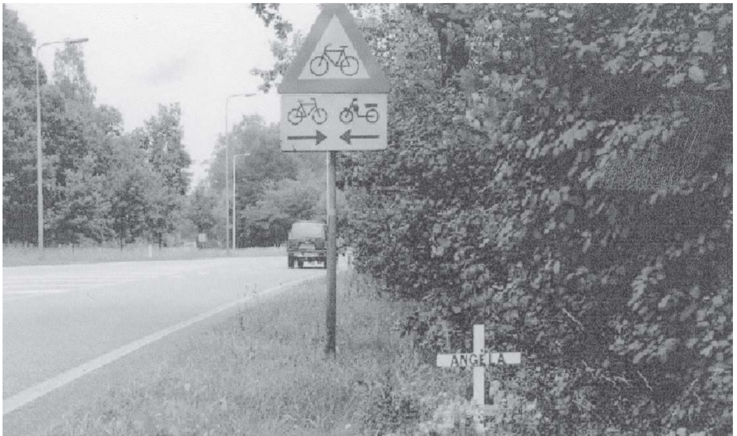
Dit kruis zal uiteindelijk verdwijnen en aan de overkant van de weg als stenen kruis voortbestaan.