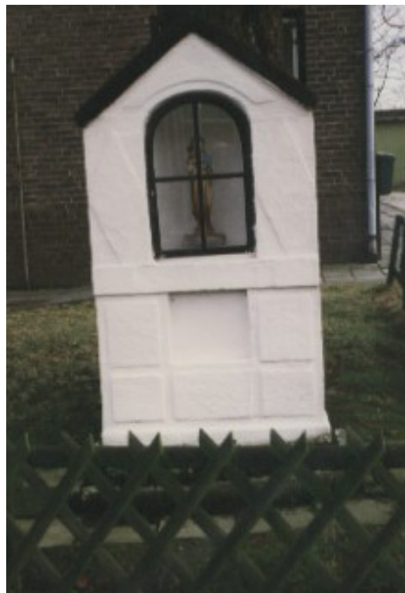
Mariakapel, Lichtenbergstraat - Kerkrade

De 'Wandelroutes langs kruisen en kapellen in de gemeente Kerkrade' zijn (gratis) verkrijgbaar in de hal van het Stads-kantoor (het nieuwe gemeentehuis) van Kerkrade.