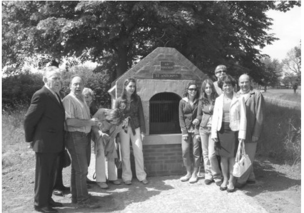
De familie Corstjens, eigenaar van de kapel, poseert trots bij het nieuwe bouwsel.

De kapel was een rijksmonument, dus dat betekende extra tijdsbeslag, omdat de Rijksdienst voor de Monumentenzorg bij de herbouw diende te worden betrokken. Daarnaast moest door de verzekeringsmaatschappij de veroorzaker van al het leed in Duitsland worden opgespoord.