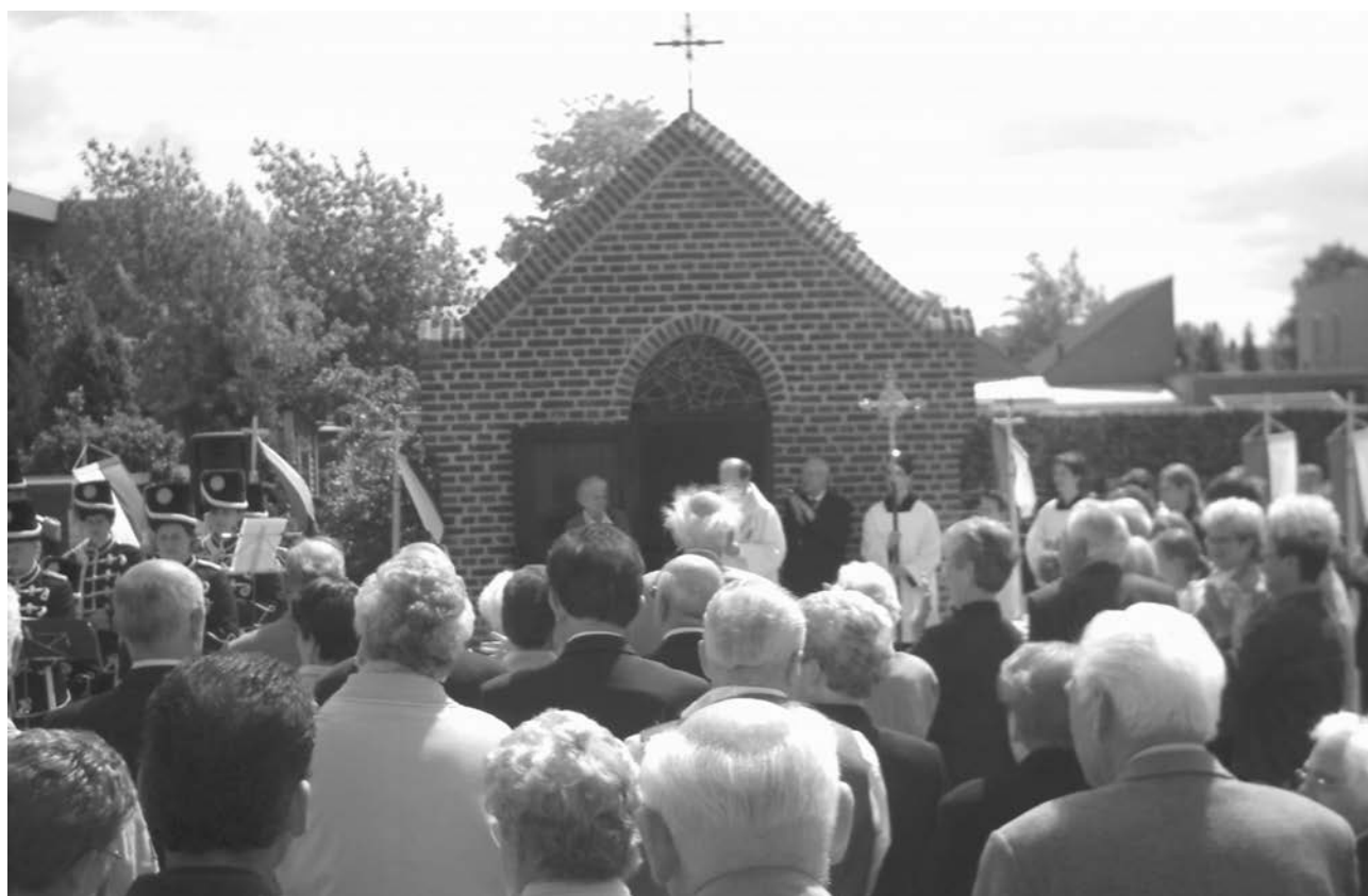
Volop belangstelling bij de inzegening van de Mariakapel te Pey