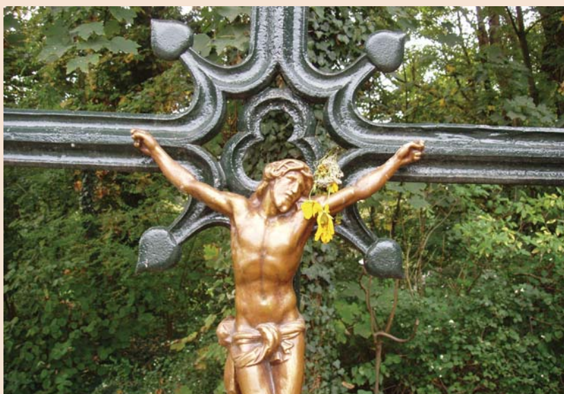
De verkeerde Lievenheer met het hoofd naar links

Een idyllisch plekje vind je aan het oude kanaal bij het Brugwachtershuisje en het fin de siècle-hotel Beau Séjour. Dit gebied is door een plaatselijke groepering teruggebracht naar de staat van het jaar 1906.