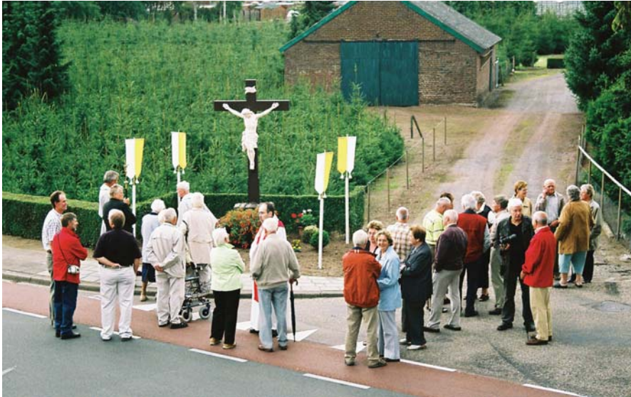
Het wegekruis herplaatst en ingezegend