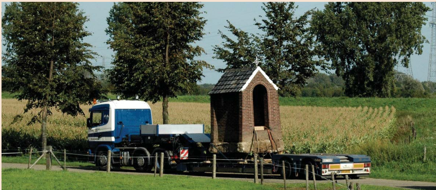
De kapel wordt op een dieplader naar haar nieuwe bestemming gebracht.

Pol, een groep huizen gelegen tussen Heel en Wesseem. Sinds jaar en dag stond op de oever van de Maas een kapel, toegewijd aan Onze Lieve Vrouw van Rust. Mede door de ontgindingen raakte die geïsoleerd. In overleg met de bewoners besloot het gemeentebestuur daarom de kapel te verplaatsen.