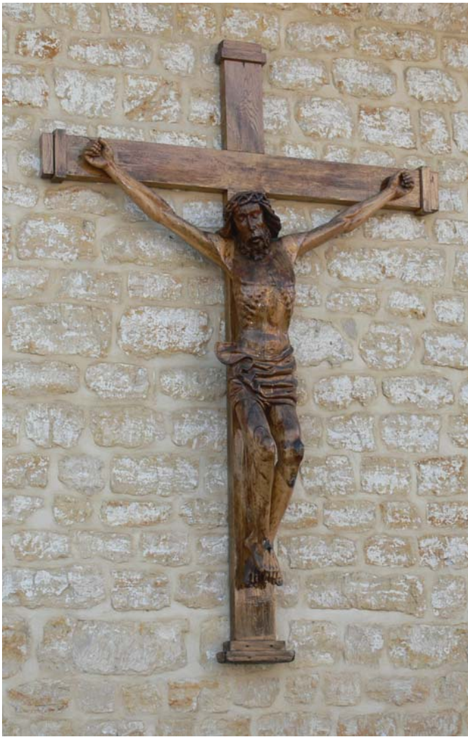
Het Kunderkrüts in 2006

Dat was dit jaar dus vijfenzeventig jaar geleden. Reden voor de Kunrader gemeenschap op zondag 20 augustus jl. stevig uit te pakken, met een feestelijke H. Mis, een processie, een gezellig buurtfeest en een speciaal jubileumlied van de hand van de Voerendaalse schrijver Hub Fober.