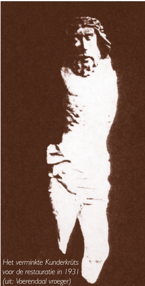
Het verminkte Kunderkrüts voor de restauratie in 1931

Die legende verhaalt van een klooster dat zich twaalfhonderd jaar geleden op de Kunderberg heeft bevonden en dat tegen het einde van de negende eeuw door een plunderende bende Noormannen is verwoest en uitgemoord. Slechts één kloosterling – lekenbroeder Odgar – overleefde die slachtpartij. Hij bouwde nabij de ruïne van het klooster een eenvoudige woning en leefde daar nog vele jaren in vasten en gebed. Na de dood van Odgar hebben nog vele kluizenaars in zijn nederige stulpje gewoond. Het voormalige klooster was inmiddels over-