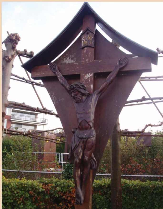
Aan de Rooj Brök

Ingezegend 16 april 1949 door plebaan-deken Rhoen. Het opschrift bij het toenmalige kruis luidde: "Waem zuut 't leid det Ich mot drage, draag gaer zie leid zonger te klage". Dit kruis heeft een vroegere voorganger gehad. Op 22 mei 1995 werd aangifte gedaan van ontvreemding van het kruis. Het was voorheen al vaker vernield. Bij de viering van het 40-jarig jubileum van de Stichting Kruisen