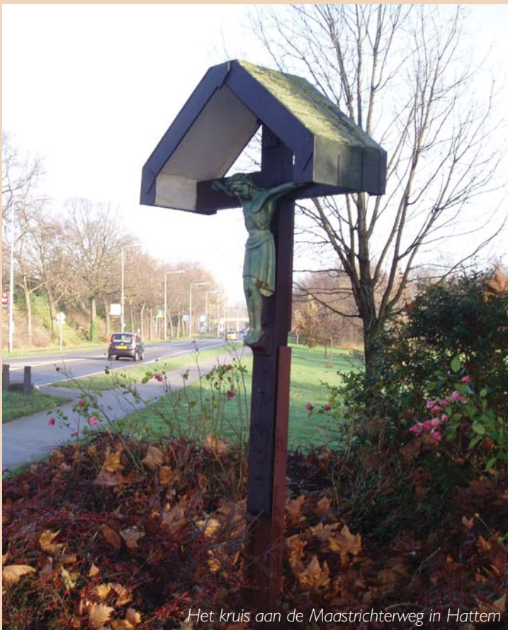
Het kruis aan de Maastrichterweg in Hattem