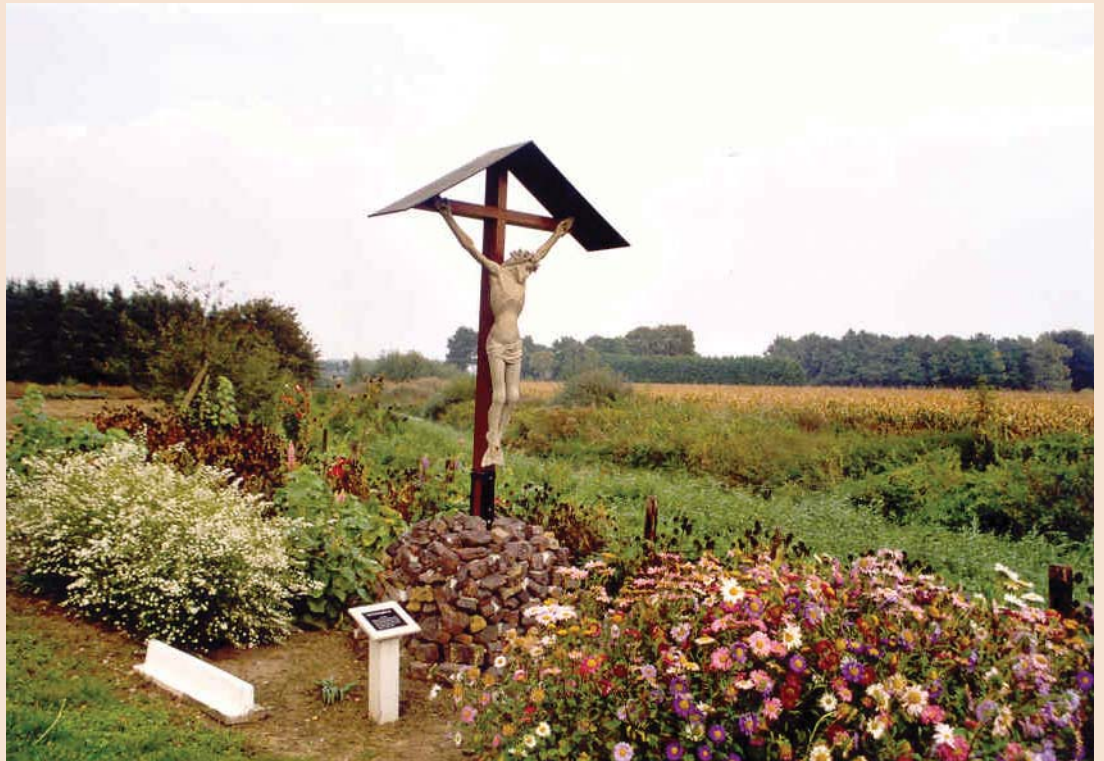
Het herinneringskruis, geschenken door de Missiezusters van het Kostbaar Bloed bij gelegenheid van hun vertrek uit Tienray in 2004