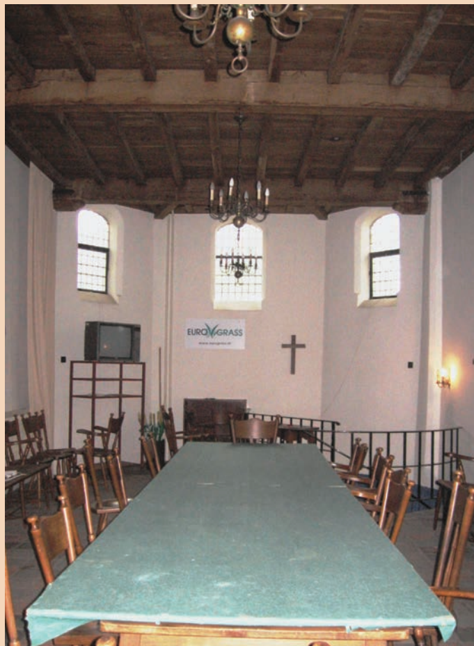
De kapel in gebruik als vergaderzaal

Het betreft hier een forse kapel. Zij oogt niet alleen groot omdat ze op een terp van ongeveer twee meter hoogte staat, ook haar maten zijn aanzienlijk. Zij is twaalf meter lang en ruim vijf meter breed, en het balkenplafond ligt op drie-en-eenhalf meter hoogte. Voorwaar een vorstelijke vergaderkamer! De muren zijn een halve meter dik en het baksteenformaat van 24 ½ centimeter sluit aan bij de bouwtijd van rond 1600.