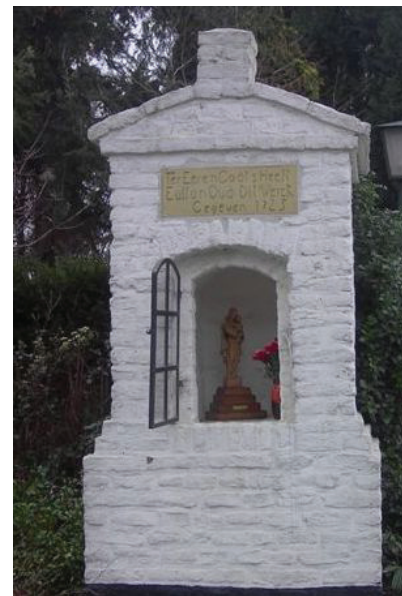
Het Middelhaover Kepelke