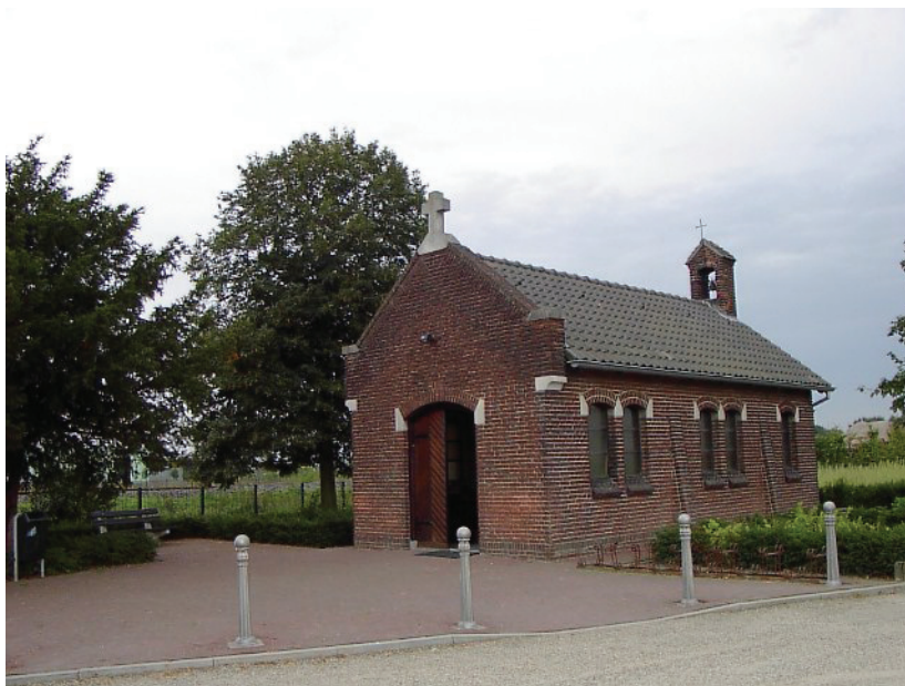
In Geloë sjteit 'n kepèlke