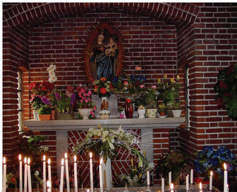
Ich doon den blumkes beej 't beeldje in de vaas