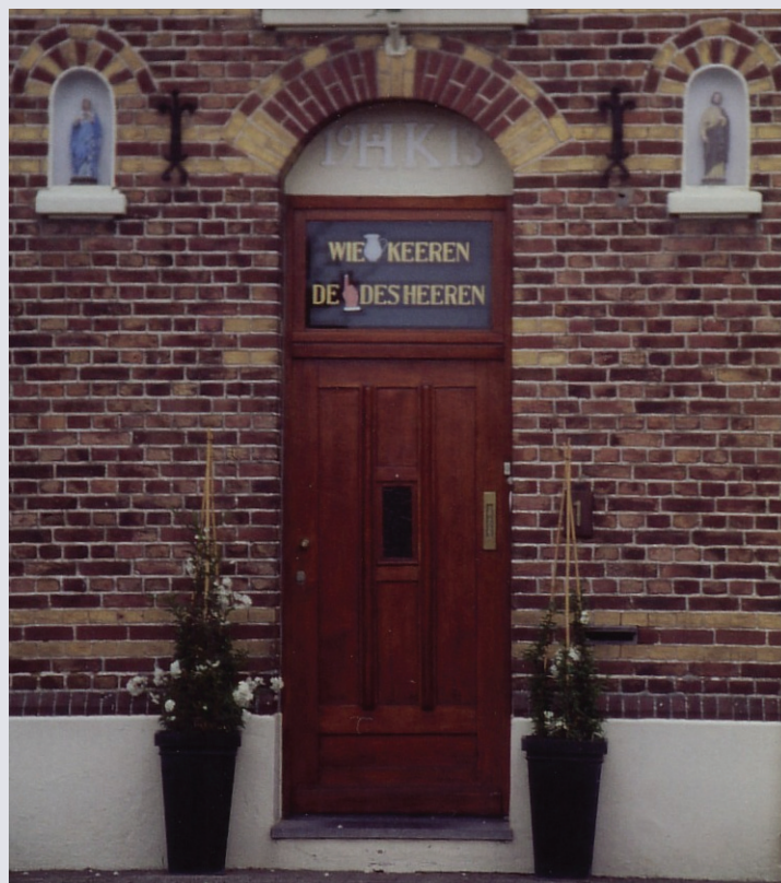
Welke vermaning staat te lezen in het bovenlicht van dit huis in Klimmen? *)