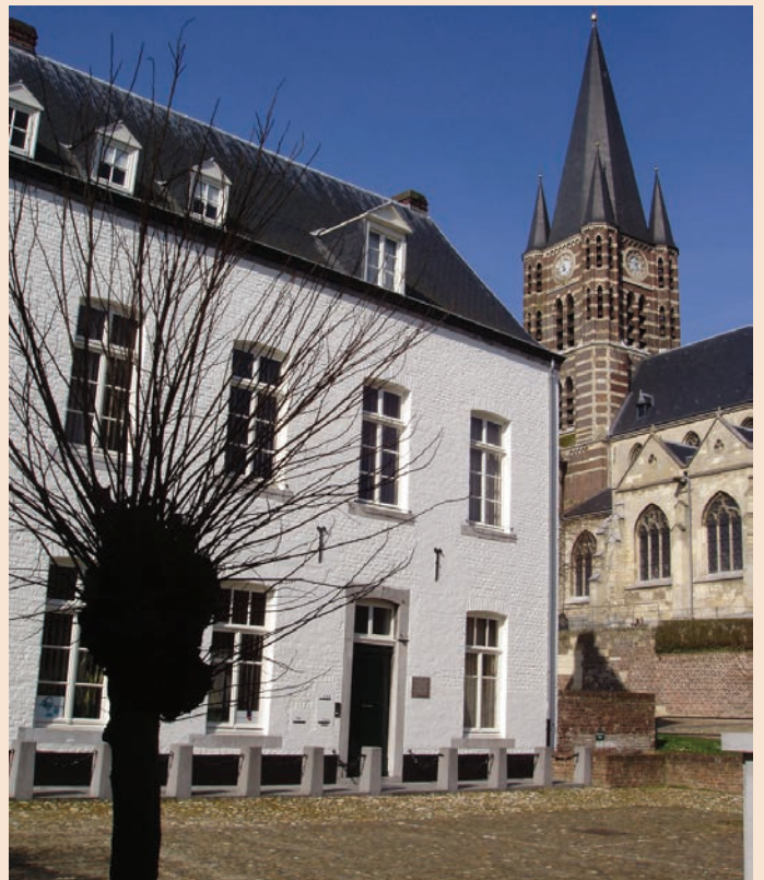
Het onderkomen van de Monumentenwacht in Thorn