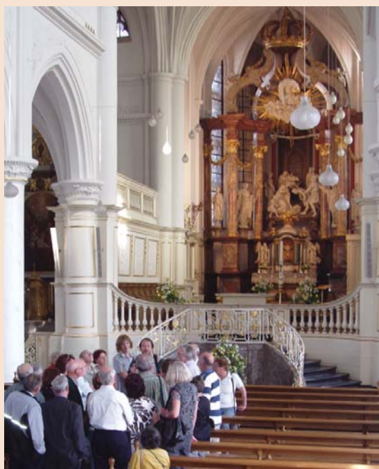
Bezichtiging van de Abdijkerk