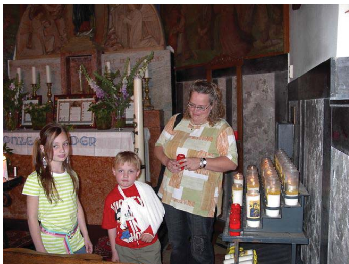
Een kleine honderd kaarsjes

De processie trekt twee keer per jaar naar de witte kapel en ook is er jaarlijks (meestal in augustus) nog altijd een openluchtmis, die veel belangstellenden trekt. Verder is er geregeld rozenkransgebed, worden er af en toe kinderen gedoopt en zijn er missen bij huwelijken en huwelijksjubilea.