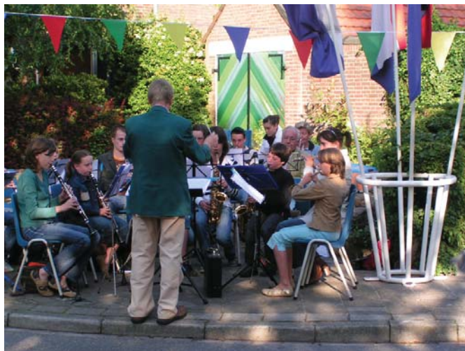
Het Jeugdorkest van Harmonie St. Augustinus

Zaterdag 19 mei was het dan zover, de straten werden versierd en natuurlijk de kapel ook. Na de avondmis van 18.00 uur in de Augustinuskerk gingen men naar de kapel, alwaar al diverse buurtbewoners en andere belangstellenden aanwezig waren.