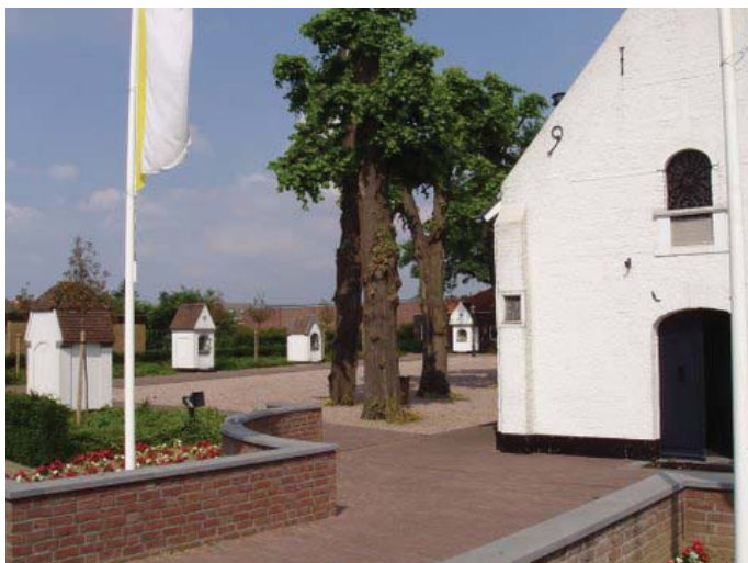
Kapel Schilberg in Echt met enkele van de zeven voetvallen

Langzamerhand werden in de gemeente Echt maar ook elders vele initiatieven ontplooid voor het in standhouden van kruisen en kapellen. Deze initiatieven werden in 1974 tijdens een vergadering in Roermond uitvoerig besproken waarbij de vraag werd gesteld of het niet zinvol was in de gemeenten of regio’s over te gaan tot de oprichting van “Stichtingen voor Kruis en Kapel”.