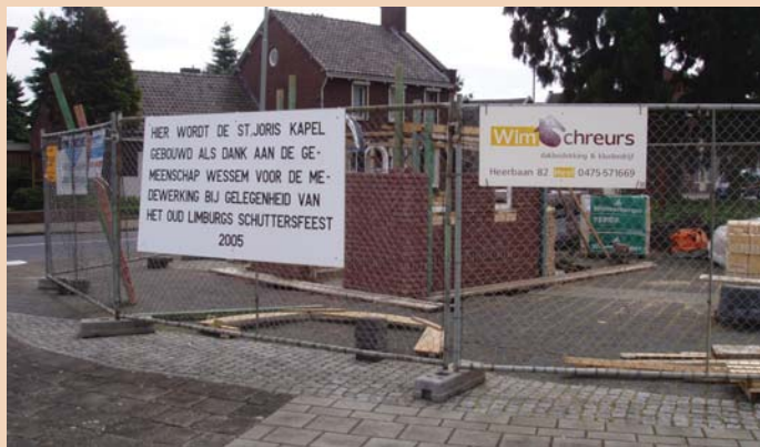
De kapel in aanbouw

Het hele dorp werd betrokken bij de organisatie en na afloop wilde de schutterij dan ook een blijvend aandenken aan het dorp schenken. Besloten werd tot de herbouw van een kapel, die in de zestiger jaren door een wegreconstructie was verdwenen.