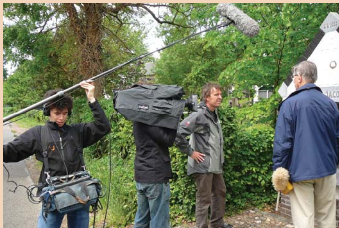
De opnamen bij de Jacobuskapel

En zo kon men op Hemelvaartsdag in het televisieprogramma de "traditionele" schoonmaak van de Thorner kapellen aanschouwen.