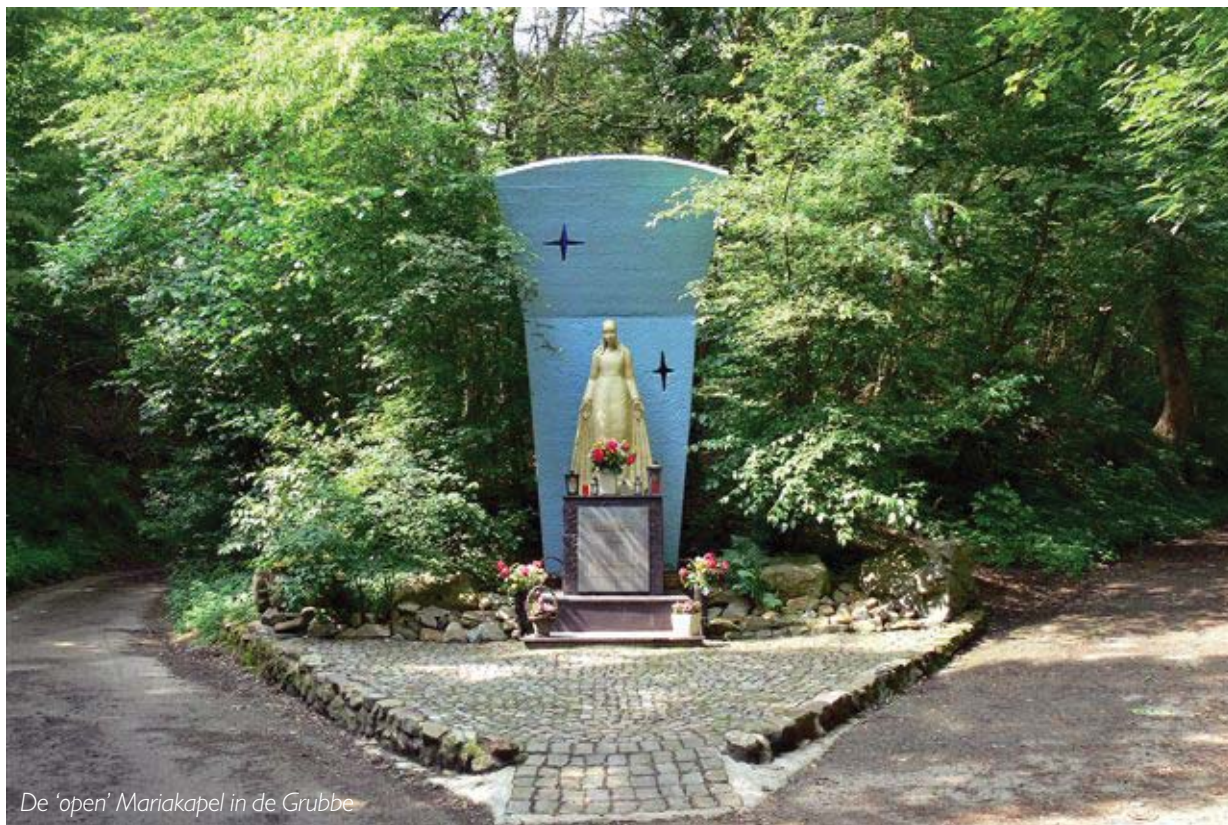
De 'open' Mariakapel in de Grubbe

Geraadpleegde bronnen: 'De kleine monumenten, Veld- en wegkruisen in de zes kerkdorpen van Schinnen'; Jo Otten (Nagelbeek)