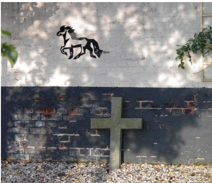
Het hervonden grafkruis

Een timmerman uit de kennissenkring was graag bereid een kruis te maken, dat paste bij het corpus en dat tevens geschikt was om te bevestigen aan de enorme wilgenboom die voor het huis staat. En een bevriende priester heeft gezorgd voor de inzegening.