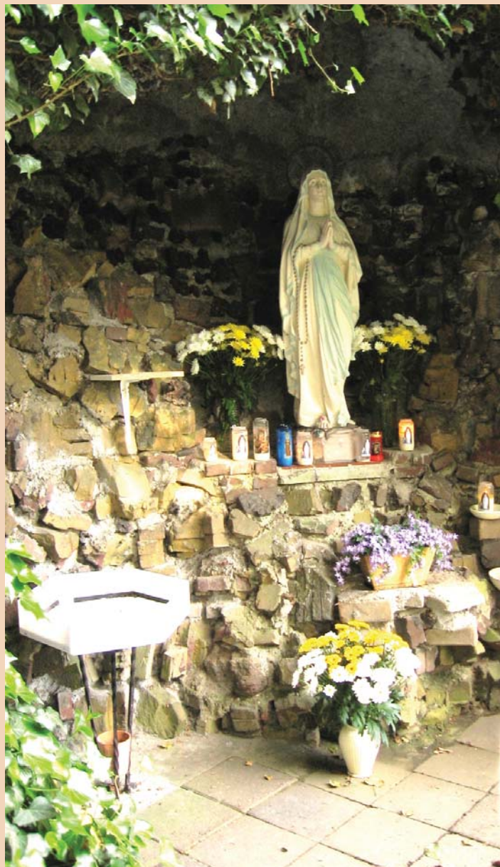
Onze Lieve Vrouw van Lourdes

Na de bouw van nieuwe appartementen op het vroegere kloosterterrein werd het drukker in de buurt. Een van de nieuwe bewoners, de heer Elbers, trof onder een berg verwilderde klimop de vervallen lourdesgrot aan en nam het initiatief om deze plek weer in ere te herstellen.