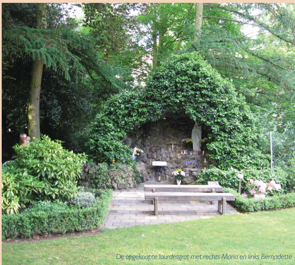
De opgeknapte lourdesgrot met rechts Maria en links Bernadette

De doorgaande groei maakte in 1930 de bouw van het Vincentiushuis noodzakelijk. Toen na de oorlog het internaat opgeheven werd, vestigden de zusters in de vrijkomende gebouwen een BLO-school voor Venray en de omliggende gemeenten. 25 Jaar later hadden 60 zusters de zorg voor patiënten in het Vincentiushuis en de Laterije, en ook steeds meer de zorg voor elkaar, want de vergrijzing nam flink toe. In december 1990 sloten de laatste zusters voorgoed de deur. 113 Jaren lang was deze plek er een van kloosterlijke naastenliefde geweest.