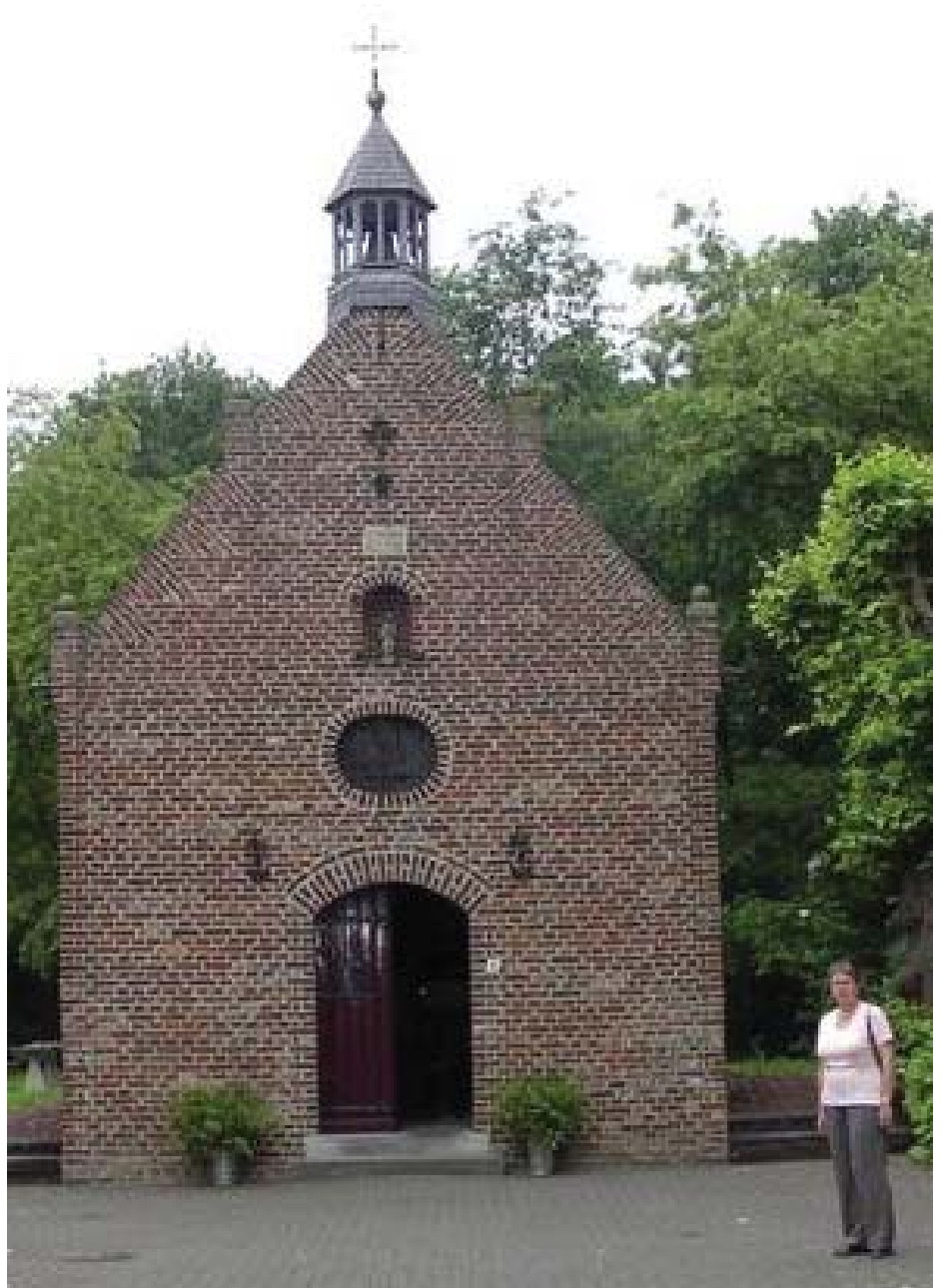
De Witte Kapel

Aan de achterzijde hangt tegen de buitenmuur een groot kruis met corpus. Op 8 januari 1945 kwamen bij een mijnontploffing bij het vlakbij gelegen patronaat zeven kinderen tijdens hun spel om het leven. Het kerkhof bij de parochiekerk kon toen niet gebruikt worden, omdat het onder vuur lag van de Duitsers, die de oostoever van de Maas nog bezetten. (Neer, op de westoever, was al bevrijd). De kinderen zijn toen begraven achter de kapel, bij het grote kruis.