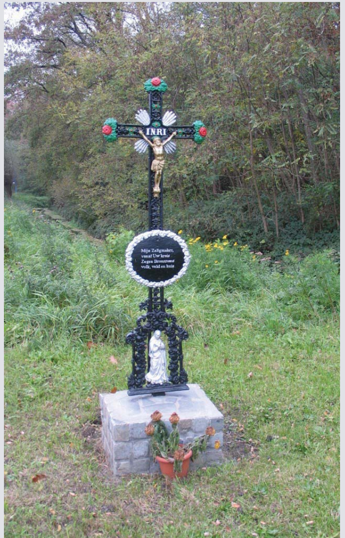
Het kruis aan de Rimburgerweg in Brunssum, dat de auteur tot dit gedicht heeft geïnspireerd.

Kent u teksten (romanfragmenten, gedichten, liedteksten, legenden of spreuken) die volgens u in deze rubriek thuishoren? Stuur ze - mét bronvermelding - op naar: Wiel Oehlen, Swier 47, 6363 CL Wijnandsrade.