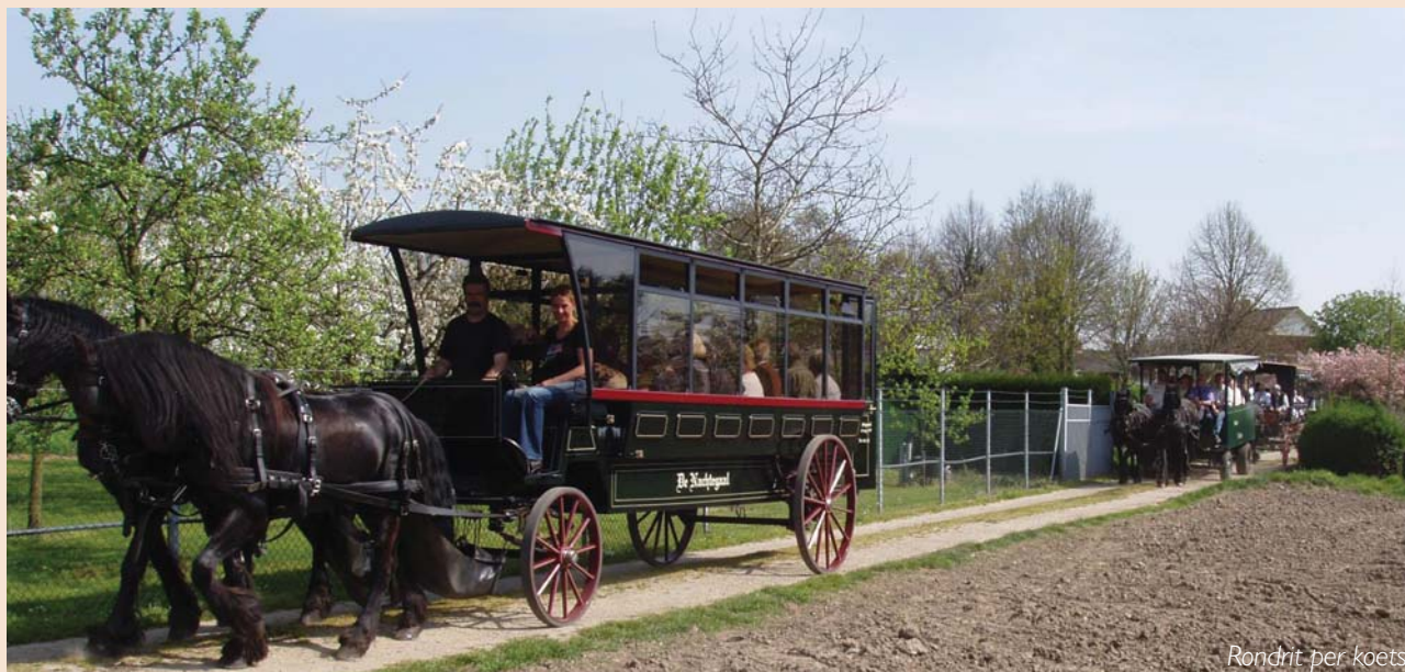
Rondrit per koets

Op zaterdag 14 april was Thorn het gezellige en zonnige trefpunt voor de deelnemers aan de jaarlijkse contactdag van de Stichting Kruisen en Kapellen in Limburg (SKKL). Meer dan zestig geïnteresseerden waren die dag, voor een gevarieerd programma, vanuit heel Limburg naar het witte stadje afgereisd.