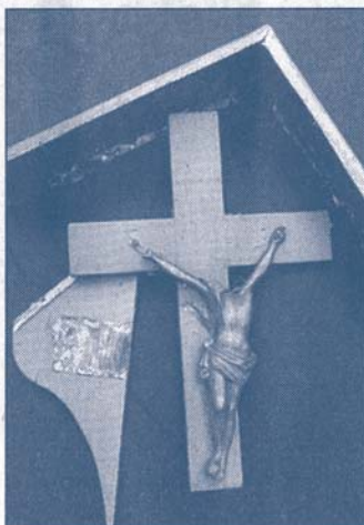
Het vernielde wegwkruis in Epen.

Chris Willems is er nog steeds een beetje beduusd van. Vandalen hebben 'zijn' wegwkruis in Epen vernield. Hij snapt absoluut niet waarom. „Dit is voor mij het toppunt van zinloosheid.”