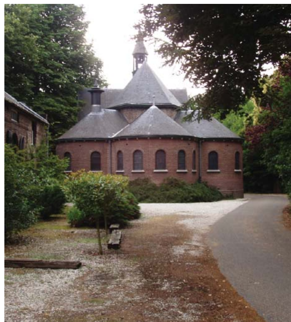
Kapel van Genooi