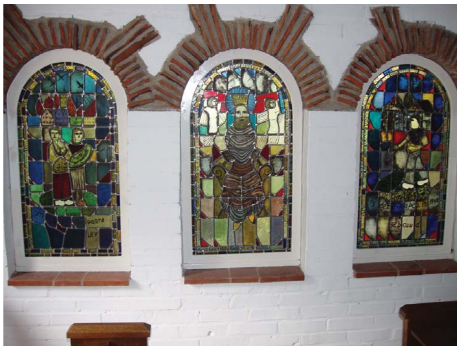
De glas in loodramen van de Kapel in het Ven

De kruisen bestaan uit gedenk-, oorlogs-, veld-, hagel- en moordkruisen. De kapellen zijn onderverdeeld in gedenk-, oorlogs-, klooster- en dagkapellen. Deze laatste categorie houdt in dat zich in twee kerken – de Familiekerk in Venlo en de Blerickse Hubertuskerk – dagkapellen bevinden, toegewijd aan respectievelijk de H. Familie en O.L. Vrouw van Goede Raad. Het kapelletje aan de Schaapsdijk is gevestigd in een voormalig wachthuisje van het Venlose vliegveld Fliiegerhorst. De Calvariegroep in het processiepark in Genooi spreekt voor zich. Wat veel mensen niet meer weten is, dat zich