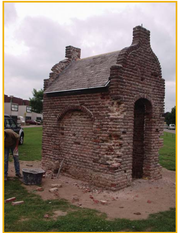
Kapel Antonius van Padua, Venray

De Monumentenwacht kan in de contacten met de leerlingenbouwplaats-organisatie bemiddelen.