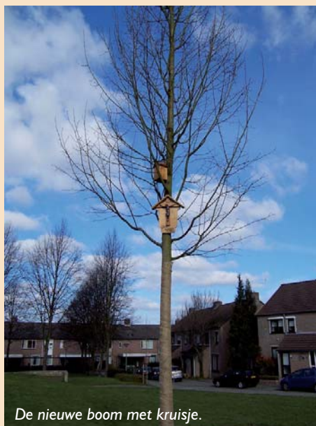
De nieuwe boom met kruisje.