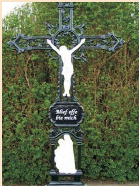
Het gerestaureerde kruis

Paus Innocentius III (1160-1216) vergelijkt de kardinale deugden met de vier kruisnagels van Christus. De theoloog Gabriël Biel (1430-1495) werkt deze vergelijking nader uit en zegt, dat de deugden voorzichtigheid, gerechtigheid, sterkte en matigheid, de vier nagels zijn waarmee wij ons samen met Christus aan het kruis moeten hechten.