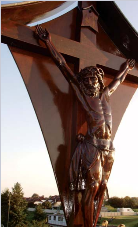
Kruis "aan de Rooj brök"