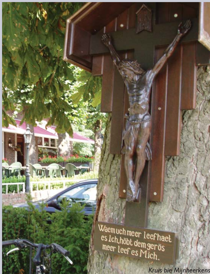
Kruis bie Mijnheerkens

“ Zo'n klein gehuchtje met 'n paar stille wegen en 'n oude boom moet bij ons vermooit worden door een Lievenheer of een Lievrouw. Welnu, Mijnheerkens heeft Goede vrijdagmiddag zijn Lievenheer gekregen. 't Is een klein, ijzeren kruisje, dat aan 't voeteneind dit opschrift draagt: Waem uch meer leefhaet es Ich, höbt dem gerös meer leef es Mich. De omwonenden hadden het kruis versierd met bloemen en groen. Nog een oud gebruik werd in ere hersteld: de Goede Vrijdag- of Passiekrans. Vroeger -en nu nog op vele plaatsen- werden en worden bij de aanvang der Passietijd of op Goede Vrijdag, groene kransen met paarse linten gehangen rond de Kruislievenheers als uiting van