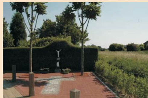
Het gerestaureerde kruis en de gerestaureerde omgeving