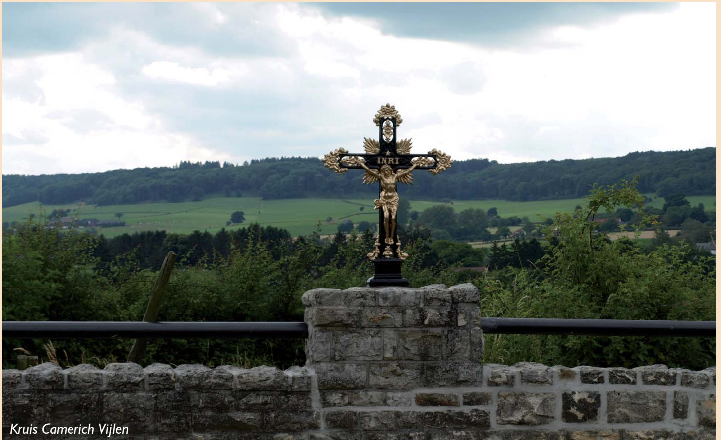
Kruis Camerich Vijlen