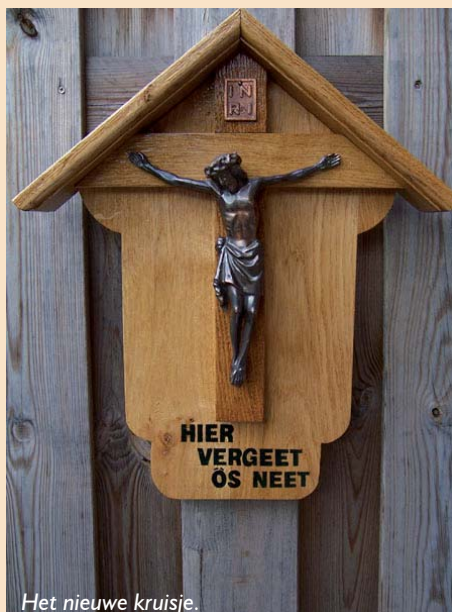
Het nieuwe kruisje.