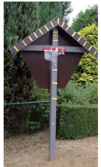
Het kruis met zijn oorspronkelijke “versiering”

Aan de bewoners van de achtergelegen woning werd uiteraard om nadere informatie gevraagd, maar beide bewoners deelden desgevraagd mede geen eigenaar te zijn en verder van niets te weten. Het enige wat zij te berde brachten was, dat de “versiering” een overblijfsel van carnaval zou zijn. Uit ingewonnen informatie van “onze man ter plaatse” bleek, dat dit kruis ooit is geplaatst door de carnavalsvereniging, zeer tegen de zin van de toenmalige pastoor en kerkbestuur. Er hangt daarom geen corpus op en er zou de opening van de boerbruiloft plaatsvinden.