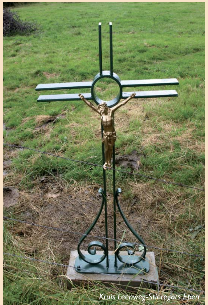
Kruis Leenweg-Stieregats Epen

Op deze plek heeft tot 1988 tegen een oude boom een houten kruis gestaan dat door vandalen in brand gestoken is.