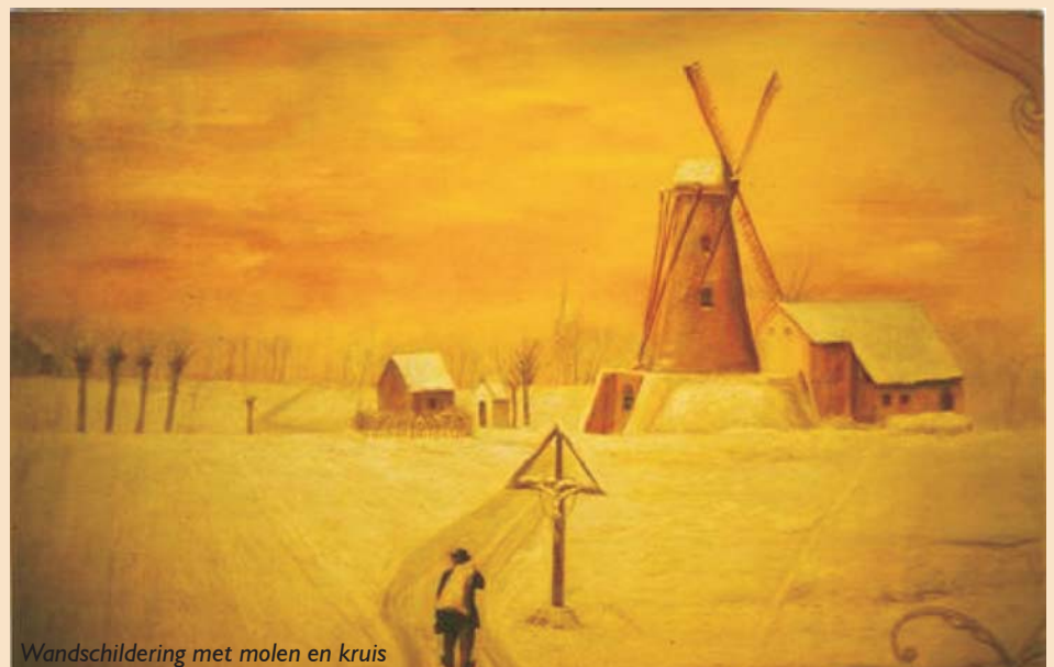
Wandschildering met molen en kruis

Dat het veldkruis, dat in het midden van de 19 e eeuw nog op een kruispunt van veldwegen stond, een "wegwijzer" was bij de veldprocessies op de eerste en tweede kruisdag is al aangegeven. Over de volksdevotie met betrekking tot het kruis kan met zekerheid worden gezegd dat men vroeger bij ernstige