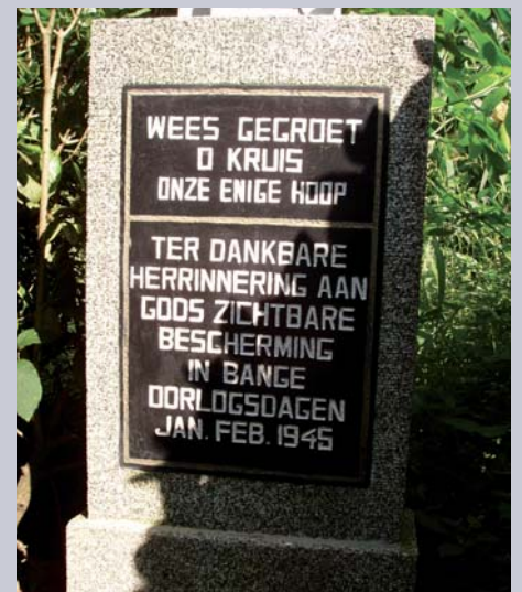
De tekst op het kruis