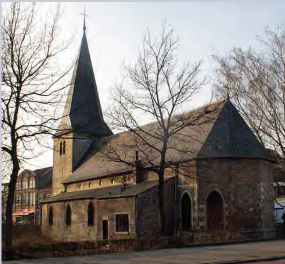
De Kleine St. Jan

In deze 'sterfakte' moesten volgens een voorschrift van omstreeks 1717 de burgerlijke staat van de overledenen worden vermeld, of men gehuwd dan wel weduwe of weduwnaar was en met vermelding van de naam van de man of de vrouw met wie men gehuwd was en de naam van de ouders als het een ongehuwde betrof. Deze voorschriften werden door de pastoors van Hoensbroek niet altijd even goed opgevolgd.