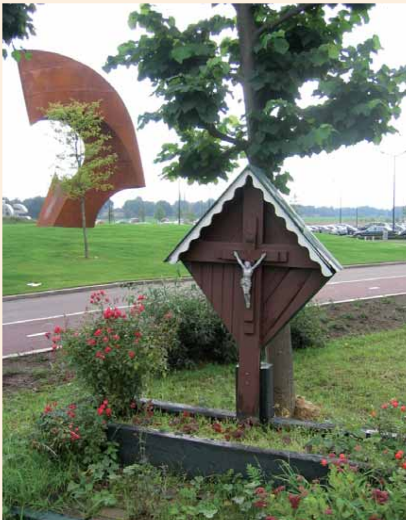
Het Bergerwegkruis in Sittard voor de renovatie.

Naast onze werkgroep zijn binnen de gemeente Sittard-Geleen de heemkundeverenigingen "Geleen", "Bicht" en "De Lemborgh" actief op dit gebied bezig.