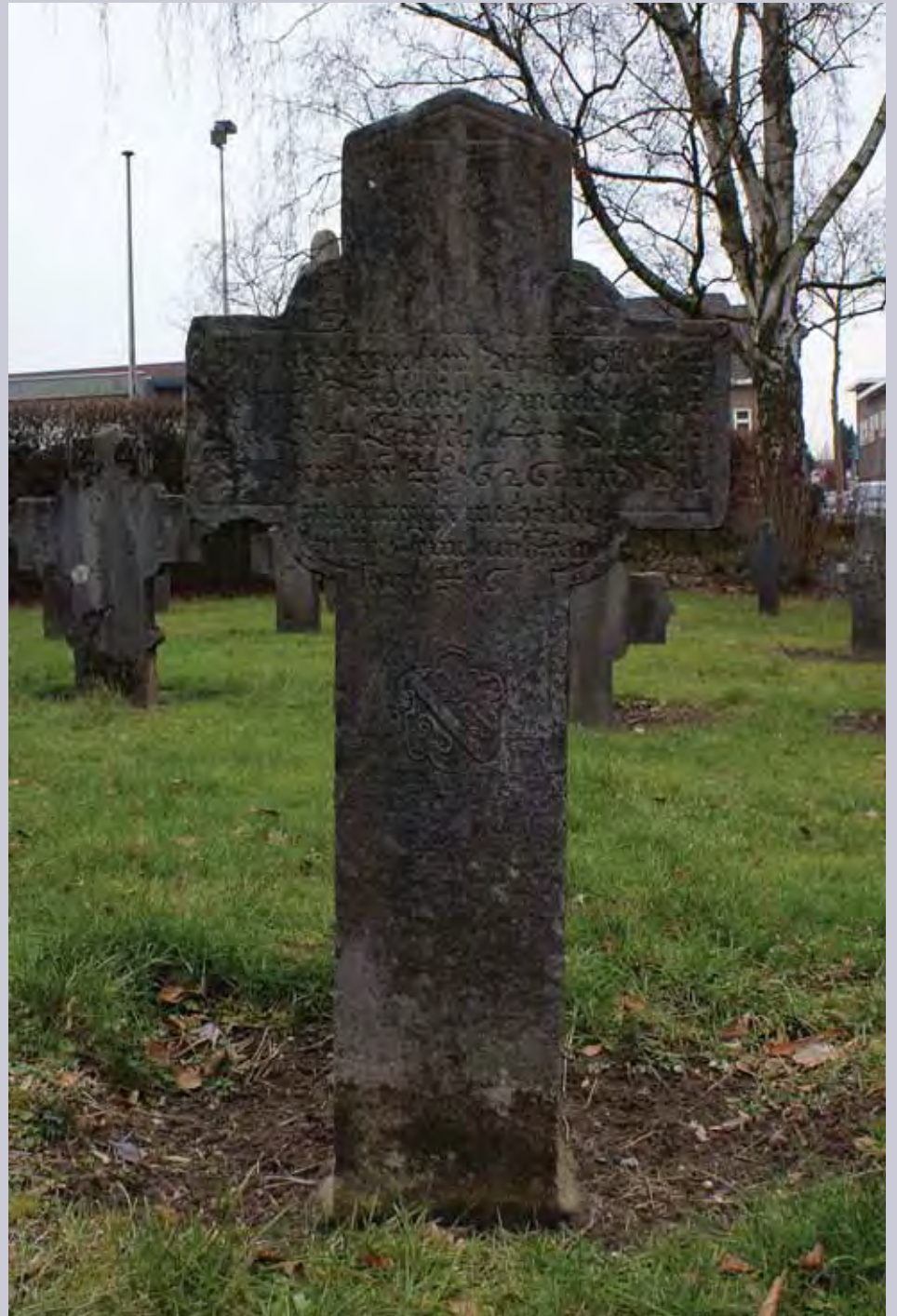
Grafkruis Nicolaus Winandts en Mechtildis Meijers