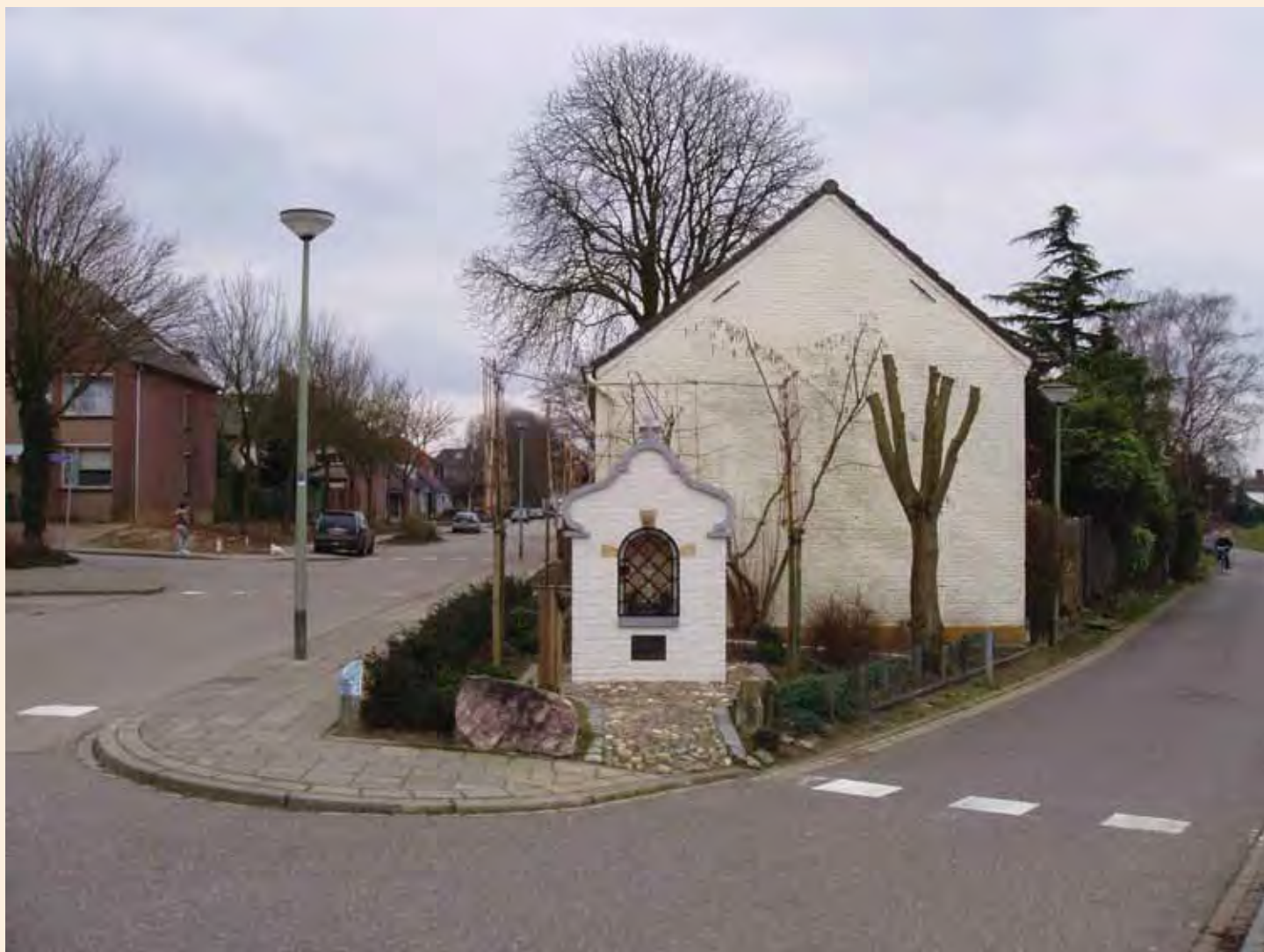
De Jacobskapel in Herten, die in 2008 door de schrijver van dit artikel nabij zijn woning werd gebouwd.

Zijn wegkruisen en -kapellen louter nostalgie, relictten uit een voltooid verleden tijd?