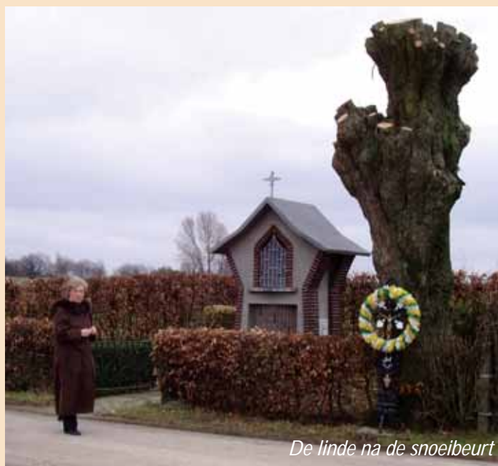
De linde na de snoeibeurt

Medewerkers van IKL hebben een hoogwerker ingezet bij het zware knotwerk. Na het afzagen van de taken loopt het loof van de boom dit voorjaar weer uit, zodat het geheel, de kapel en de boom tijdens de familieviering rond het 50-jarig bestaan van de Corneliuskapel op de laatste zaterdag van juli er verzorgd uit zullen zien.