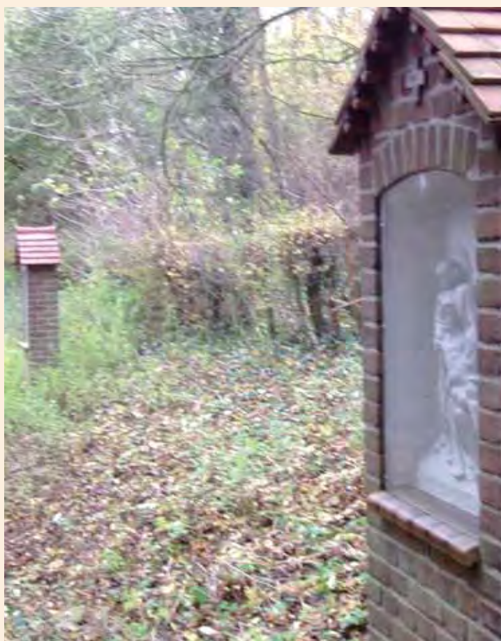
De verwaarloosde kruisweg bij het complex Watersley, dat in de verkoop staat. De Werkgroep spant zich om dit religieus monument te behouden.

Met een gezamenlijke 'kennisbank' kunnen al deze zaken beter en makkelijker beheerd en aangevuld worden.