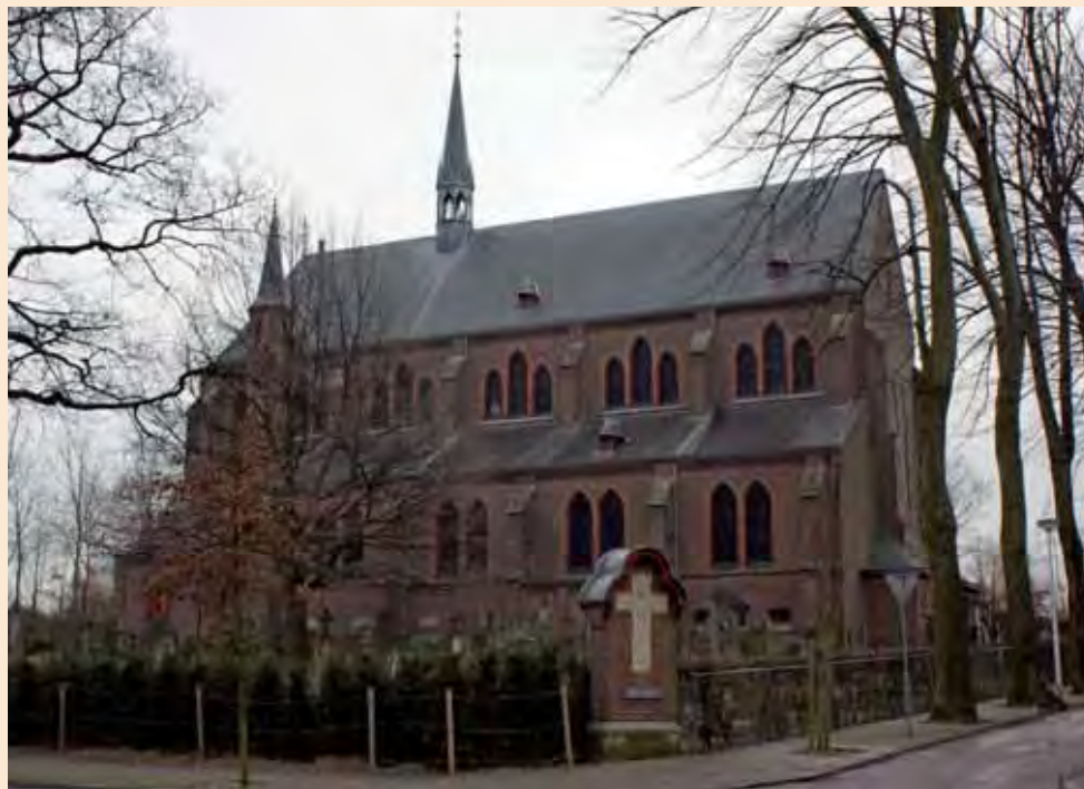
Grote St Janskerk Hoensbroek

Op zaterdag 18 april vindt de contactdag 2009 van de Stichting Kruisen en Kapellen in Limburg (SKKL) plaats. Het bestuur van de SKKL heeft de contactdag enkele jaren geleden in het leven geroepen, als een jaarlijkse ontmoeting met de lokale organisaties en veldwerkers die onmisbaar zijn voor het behoud en onderhoud van de monumentjes van vroomheid in Limburg.