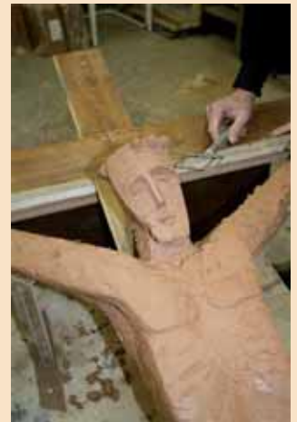
Het nieuwe corpus.

Maar dan breekt het spannende moment aan, we gaan naar zijn atelier. Van onder een groot zeil komt het corpus in wording tevoorschijn.