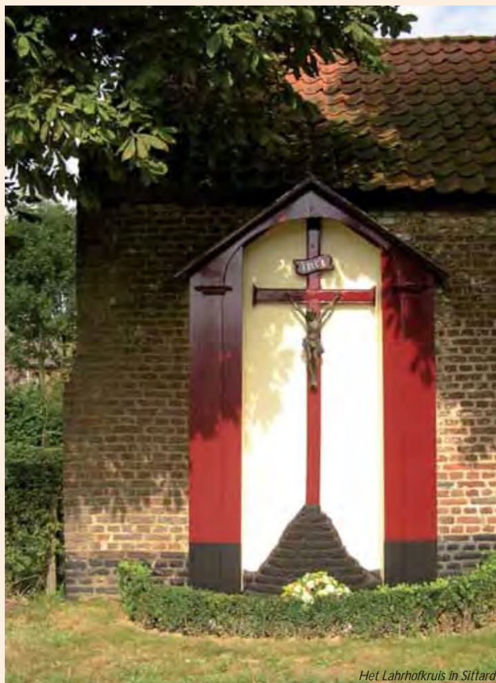
Het Lahrhofkruis in Sittard

Door een zo compleet mogelijke inventarisatie en documentatie kan men komen tot een goed naslagwerk, waarin ook de historische achtergronden verwerkt kunnen worden. Voor deze inventarisatie kunnen wij beschikken over gegevens van het stadsarchief van de gemeente Sittard-Geleen, de Stichting Kruisen en Kapellen in Limburg en natuurlijk over de historische gegevens, die bij de vereniging "Sittards Verleden" aanwezig zijn.