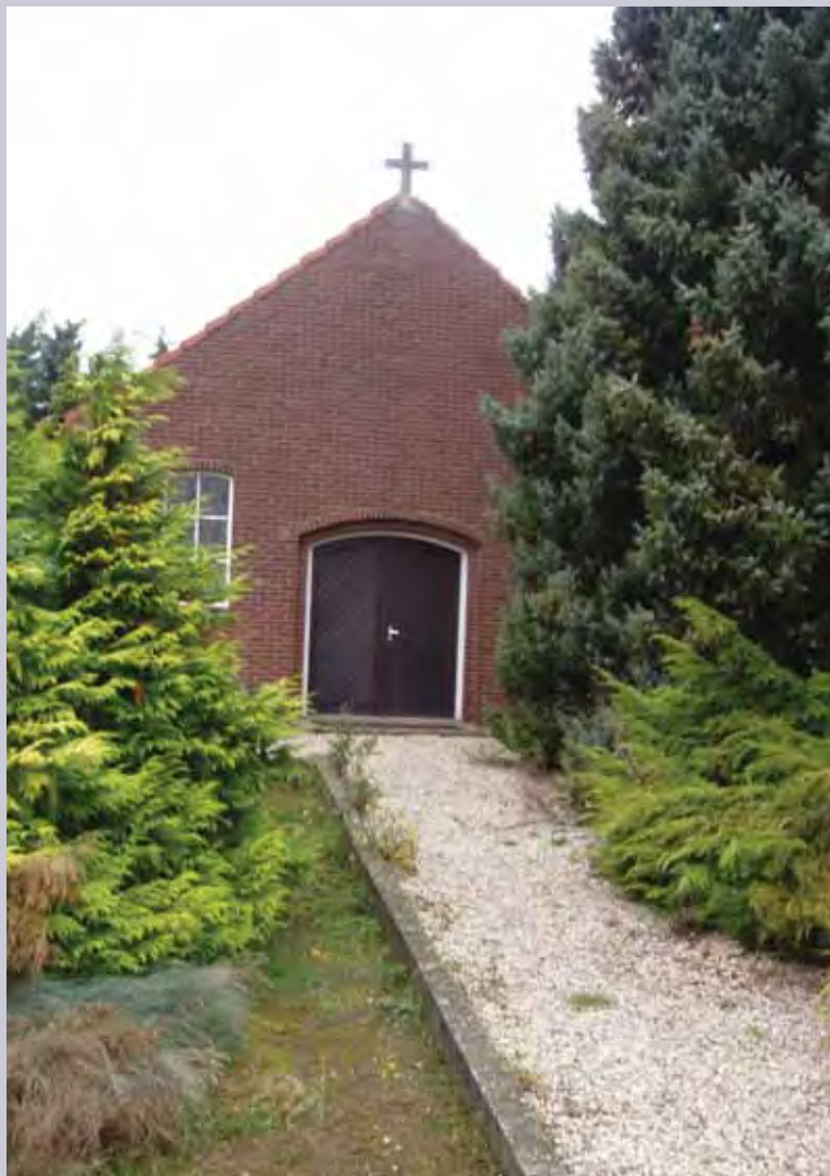
De Onze Lieve Vrouw van Fatima-kapel.

"Het gebouw heeft een belangrijke rol gespeeld in de buurtschap en in de regio en het straalt ook de eenvoud van het platteland uit. Daarnaast heeft het streekmuseum een hele hoop devotionalia die in het gebouw een plekje zouden kunnen krijgen" , aldus voormalig directeur Litjens.