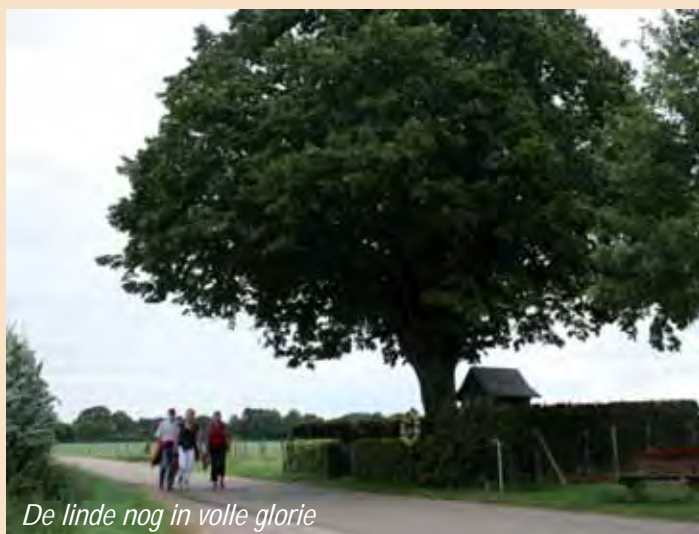
De linde nog in volle glorie

De markante lindeboom bij de St. Corneliuskapel tussen Terhorst en Terlinden in de gemeente Margraten is onlangs geknot door medewerkers van de stichting Instandhouding Kleine Landschapselementen in Limburg, IKL. In het midden van de jaren tachtig werd de boom aan de Voerenstraat voor het laatst geknot. De knotbeurt van de prachtige veldboom vindt plaats vanwege de viering van het vijftig jarig jubileum van het kapelletje op de laatste zaterdag van juli volgend jaar.