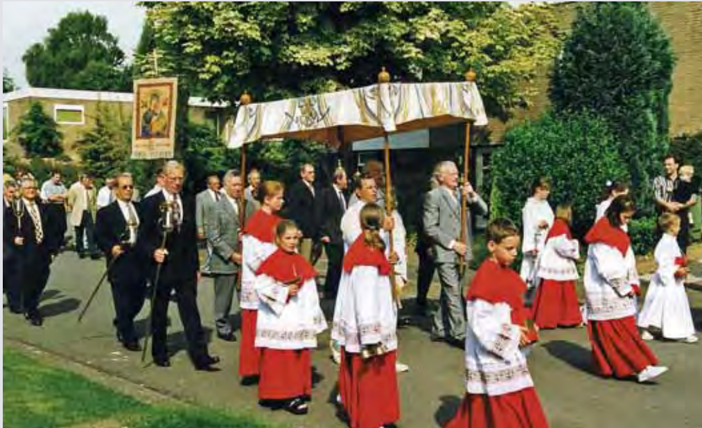
... na de hoogmis de processie zou uittrekken ...

Kruisen en kapellen hebben in de loop der eeuwen vele schrijvers, dichters en troubadours geïnspireerd. In de vaste rubriek 'Veldboeketje' ruimen wij een plekje in voor een romanfragment, gedicht, liedtekst, legende of enkele spreuken; geïnspireerd op de ontelbare monumentjes van vroomheid in het Limburgse landschap. Deze keer een sfeervolle beschrijving van de hand van mevrouw I. Nulens-Zéguers van een Sacramentsprocessie, zoals die in haar jeugd feestelijk door de straten van haar dorp trok.