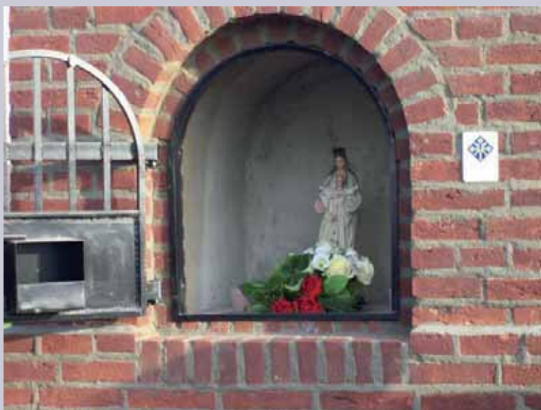
Het oorspronkelijke Mariabeeldje