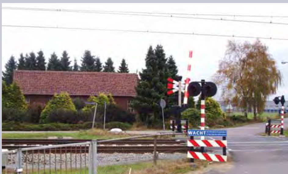
Langs de spoorlijn Venlo – Eindhoven.