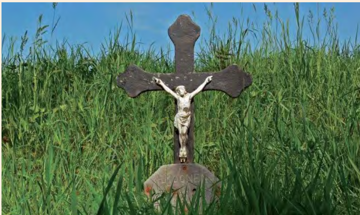
Het inmiddels verdwenen kruis in Retersbeek