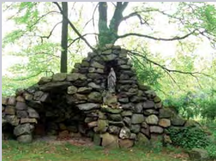
De Lourdesgrot van Oostrum ligt tegenwoordig verscholen in het park

Er kwam een Mariabeeld van steengoed uit een Midden-Limburgs atelier in de hoge nis te staan. Ook werd ruimte gecreëerd voor een beeld van Bernadette, maar dat is er nooit gekomen.