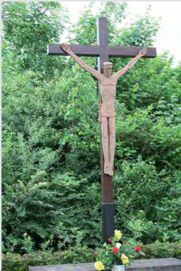
Het Paul Vinckenkruis