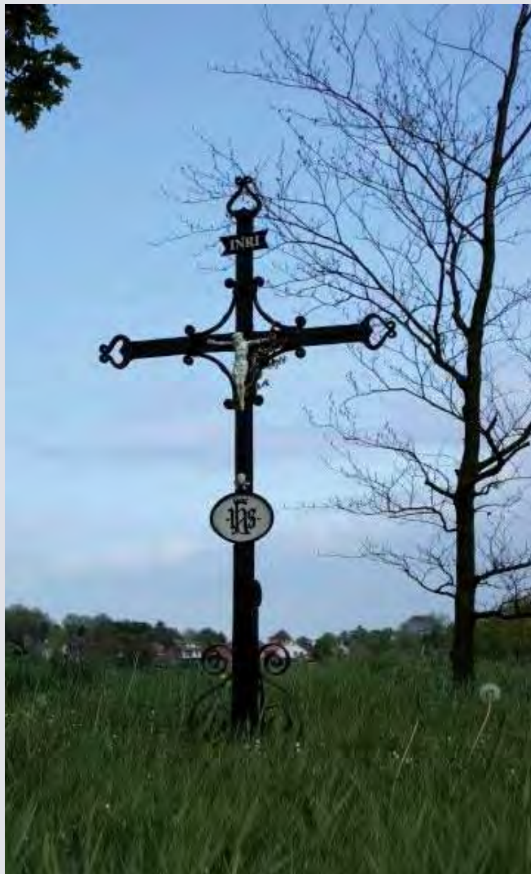
Broenshemweg Margraten

Kent ook u teksten (romanfragmenten, gedichten, liedteksten, legenden of spreuken) die volgens u in deze rubriek thuishoren? Stuur ze – mét bronvermelding – op naar: Wiel Oehlen, Swier 47, 6363 CL Wijnandsrade.