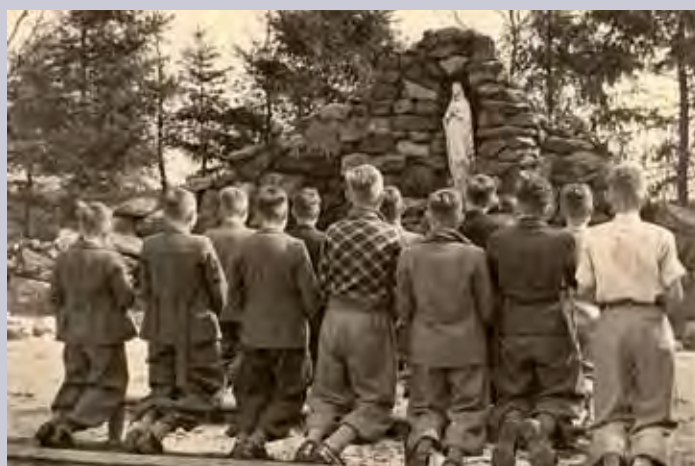
Studenten van het juvenaat gaan in 1938 op de knieën voor het Mariabeeld in hun zelfgemaakte grot