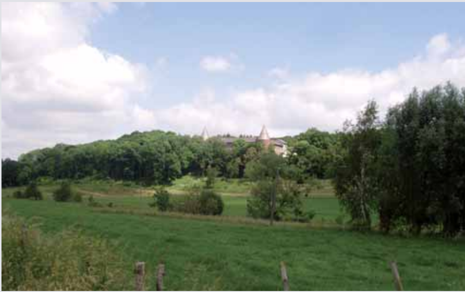
De abdij, gezien vanaf de rotonde