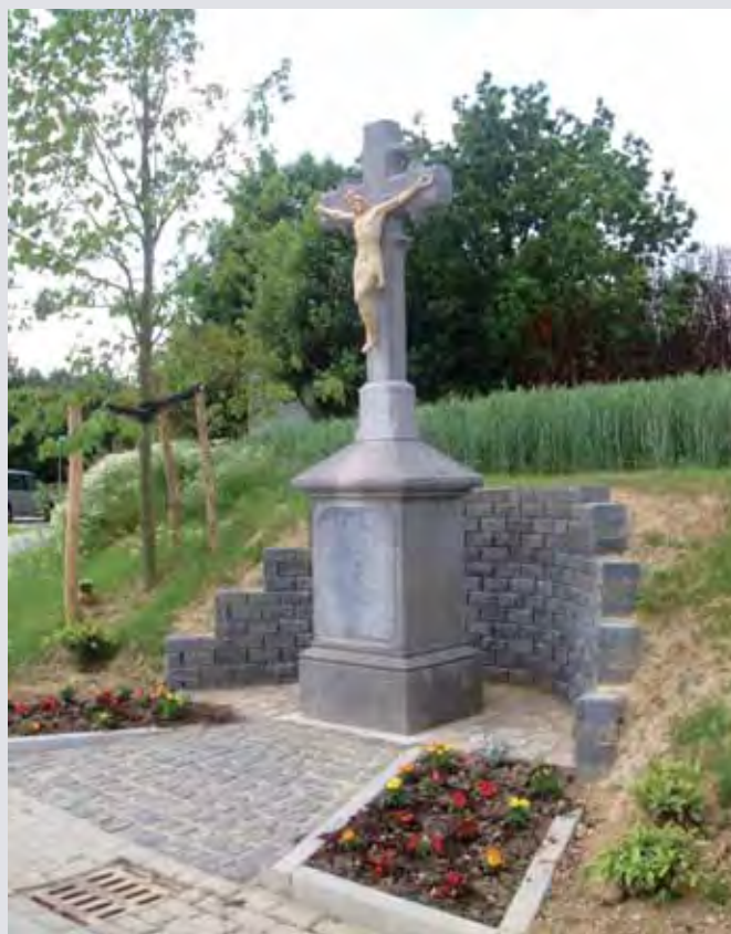
Het kruis op zijn nieuwe locatie

De in binnen- en buitenland vermaarde monnik-architect Dom Hans van der Laan (1904 -1991) voegde aan de archaisch aandoende "Duitse" abdij een crypte (1962) toe met daarboven een kerk met atrium (1968). In 1987 voltooide hij zijn levenswerk door de toevoeging van een sacristie en bibliotheek met tweede binnenhof en afsluitende open zuilengalerij. Zijn schepping trekt tegenwoordig architectuur-studenten van over de hele wereld.