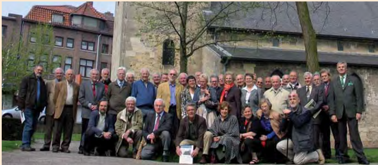
De deelnemers aan de Contactdag voor de Kleine St. Jan.