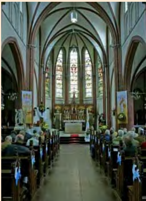
De Grote Sint Jan

De Contactdag is in het leven geroepen om de vele lokale organisaties en veldwerkers die zich inzetten voor het behoud en onderhoud van kruisen en kapellen te informeren over de activiteiten van de Stichting Kruisen en Kapellen in Limburg (SKKL) en om hen in een informele sfeer de ruimte te bieden bij te praten en nieuwe contacten te leggen.