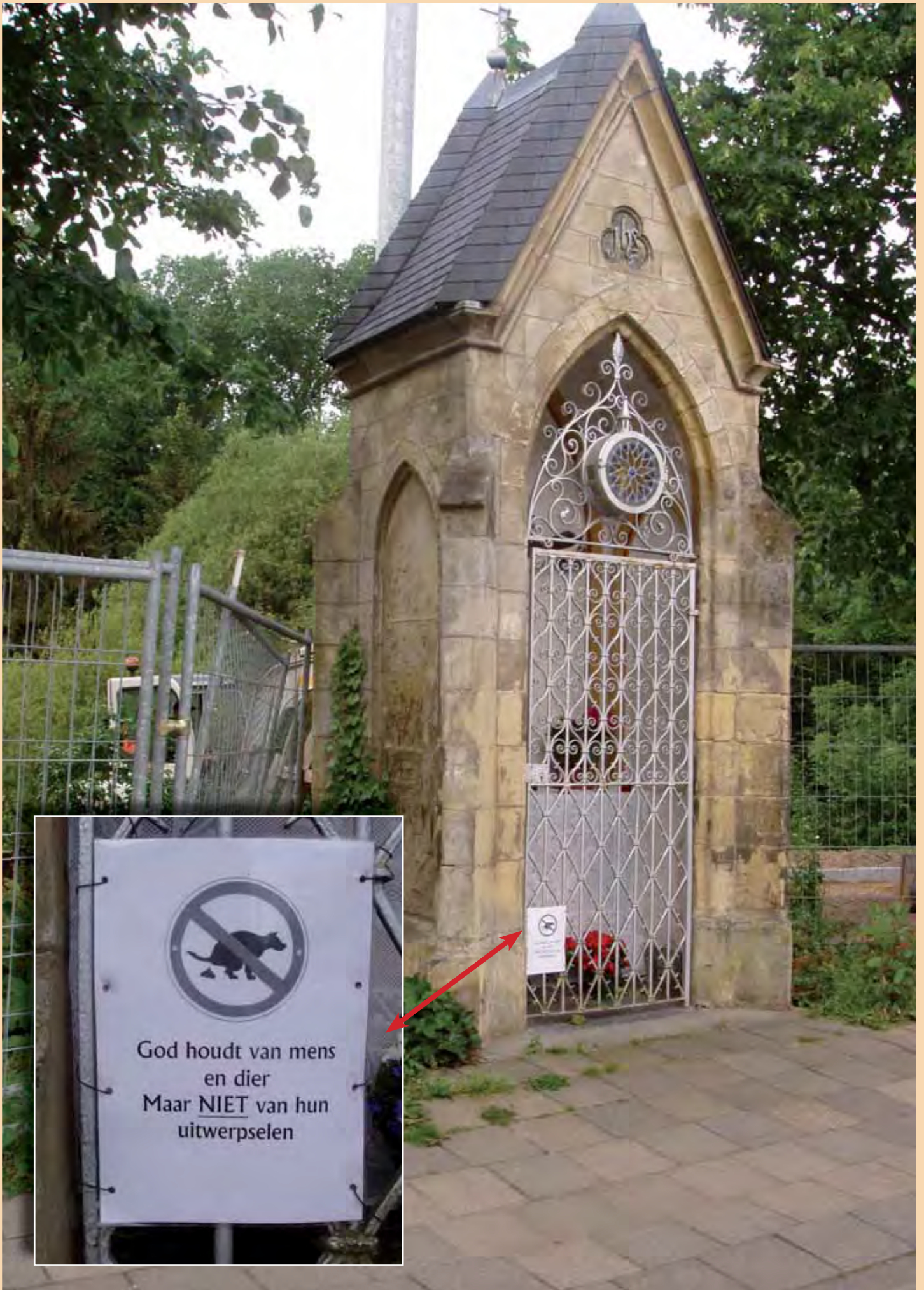
Kruiskapel Kapellerlaan Roermond