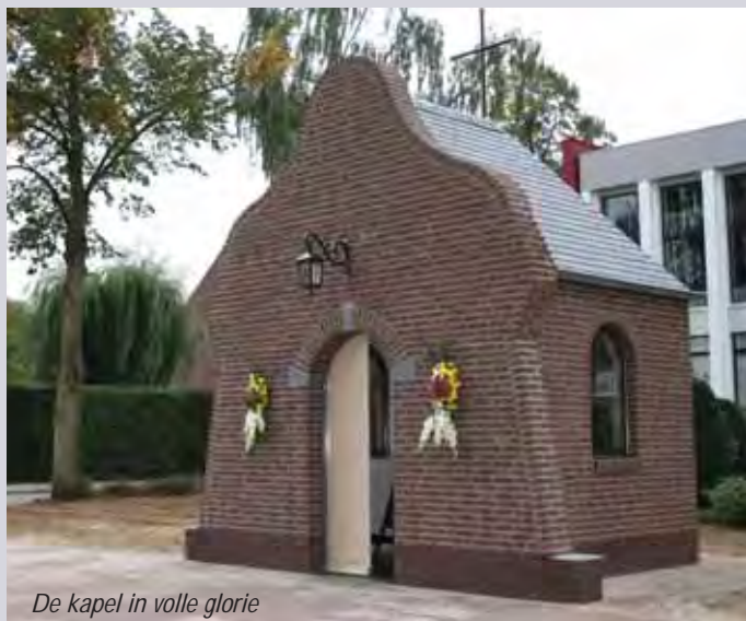
De kapel in volle glorie

De voorgeschiedenis van de nieuwe kapel, toegewijd aan “O.L. Vrouw Koningin van het huisgezin”, is in dit tijdschrift reeds eerder beschreven in het artikel ‘Een nieuwe oude kapel terug in Linne’ 1 .