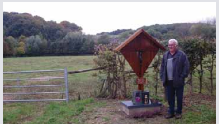
Het herstelde kruis aan de Prinses Beatrixsingel in Valkenburg met het opschrift "Aanzie het kruis – Aanbid het niet – Aanbid de Heer – Wiens beeld gij ziet."