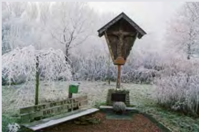
Het Tiroler kruis in Tiroolse sfeer