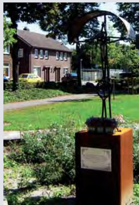
Het gerestaureerde kruis