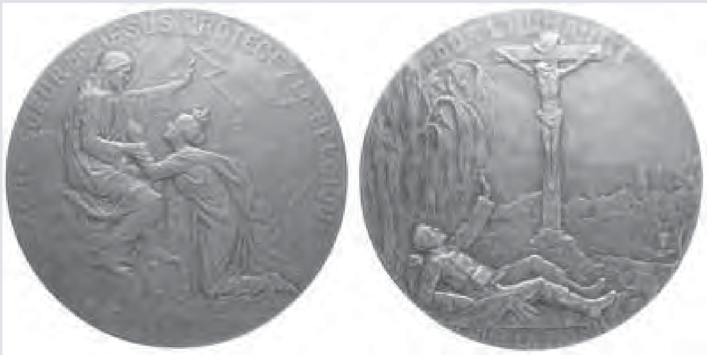
De penning met het veldkruis

Begin oktober kreeg ik veilingcatalogus nr. 28 binnen van Munthandel Karel de Geus uit Veldhoven. Mijn aandacht ging onmiddellijk uit naar lot 1516, een zilveren penning. Daarop is onder andere een veldkruis afgebeeld.