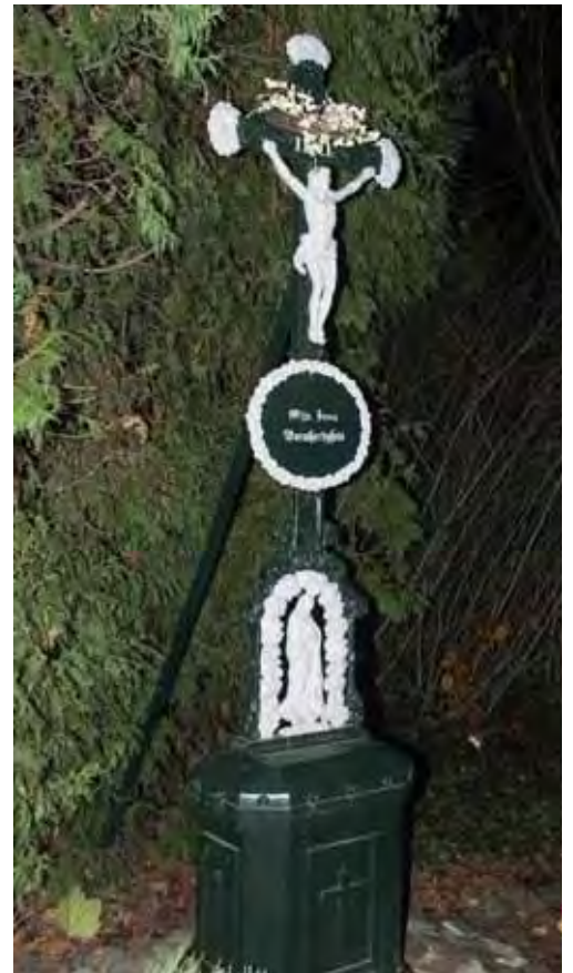
Het gerestaureerde wegkruis

Door navragen van de Heemkundevereniging Heerlerheide bij de gemeente Heerlen is er toch voor gezorgd dat het kruis weer in volle glorie op de oude plaats terug geplaatst is. Tevens is er voor gezorgd door het kruis op een verhoging te plaatsen dat het risico van beschadiging verkleind wordt. De juiste ouderdom van dit kruis is, zoals vele kruisen niet meer te achterhalen maar op een kaart uit 1912-1913 staat het al aangegeven. (Bron: kaart 763 van de Historische Atlas Limburg).