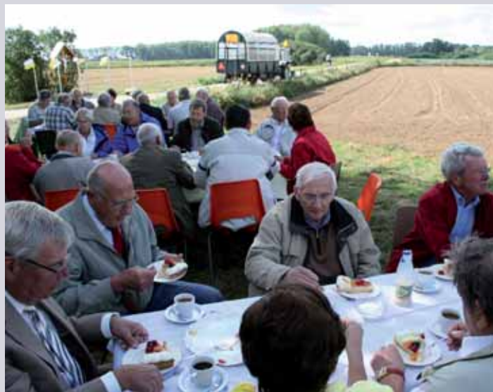
Na de inzegening in de tuin van de familie van Osch

Na de pauze konden degenen die intussen de vermoeidheid in de benen voelden de spieren verder sparen en gebruikmaken van een huifkar. Even later bereikten we het St. Antoniuskapelletje. Deze heilige, die aangeroepen wordt voor het terugvinden