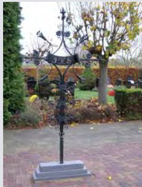
Het kruis geplaatst te midden van de graven