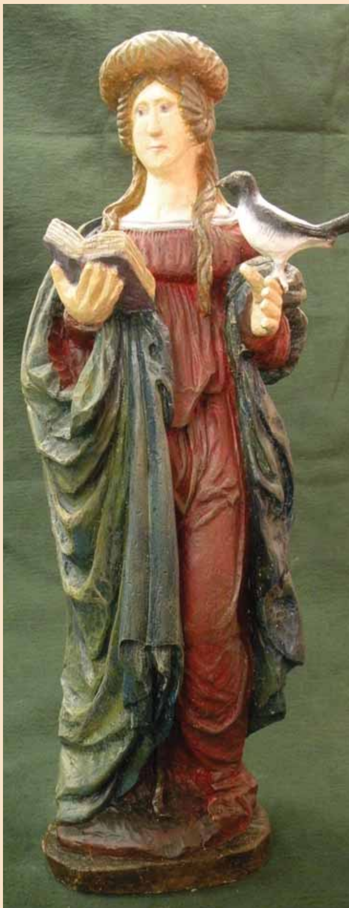
De H. Oda in kunststof

Onder deze titel wordt van 2 december 2009 tot 6 januari 2010 een dubbeltentoonstelling gehouden in de openbare bibliotheek van Venray BiblioNu en de publiekshal van het gemeentehuis. Te zien zijn een aantal beelden uit de Venrayse veldkapellen en allerlei informatie over hun achtergronden. In museum 't Freulekeshuus is in de vaste collectie een aantal originele antieke beelden te bekijken.