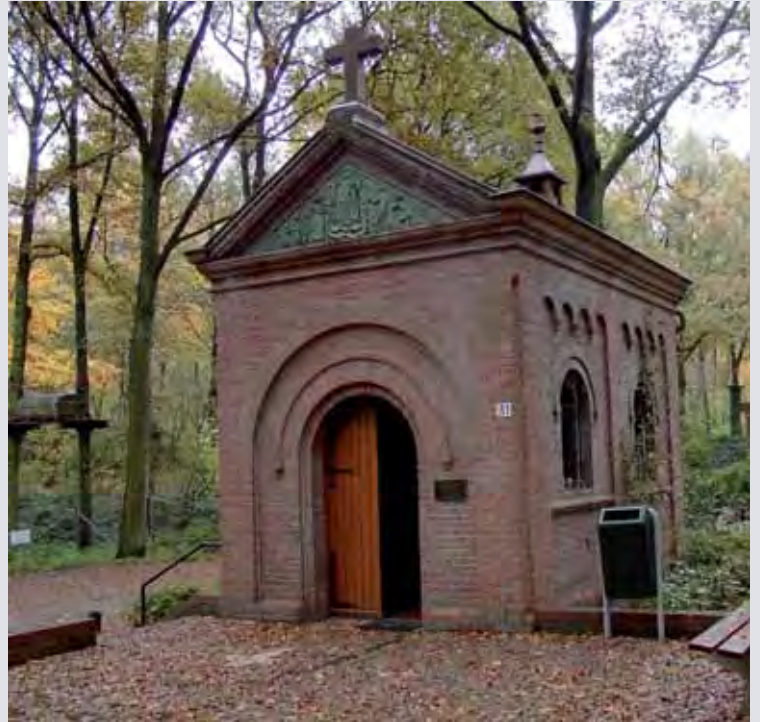
De kapel uit 1926