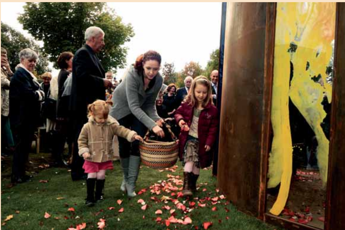
De rozenblaadjes ...