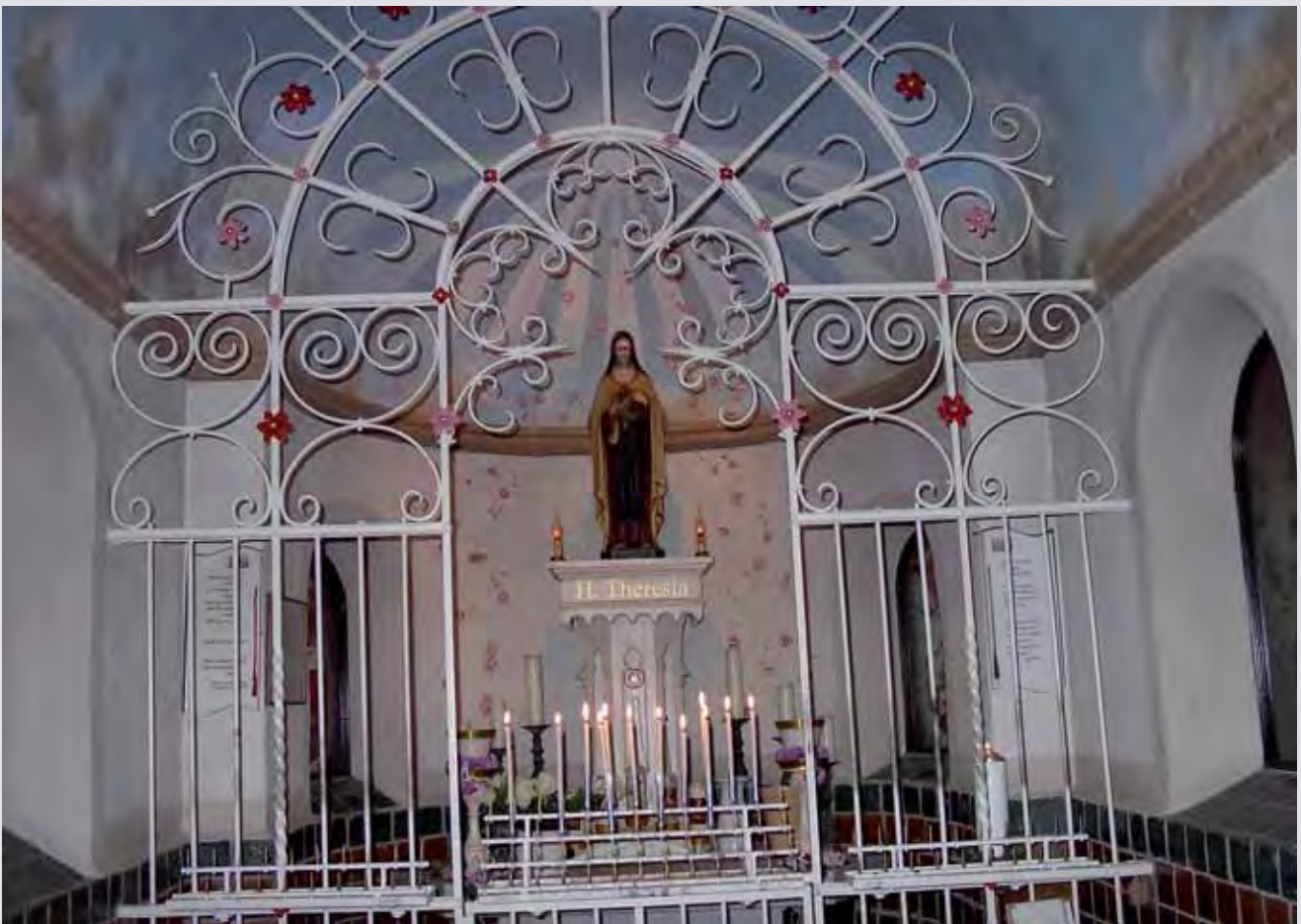
Het interieur met het beeld, gemaakt door Suzanne Nicolas

Rondom de kapel is een zeer fraaie zitgelegenheid gemaakt, omzoomd door een uitgebreide beplanting met veel rozen. Het geheel is uitstekend toegankelijk, ook voor invaliden. Boven de ingang vinden we een bijzonder mooie timpaan, uitgevoerd in groen geglazuurde klei met een voorstelling van de Heilige Theresia als patroonheilige van de missie en van het gezin. Het ontwerp is van Frans Tuinstra.