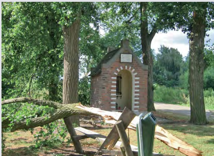
De ravage rond het Annakapelletje aan de Scheiweg in Leunen

De tocht naar het kapelletje deed het ergste vrezen. Afgeknapte bomen, half afgerukte takken in de kruinen, dakpannen op straat, en omgewaaide bomen tegen gevels van huizen. Zou het kapelletje er nog wel staan? Van ver was al te zien, dat er afgerukte takken bij het bedehuisje lagen.