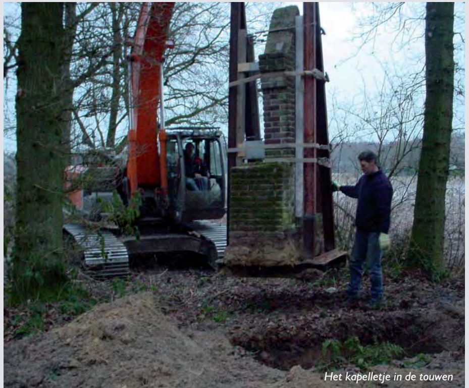
Het kapelletje in de touwen