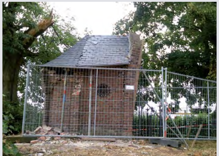
De vernielde Annakapel in Horst

In Horst in het helaas anders gelopen. De storm heeft er voor een groot probleem gezorgd. Op een (graf?)heuvel staat – nu helaas wat verloren op de overgang van het industriegebied naar de velden en weiden – de Annakapel. De eeuwenoude kapel aan de Sint Annaweg is omgeven door een aantal forse lindebomen. Een zware tak werd afgerukt en heeft het dak en de muren flink beschadigd.