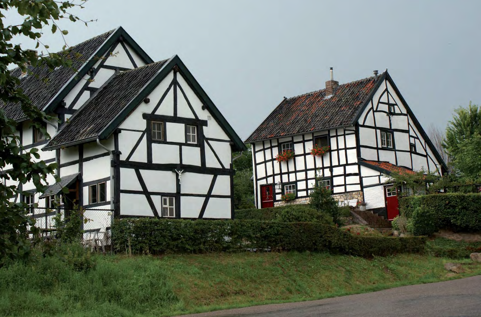
Jan Jansen, geen onbekende bij de lezer van "Kapellen en Kruisen", zag in de buurtschap Terziet bij Epen een vakwerkhuis met kruisbeeld aan de voorgevel. Het werd een foto, waarbij woorden verder overbodig zijn.