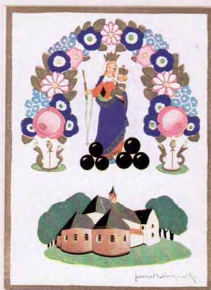
ONZE LIEVE VROUW VAN GENOOI, VENLO