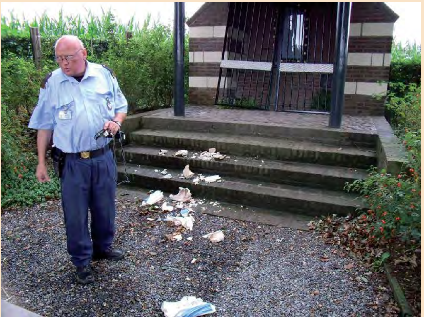
De politie onderzoekt de zaak