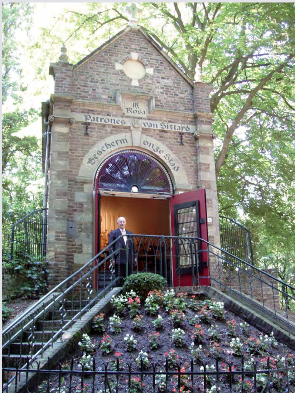
De kapel, gereed voor de Sint Rosadag