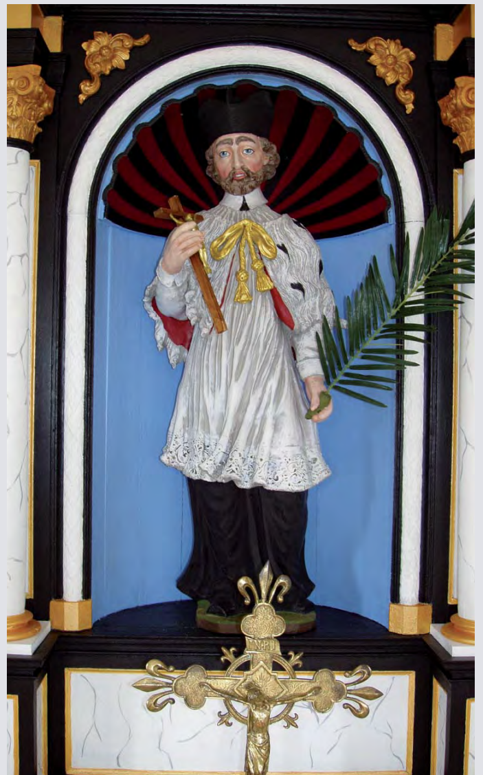
Het beeld van Nepomucenus in Thorn