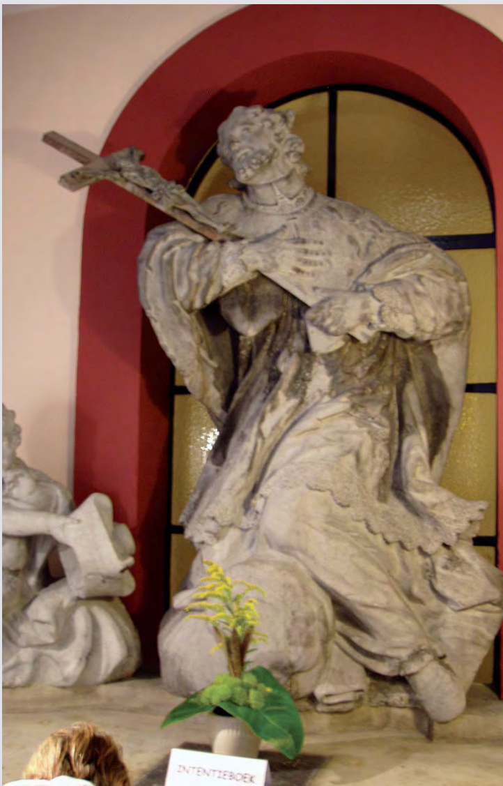
Het beeld van de heilige in Wittem

Toen de Redemptoristen in 1836 het klooster overnamen, verhuisde Nepomucenus naar de kloostertuin. In 1961 werd de nieuwe kapel gebouwd. Het beeld kreeg daarin een ereplaats.