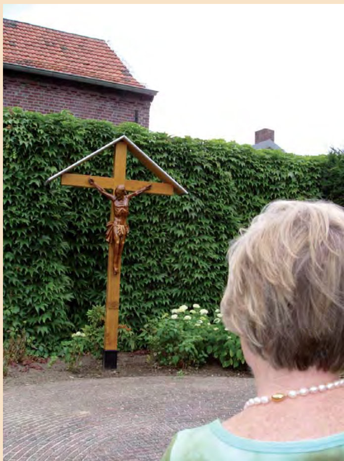
Het nieuwe veldkruis in de tuin van Sint Jozef