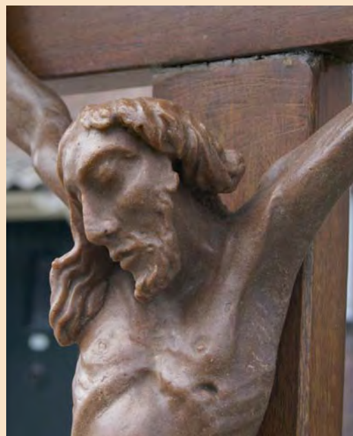
Detail van het corpus