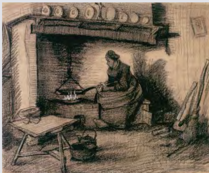
Tekening van Vincent van Gogh van de schouw met daarop een kruis