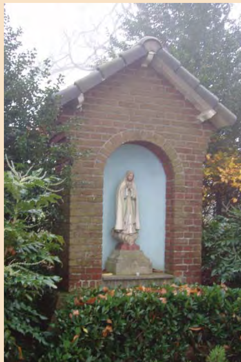
Het kapelletje bij de Mortelshof

Het Linnerveld bestond uit arme heidegronden. Spielman wilde deze gronden bemesten. Met het afval van de brouwerij werd het vee gevoerd. Met de mest hiervan wilde hij de grond verrijken. Daarom had hij grond gekocht en daarop een boerderij gebouwd.