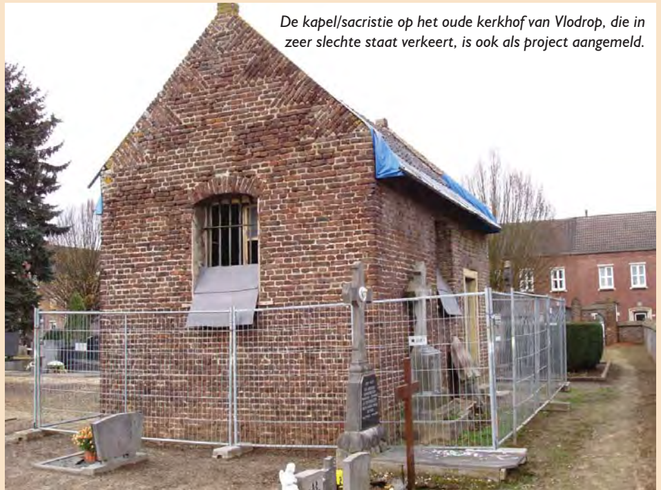
De kapel/sacristie op het oude kerkhof van Vlodrop, die in zeer slechte staat verkeert, is ook als project aangemeld.

Het Interreg IV-project is op 10 november jl. in Scherpenheuvel met een officiële bijeenkomst van de projectpartners van start gegaan. Bij die gelegenheid is de website van het project in werking gesteld ( www.chapelcross.eu ).