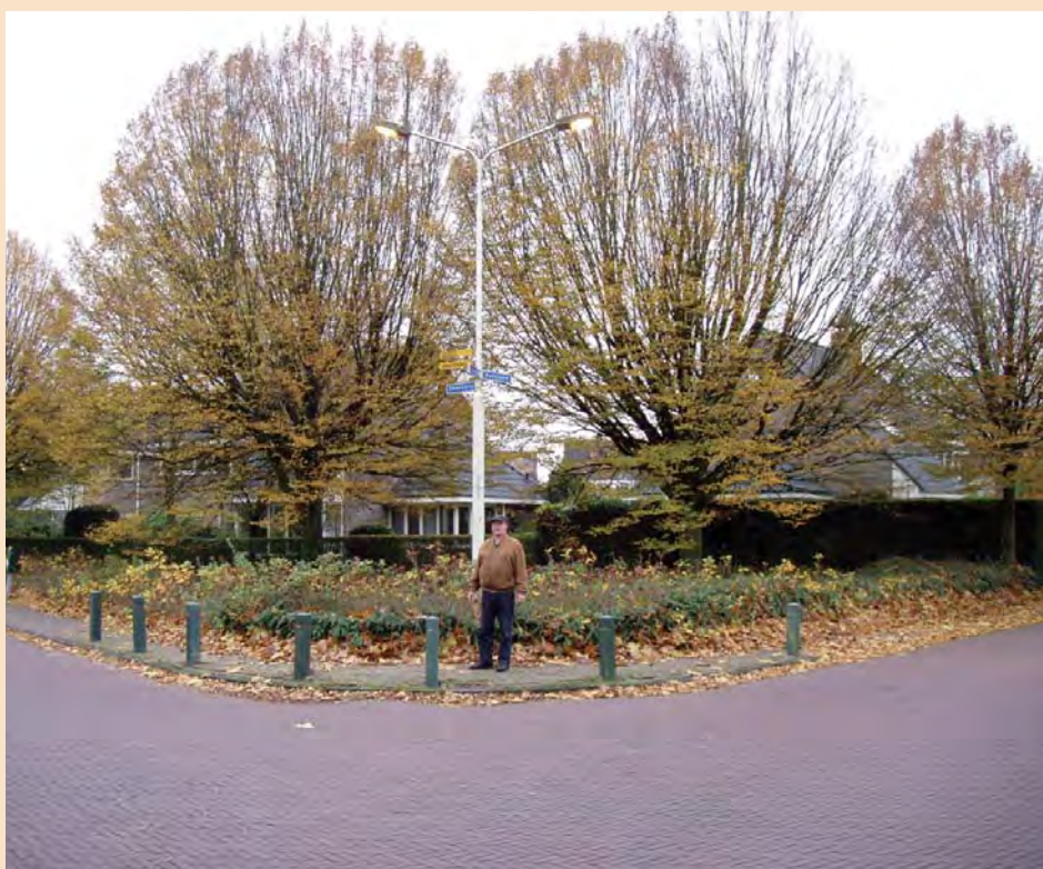
Herman Kroes bij het plantsoen, waar de kapel zal worden gebouwd.