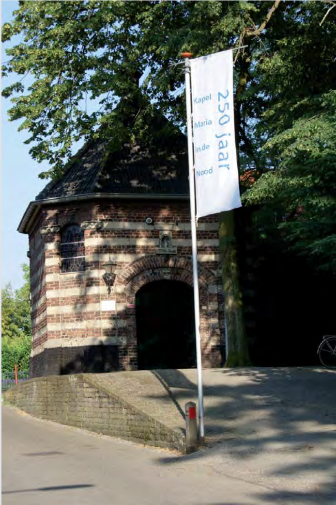
De kapel Maria in de Nood aan de Kapelbergweg

In 2010 stonden in Stein veel kerkelijke activiteiten op het programma. Het is namelijk dit jaar precies 250 jaar geleden, dat de kapel Maria in de Nood als Mariakapel in gebruik werd genomen en dat was voor het kerkbestuur van de Parochie St. Martinus samen met talrijke vrijwilligers en verenigingen aanleiding om hier nadrukkelijk op in te zoomen.