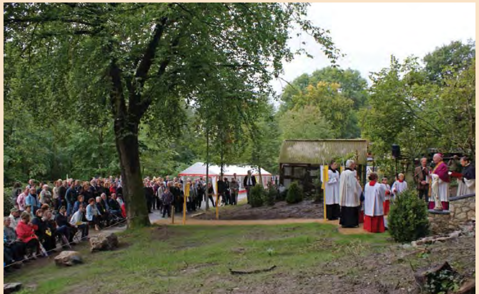
Een grote menigte was toegestroomd