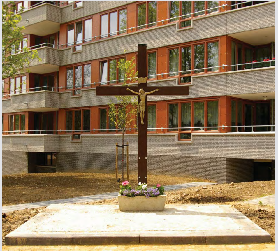
Het wijkkruis in de beschutting van de flats