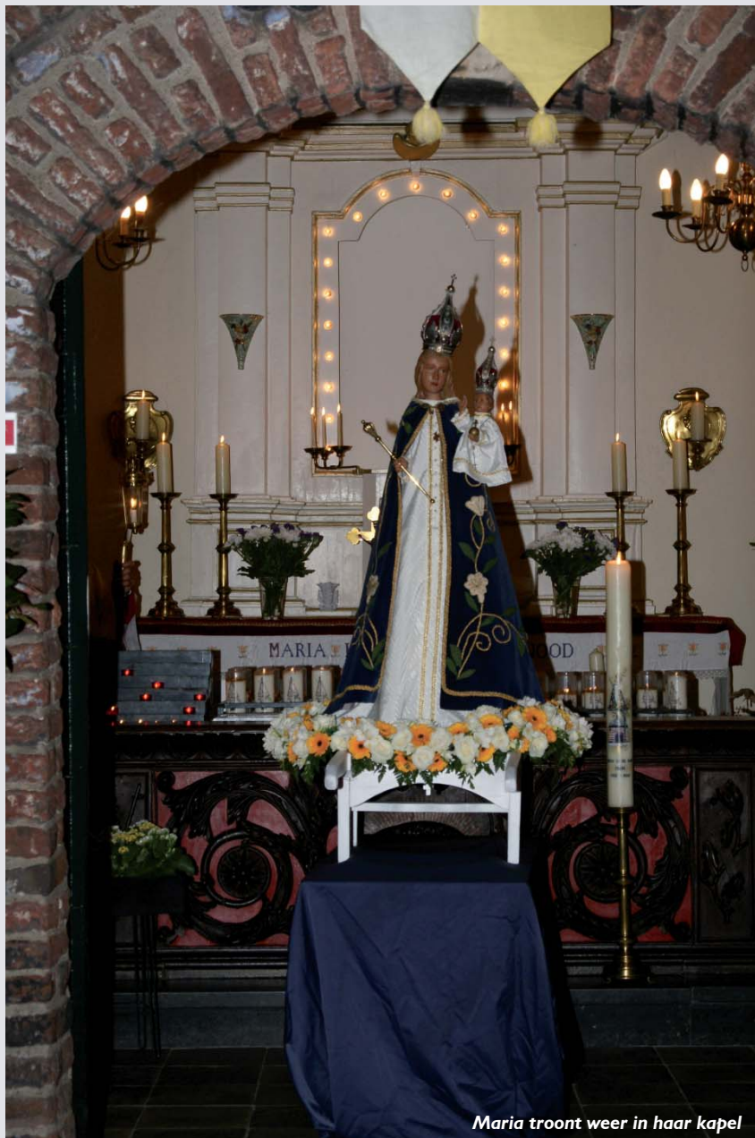
Maria troont weer in haar kapel

Het hoogtepunt echter was zonder meer de druk bezochte lichtprocessie die op vrijdagavond 8 oktober door de straten van Stein trok. De leden van de Steinder Garde droegen in een lange stoet van de vele aanwezigen - elk met een brandende kaars - het gerestaureerde Mariabeeld van de Martinuskerk, waar het begin oktober had gestaan terug naar de kapel. Onderweg klonken liederen en gebeden door de luidsprekers die langs de route waren opgehangen. Het Mariabeeld werd uiteindelijk ter afsluiting van de activiteiten teruggeplaatst in de kapel, waarbij nog diverse Marialiederen gezongen werden.