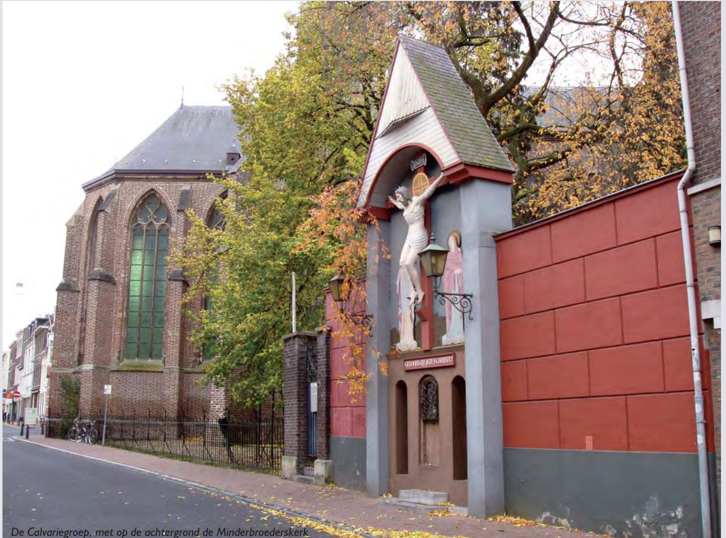
De Calvariegroep, met op de achtergrond de Minderbroederskerk

De Stichting Rura, die de onderhoudsplicht heeft van het kruis aan de Minderbroedersstraat, bereidt momenteel een noodzakelijke restauratie van dit bij iedere Roermondenaar bekende monumentale historische kruis voor.