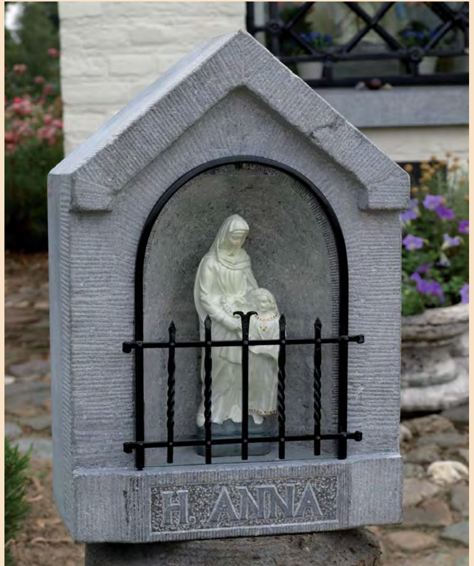
De fraaie, hardstenen muurnis

Zou het wellicht de uitermate kerk- en clerusvijandige periode van de Fransen (eind 18 e eeuw) niet overleefd hebben?