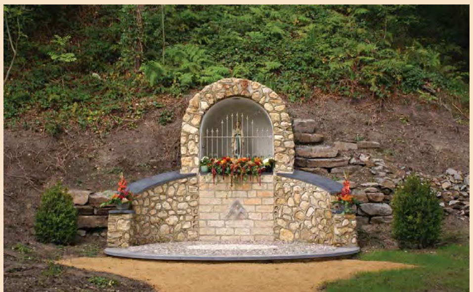
De kapel weer in volle glorie