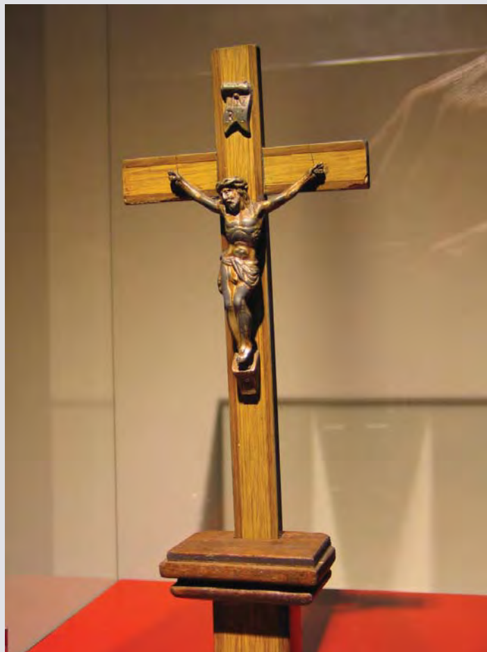
Het kruis van de familie de Groot