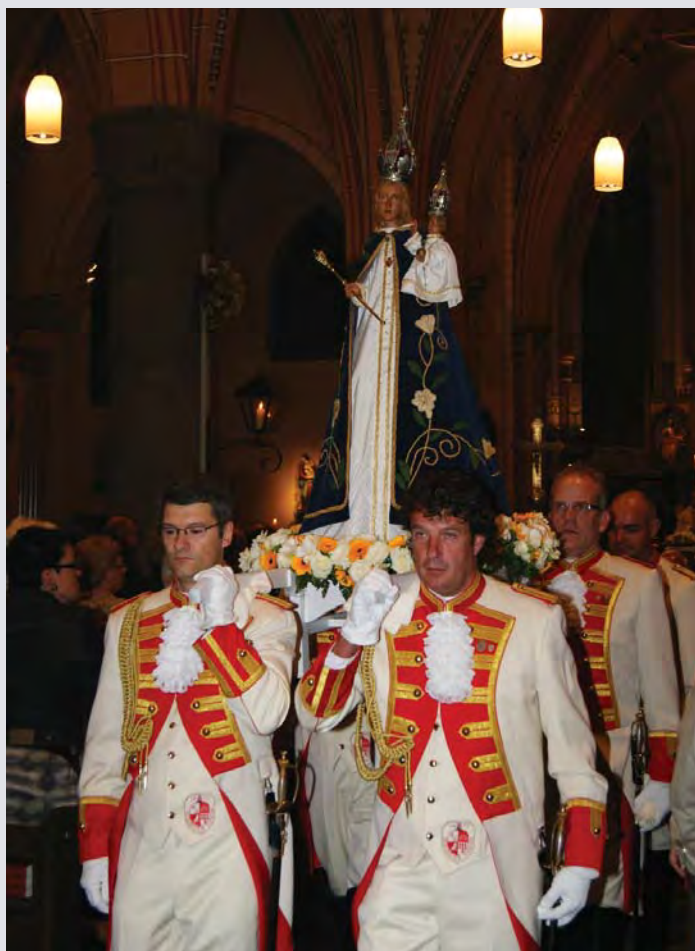
De leden van de Steinder Garde dragen het gerestaureerde Mariabeeld van de Martinuskerk terug naar de kapel.