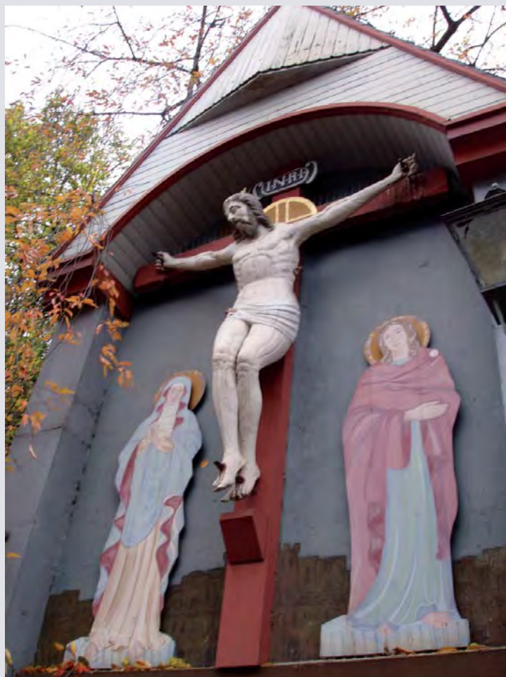
Het Christusbeeld geflankeerd door Maria en Johannes