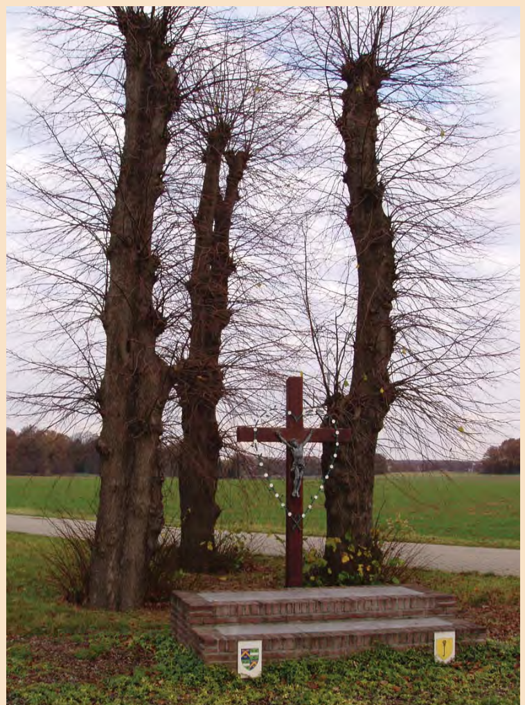
Dit kruis aan de Heinsbergerweg in Roermond is omgeven door drie lindebomen, die aan een snoeibeurt toe zijn. Het snoeiwerk is inmiddels in de lijst van aangemelde projecten opgenomen.