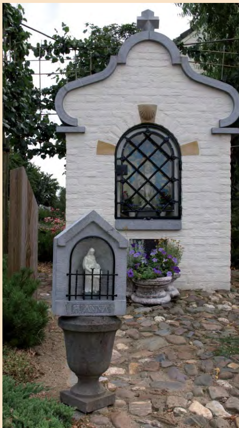
Anna maakt kennis met Jacobus

In de nis van het Jacobuskapelletje ook nog een beeld van Sint Anna plaatsen of alleen maar een plaquette met een beknopte weergave van bovenstaand verhaal en dat het ons speet dat ..? Misschien een kopie van het verwoeste Annakapelletje? Dat zou wellicht heel aardig geweest zijn, ware het niet dat er- hoe jammer! - geen enkele afbeelding van bekend is!