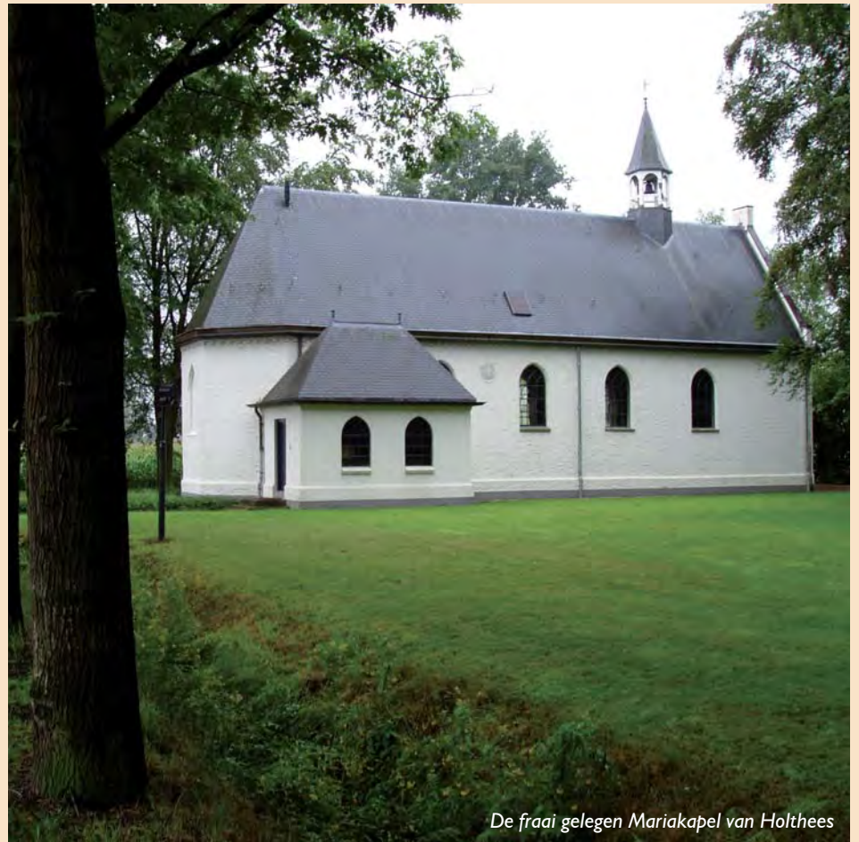
De fraai gelegen Mariakapel van Holthees

Holthees is zo'n randgeval, een liefelijk Brabants dorp met 425 inwoners. Vlakbij Holthees, maar dan in Limburg ligt het dorpje Smakt, waar 225 mensen wonen. Beide dorpen vormen één dorpsgemeenschap met één parochie en één school. Maar elk van beide dorpen valt onder een andere gemeente en elk onder een andere provincie: Holthees valt onder de Limburgse Gemeente Venray, Smakt ligt in Noord-Brabant en valt onder de Gemeente Boxmeer. Wat beide dorpen ook gemeen hebben: ze liggen vlak langs de spoorlijn Venlo-Nijmegen, waarover elk half uur een trein voorbijraast. Zonder te stoppen, dat weer wel.