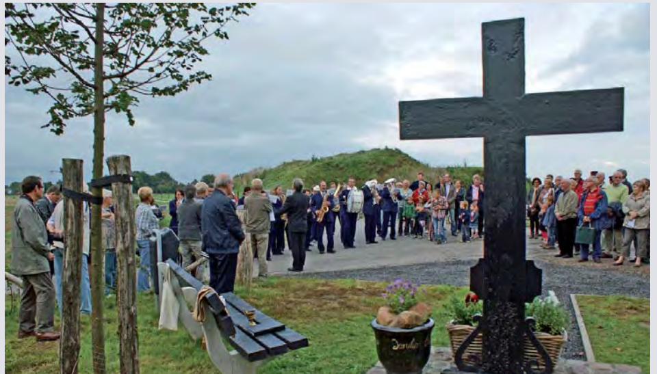
Veel volk was op de inzegening afgekomen

De ondergaande zon tovert prachtige lichten en het uitzicht over de velden is adembenemend. En dan komt in de verte fanfare Sint Antonius Schimmert aangemarcheerd. Het zeer toepasselijk gespeelde Jubilissimo maakt dat hun komst een voorbode is van een bijzondere bijeenkomst.