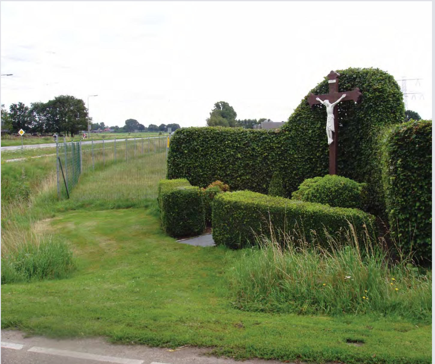
Het kruis langs de Middenpeelweg

Het geloof in de werking van O.L. Heer zullen zij ongetwijfeld hebben ondersteund met een flinke dosis kunstmest. Het resultaat was er naar, want de gehoopte opbrengst werd ruimschoots gehaald en dus kwam er uit dankbaarheid een kruis.