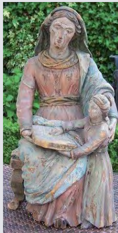
Het origineel beeldje van de Heilige Anna (Annakapel)