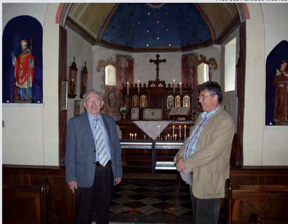
Het eeuwenoude interieur