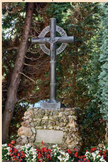
Het oorlogskruis te Crapoel

Aan de voet van het kruis staat op een groen uitgeslagen koperen plaat in hoofdletters de volgende tekst : AAN DIT KRUIS VAN BRONGRANATEN / HANGT DE GODMENS STIL VERLATEN / WILT TOCH ZONDAARS TOT MIJ KOMEN / LAAT UW TRANEN RIJKELIJK STROMEN / HIJ ZAL ONS GENADE GEVEN / EN DAARNA HET EEUWIG LEVEN.