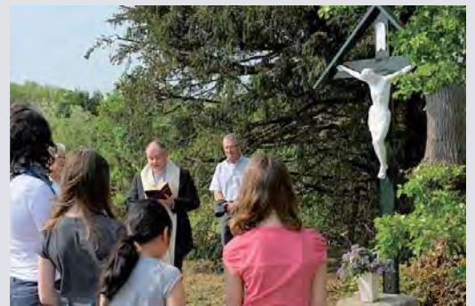
De inzegening van het nieuwe Corpus

We zijn erg blij en trots dat we dit project tot een goed einde hebben kunnen brengen. Het plan is nog om er bordjes met een korte uitleg bij te plaatsen. En dan hopen we maar dat deze, voor ons dorp, historische objecten voor lange tijd behouden zullen blijven.