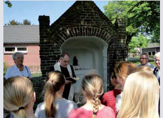
De inzegening van de Annakapel

Het was behoorlijk verwaarloosd en stond vrijwel onzichtbaar tussen de struiken. We hebben het mooi opgeknapt en geschilderd. In Venray hebben ze voor ons ook een nieuw, vandalisme bestendig corpus gegoten. Het kruis werd ingezegend op Goede Vrijdag 2011.