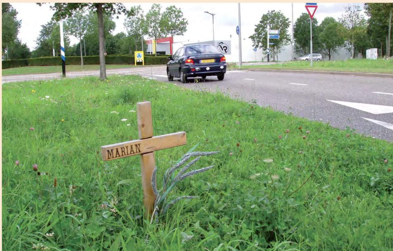
Een bermmonument aan de Beerdalseweg in Heerlen

De vergunning regelt ook de maximale afmetingen van het monument (in straten 30 x 30 x 10 cm; in bermen 50 x 50 x 50 cm). En verder mag het gedenkteken maximaal drie jaar blijven staan. Dan haalt de gemeente het weg. Wel op kosten van de nabestaanden.