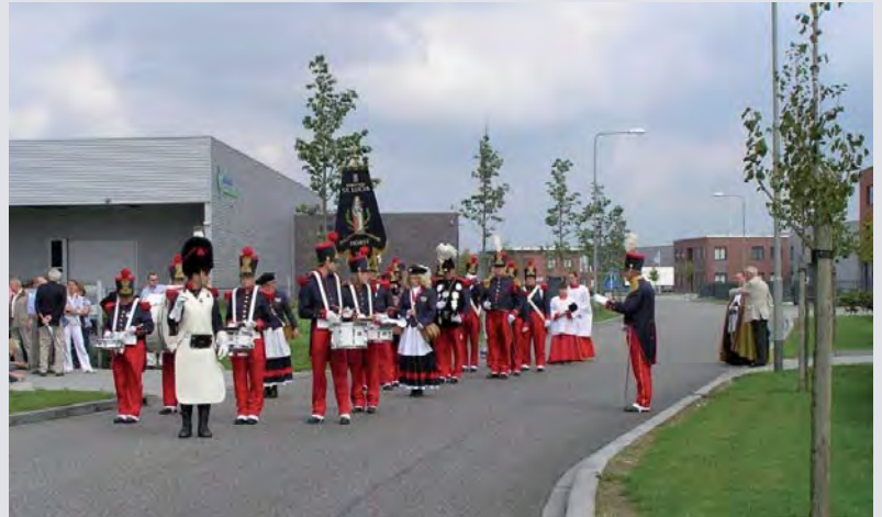
In processie naar de St. Annakapel met voorop schutterij St. Lucia. Deze schutterij heeft overigens haar eigen kapel in Meterik.