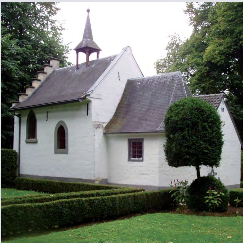
De witte kapel in het groen

De graaf laat de jachthut uitbreiden en verbouwen. Er komt een kapel en enkele eenvoudige kamertjes en een kelder.