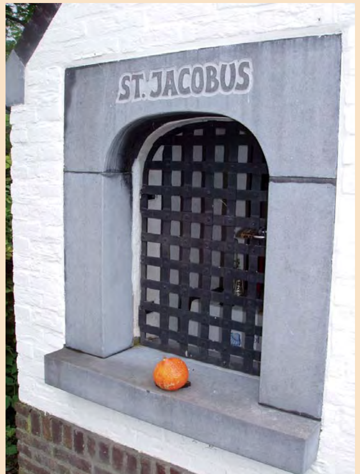
Het sierfruit bij de Jacobuskapel