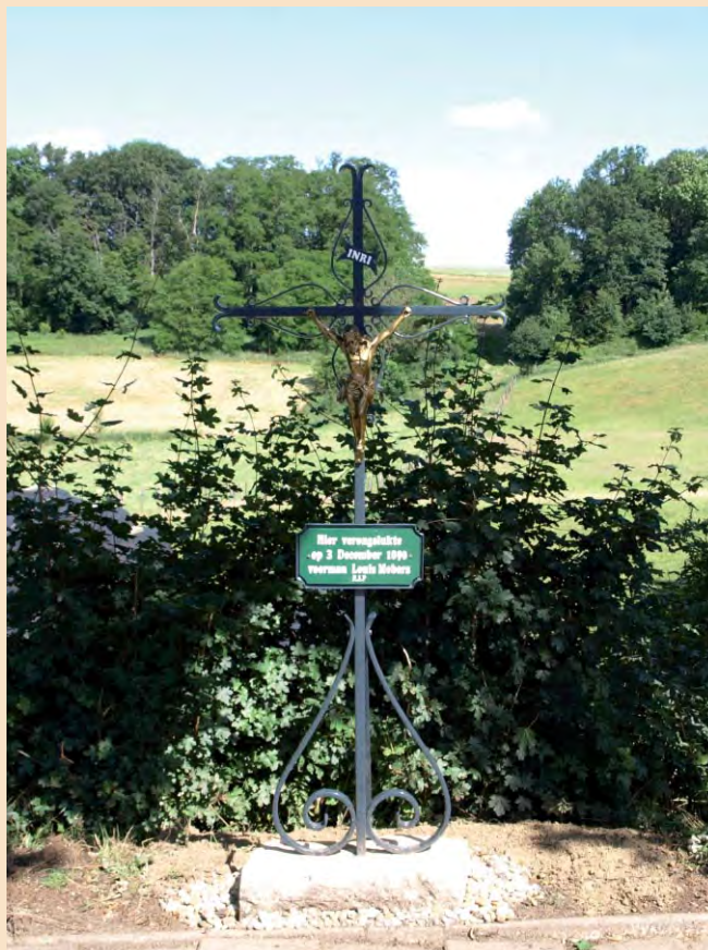
De nieuwe situatie