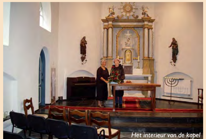
Het interieur van de kapel

Het teruglopend kerkbezoek in de tweede helft van de vorige eeuw treft ook Holthees. In 1995 wordt in de kapel de laatste zondagse kerkdienst gehouden, waarna het Bisdom 's-Hertogenbosch in 1998 besluit om de kapel aan de eredienst te onttrekken. Een jaar later draagt het Kerkbestuur de kapel over aan de inmiddels opgerichte Stichting Mariakapel Holthees . Deze overdracht vindt plaats onder enkele beperkende voorwaarden.