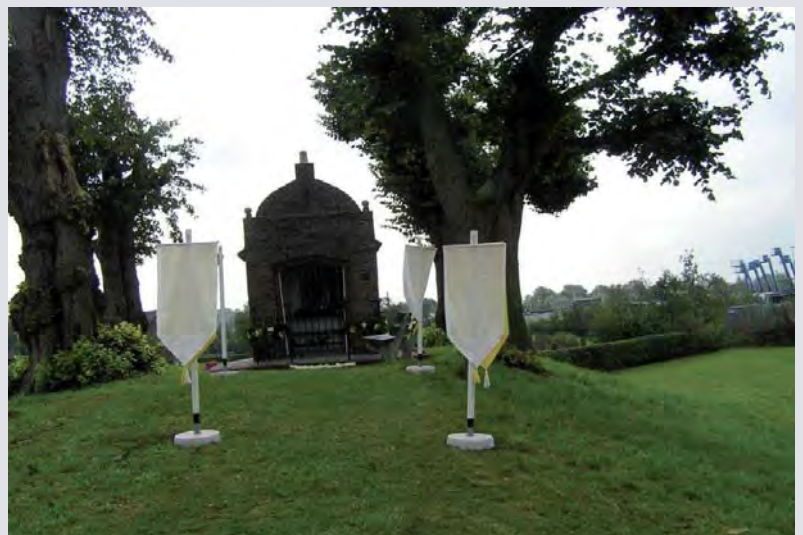
De opgeknapte kapel