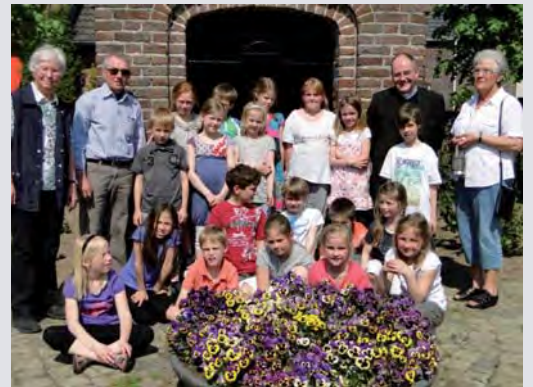
De communicantjes voor de Mariakapel