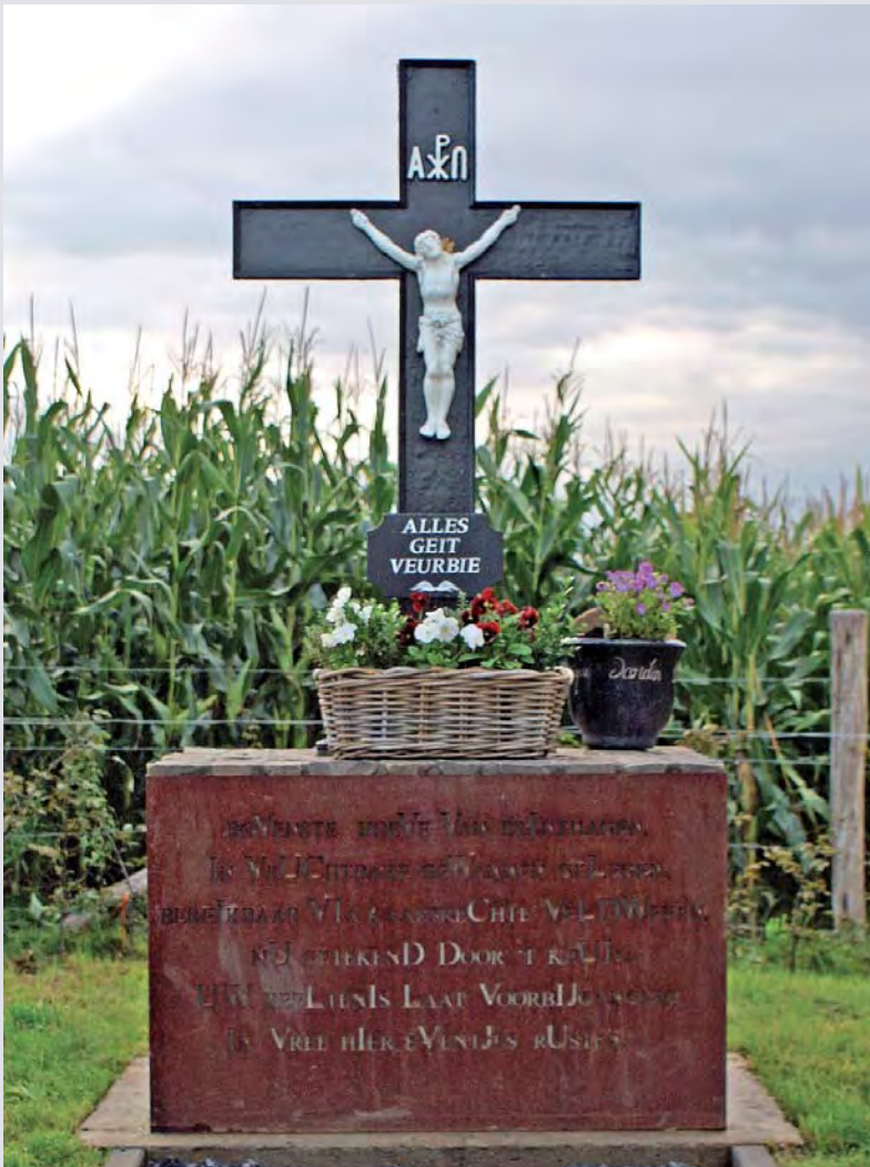
Het kruis op de viersprong

Voor de fanfare het sein om met de Marche Professionnelle het feestelijk karakter van de bijeenkomst nog eens te benadrukken. Dan krijgen we nog een uitleg over waar het kruis vandaan komt en vanwaar het corpus en worden we ingewijd in de geheim van de tekst op de sokkel: die bevat namelijk een chronogram. Uiteraard komen de opgetelde getallen uit op 2011.