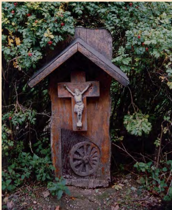
Het oude, inmiddels verwijderde kruis