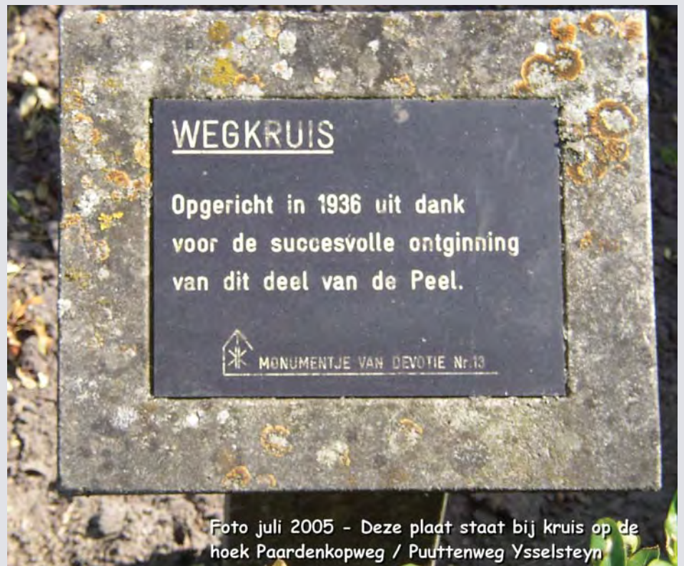
Foto juli 2005 - Deze plaat staat bij kruis op de hoek Paardenkopweg / Puuttenweg Ysselsteyn

Of hier toen sprake was van enige chantage in de richting van Onze Lieve Heer laat ik maar buiten beschouwing!