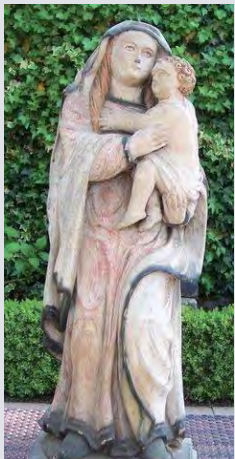
Het origineel beeldje van Maria met Kind Jezus (Mariakapel)

Wij, van de stichting Heemkunde Arcen, vonden dit maar niks. Daar moest wat aan gedaan worden.