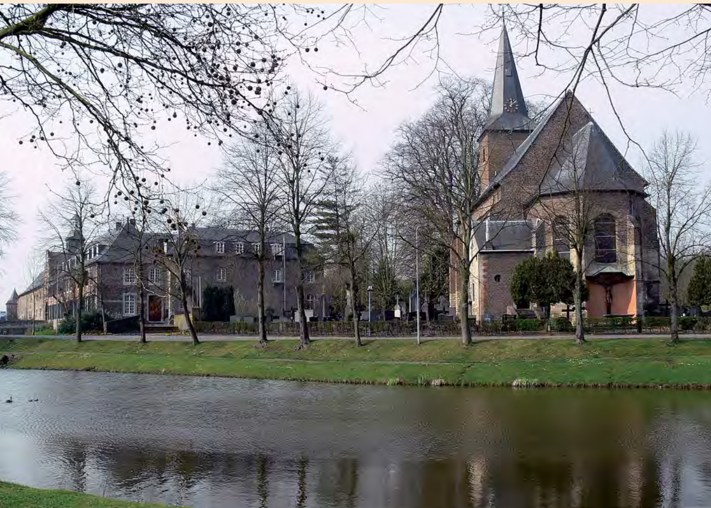
Kasteel en Stephanuskerk in Wijnandsrade, waar de Contactdag zich zal afspelen