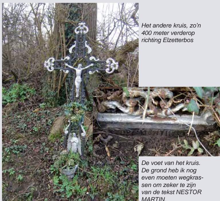
Het andere kruis, zo'n 400 meter verderop richting Elzetterbos