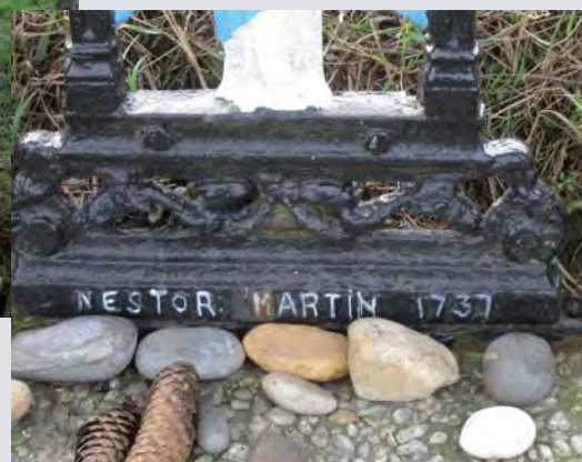
De voet van het kruis