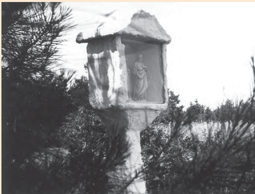
Zevesprungkapelke omstreeks 1950

uitermate geschikt om de vele kudden schapen van de boeren uit Stramproy te laten grazen. Binnenkort wordt het gehele gebied één groot grensoverschrijdend natuurgebied met daarin onder andere oerossen en edelherten.