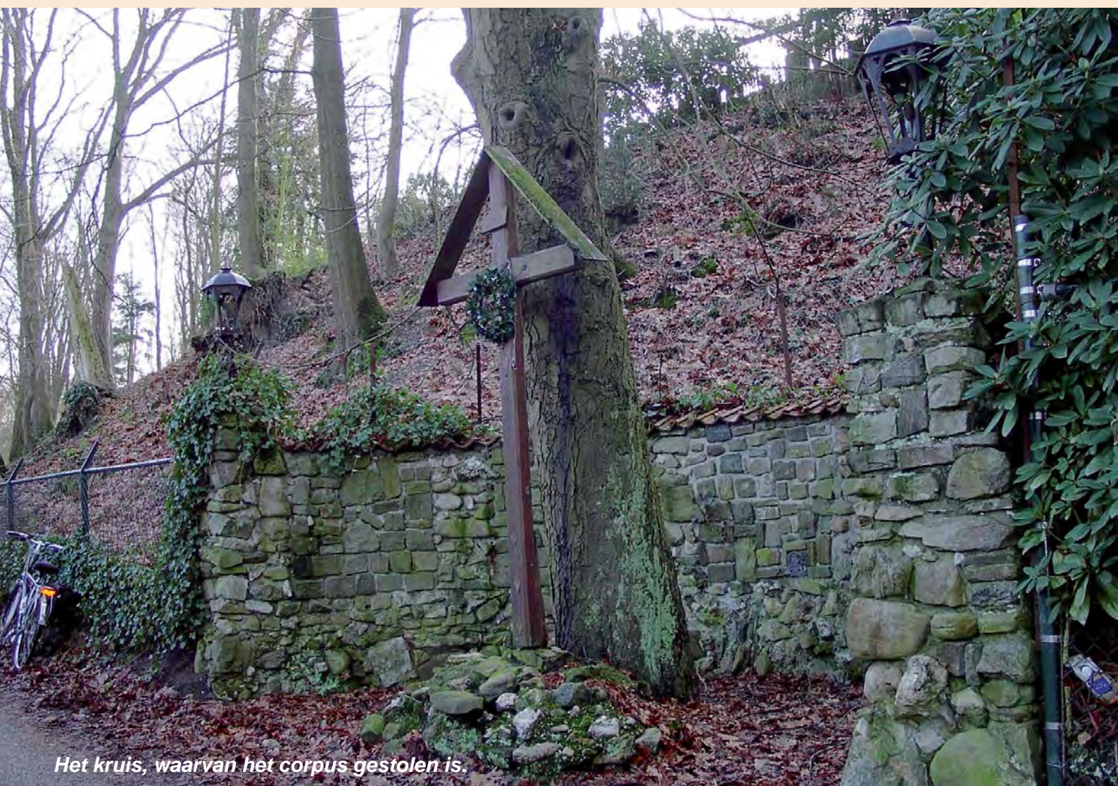
Het kruis, waarvan het corpus gestolen is.