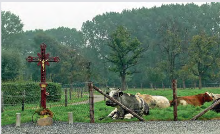
Het Weg/Memoriekruis van Laar