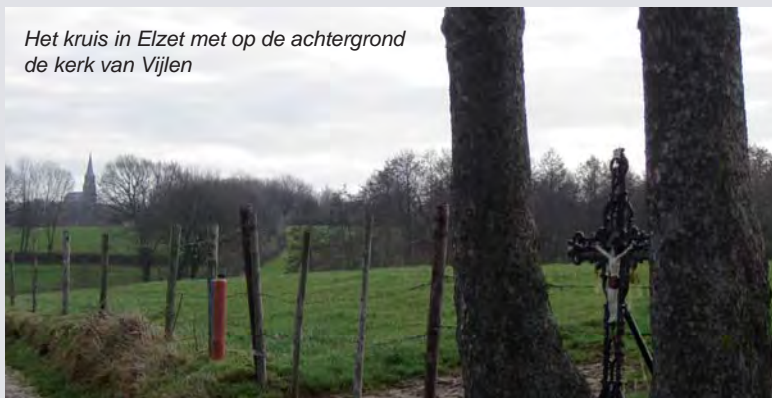
Het kruis in Elzet met op de achtergrond de kerk van Vijlen