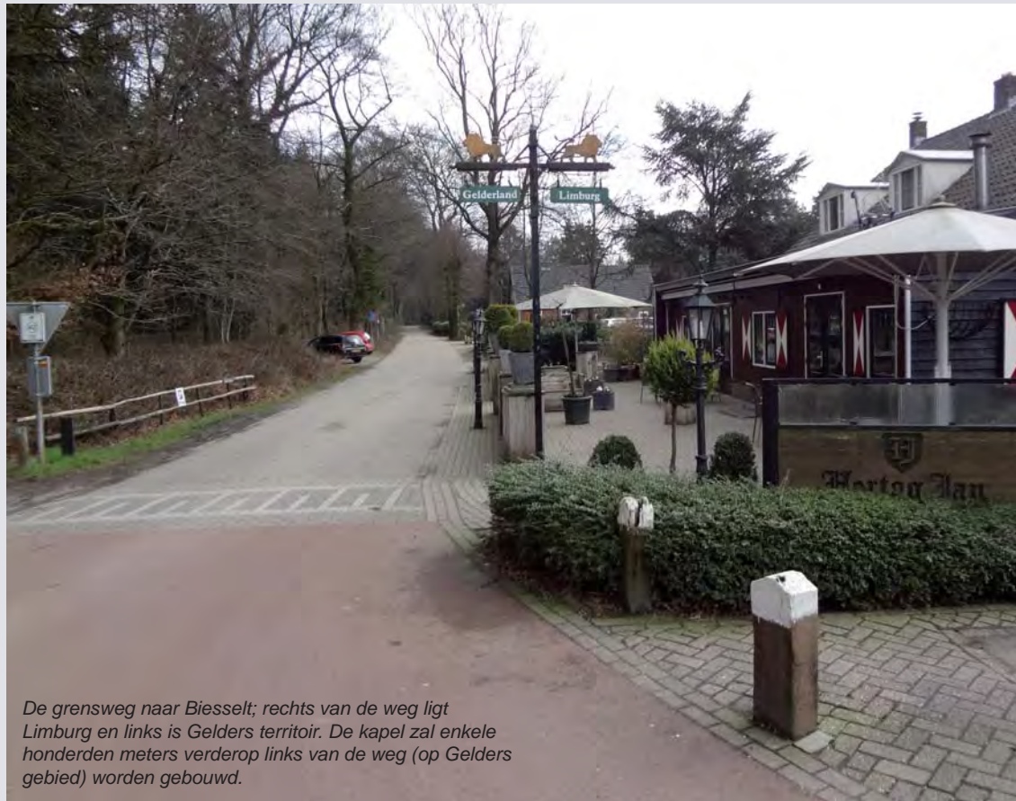
De grensweg naar Biesselt; rechts van de weg ligt Limburg en links is Gelders territoir. De kapel zal enkele honderden meters verderop links van de weg (op Gelders gebied) worden gebouwd.

Verder hebben zij contact gehad met de grondeigenaar, Staatsbosbeheer, waarbij gezien moet worden, of men de ondergrond van de kapel kan verwerven, dan wel, dat er met een recht van opstal gewerkt gaat worden.