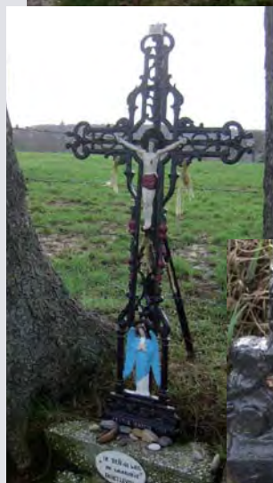
Hetzelfde kruis van dichtbij