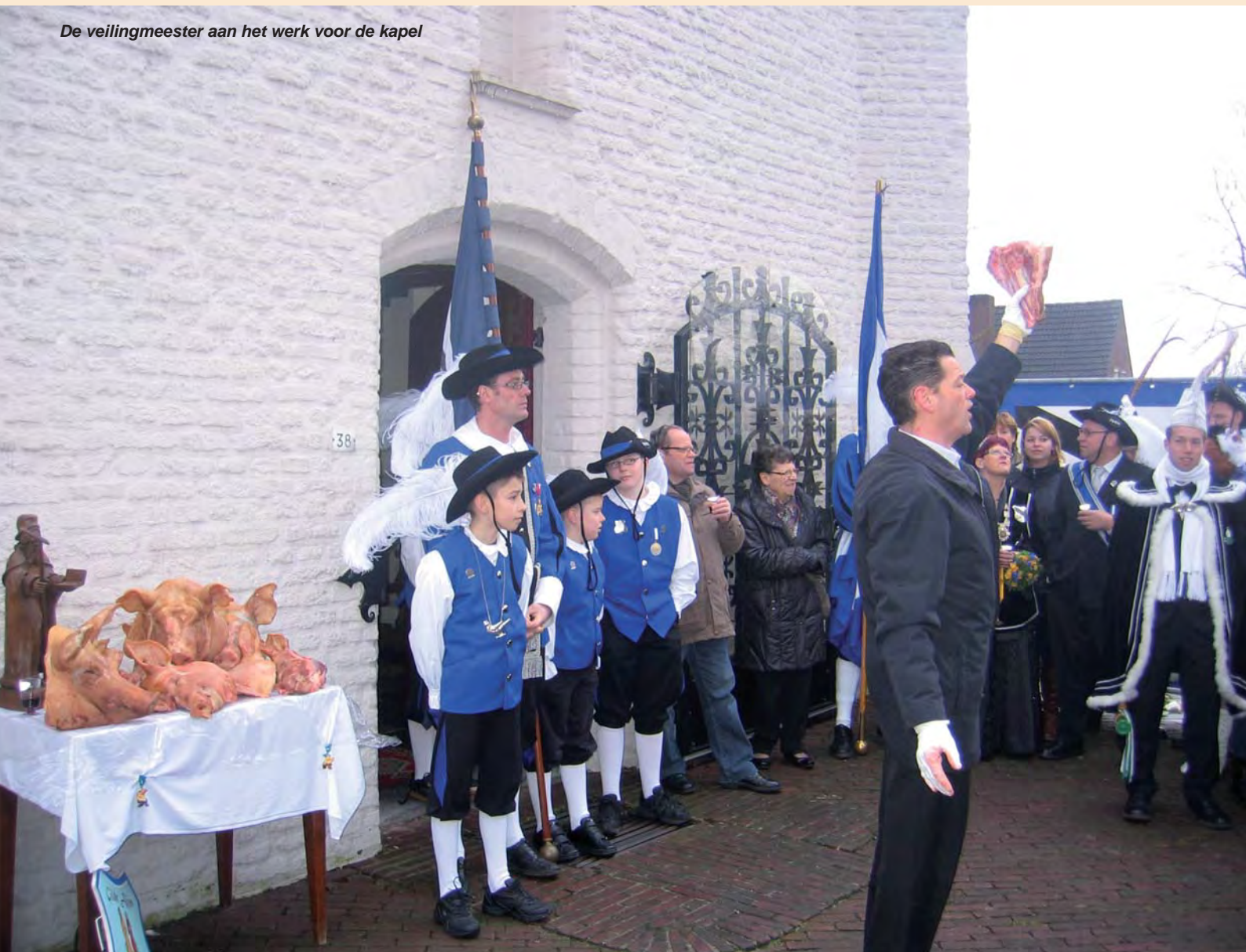
De veilingmeester aan het werk voor de kapel

Sint-Antoniusabt, de oermonnik uit de Egyptische woestijn rond 300, wordt vaak afgebeeld met een varken aan zijn voeten. Daaraan wordt de heilige meer herkend dan aan zijn andere attribuut: de tau-staf. Het varken is in de late middeleeuwen bij de heilige gevoegd en verwijst naar het gebruik om in steden en dorpen een of meer varkens te laten rondlopen, die op kosten van de gemeenschap werden gevoerd of beter gezegd leefden van het afval. Als de dieren vet genoeg waren, werden ze geslacht. De opbrengst ging naar een hospitaal van