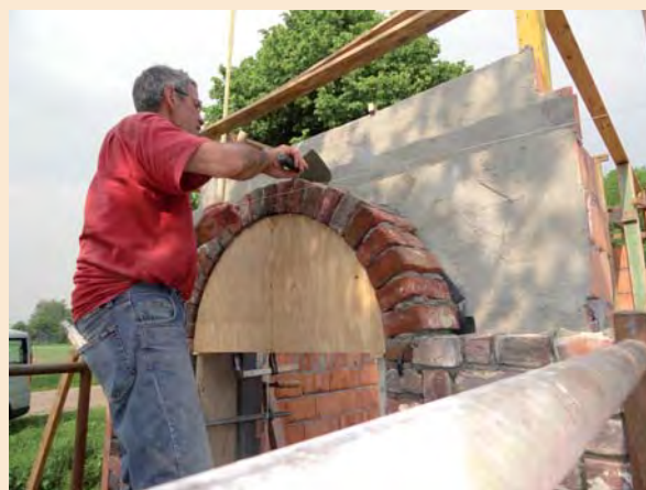
Een formeel dient als tijdelijke ondersteuning bij het metselen van de boog

De koffie wordt spontaan aangedragen en weer andere maken borduurwerk dat straks de kapel zal opsieren. Een aantal dames zal straks het schilderwerk binnen onder handen nemen, er dienen randversieringen te komen op de muren en sterren in het gewelf.