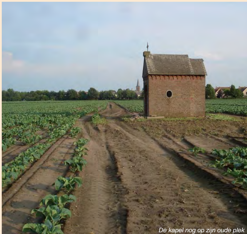
De kapel nog op zijn oude plek

Het verval van het gebouwtje ging toeslaan en gelukkig kwam er toen een idee .... het verplaatsen van dit gebouwtje.