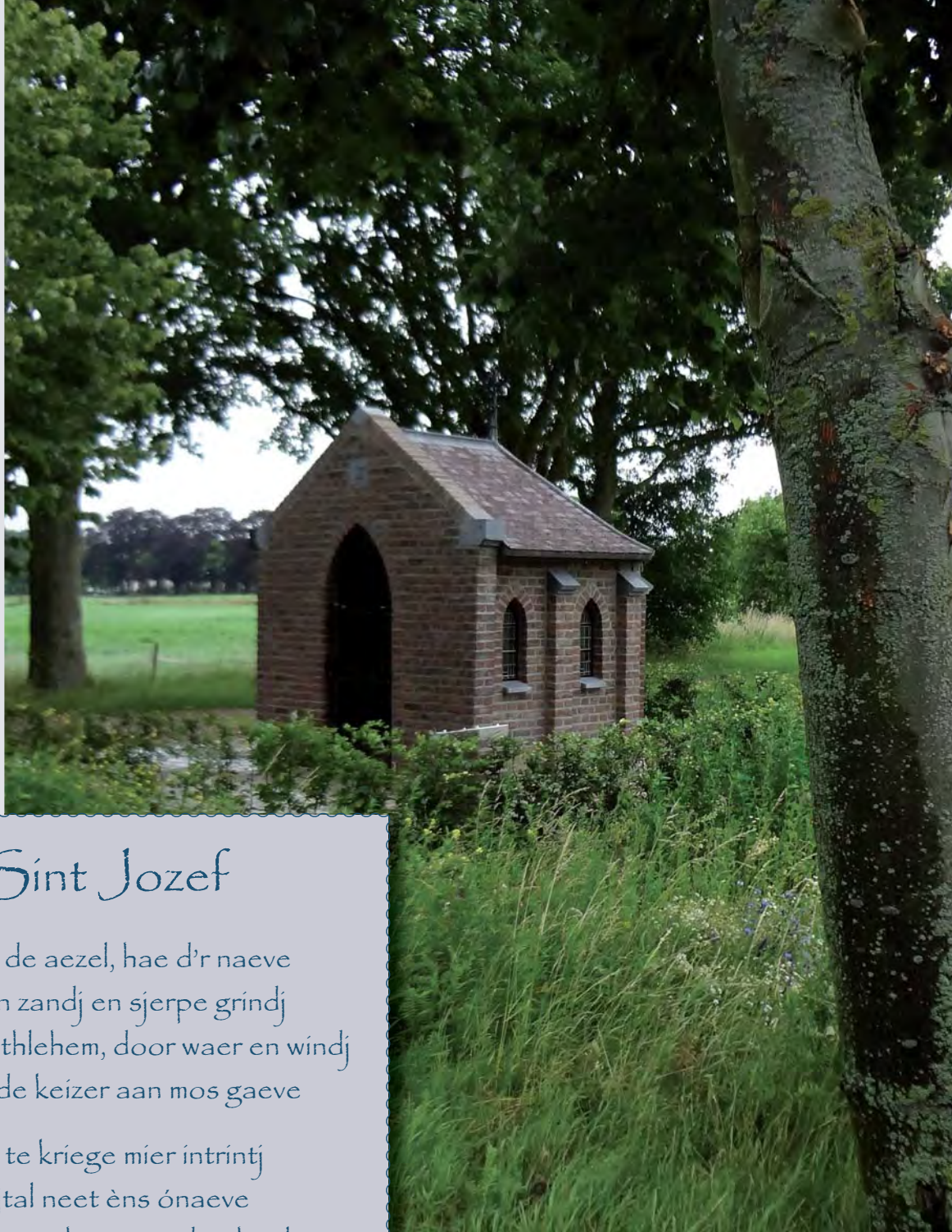
De Jozefkapel aan de Kerkstraat in Nunhem