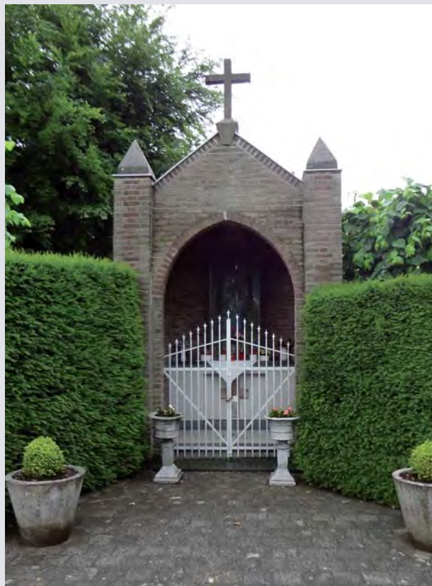
De kapel van OL Vrouw van het H. Hart in Aalbeek

Inmiddels zijn verschillende kapellen en kruisen onder handen genomen.