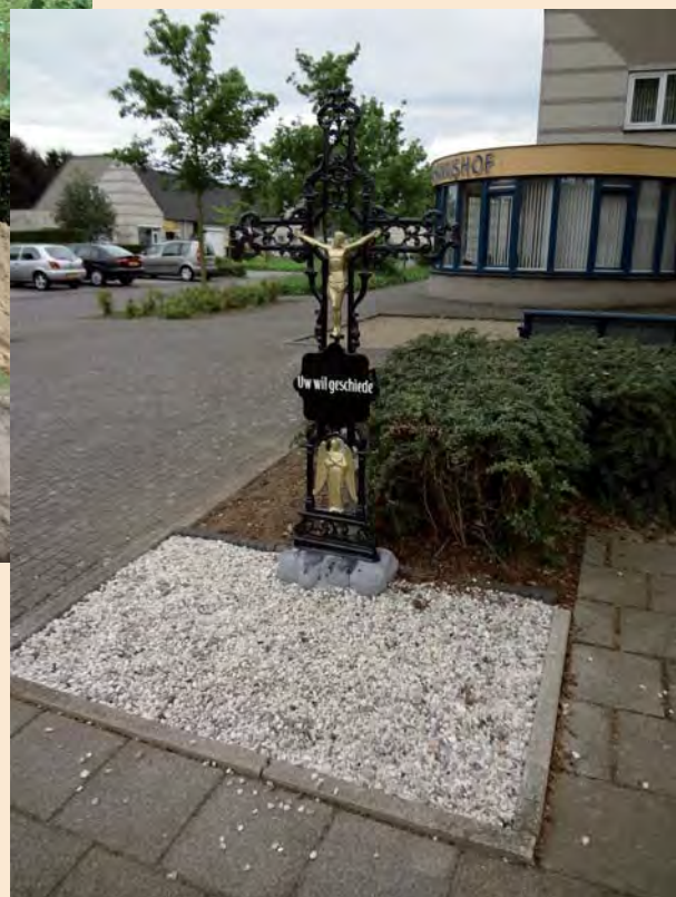
Het kruis met de tekst "Uw wil geschiede" bij de Stefanushof