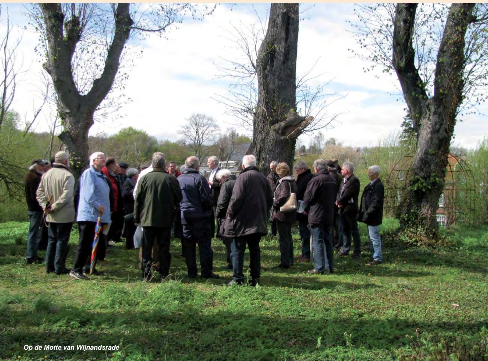
Op de Motte van Wijnandsrade