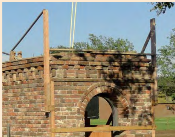
De kapel nadert zijn voltooiing

Dat we in 2012 leven zal straks te zien zijn, dit zal de eerste kapel zijn waar zonne-energie zorgt voor verlichting. Ook dit was een spontaan idee van een van de bewoners die daar dan ook de zorg voor draagt. Stichting Kruisen en Kapellen heeft ook een subsidie bij de EU weten te verkrijgen. De Stichting Kruisen en Kapellen afdeling Maasbree, die op een intensieve manier meewerkt om van dit project iets moois te maken, prijst zich zeer gelukkig, dat ze fijne mensen heeft leren kennen, uit een buurtschap, die vrijwillig heel wat uren besteden aan het eetherstel van deze kapel en onderling een goede samenwerking hebben gerealiseerd met als doel de kapel terug bij de mensen.