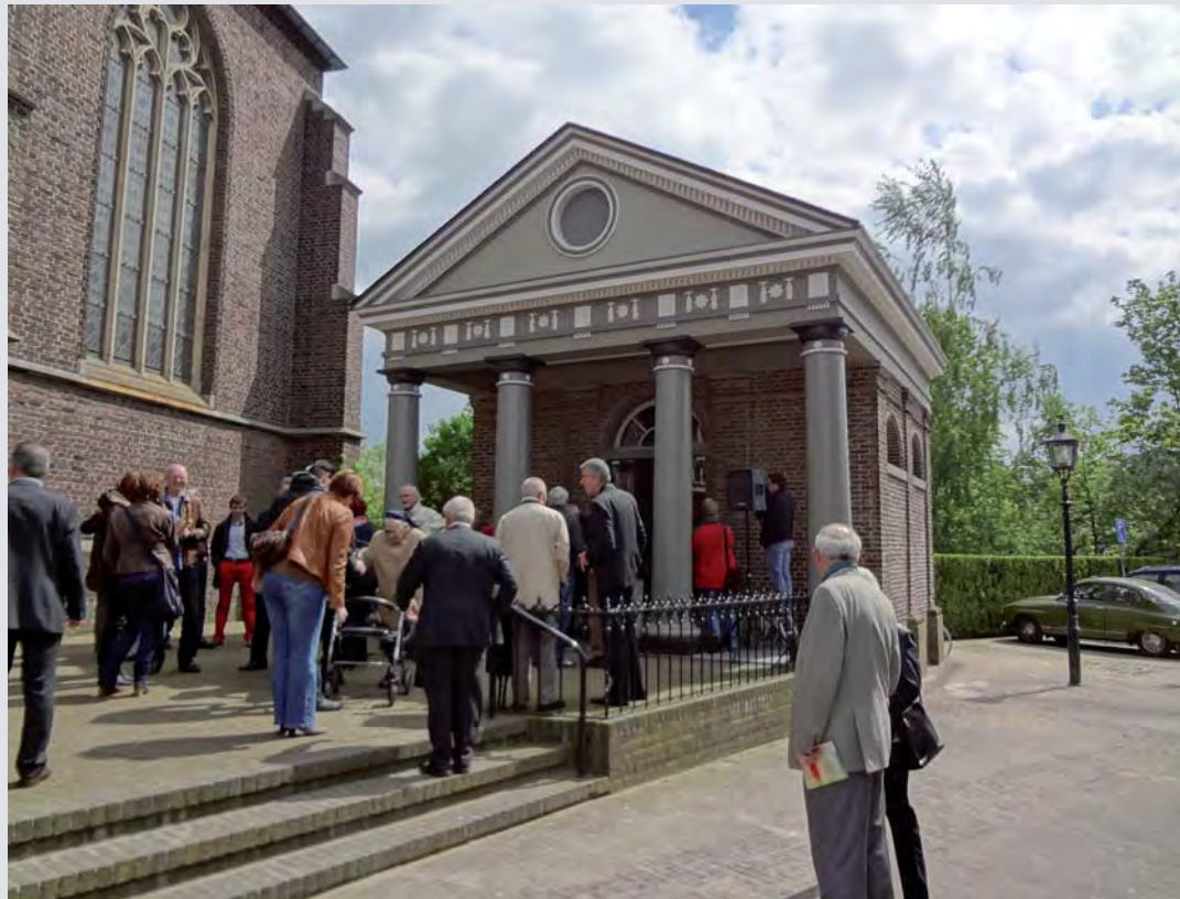
Na de ingebruikneming drommen de aanwezigen samen om het kunstwerk in de kapel te bekijken.