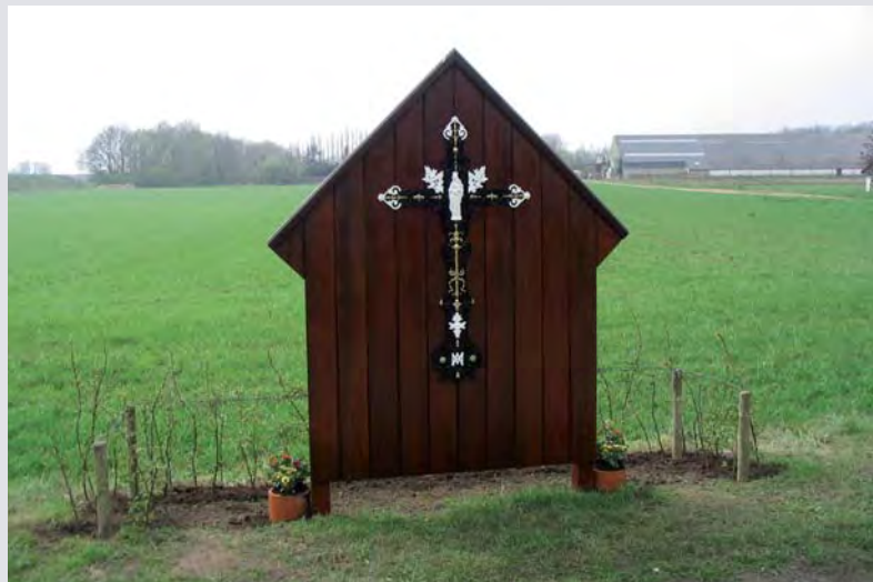
Het wegekruis met de madonna

Het model van deze wand werd in eigen beheer ontworpen en met deskundige hulp van Har Coopmans, op maat gemaakt en in elkaar gezet met RVS schroeven. Daarna werd het diverse malen met houtolie behandeld tegen verwerking.