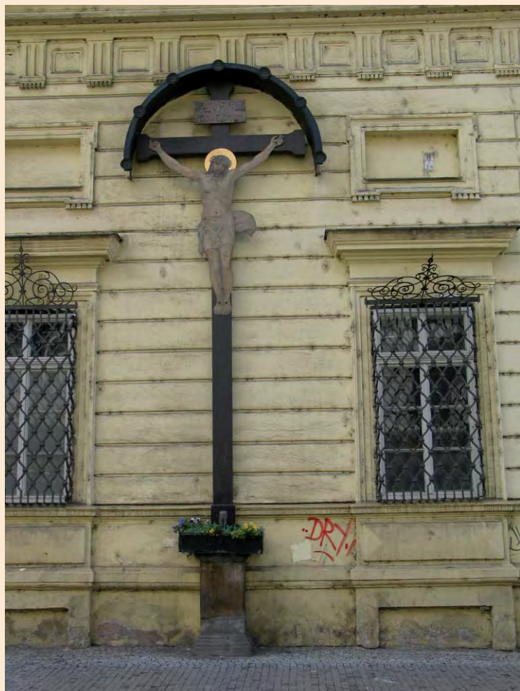
Het kruis aan Narodni nr. 8