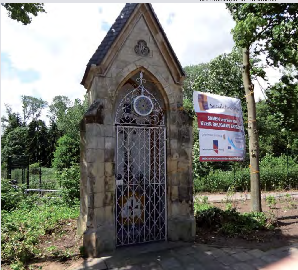
De Kruiskapel in Roermond

Een ander project is de kapel van OL Vrouw van het H. Hart in Aalbeek. Bij deze kapel uit 1952 was het voegwerk in de voorgevel losgeraakt. Het voegwerk is vanaf 2,5 m hoogte uitgekapt en vernieuwd. In de top zijn gelijktijdig enkele mortelrotte stenen vastgezet.