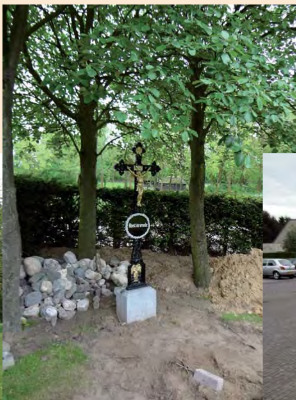
Het kruis bij de strooiplaats