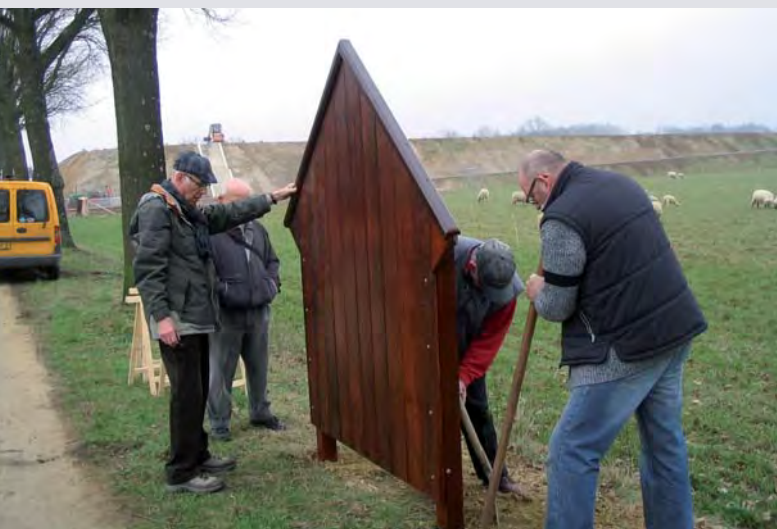
Plaatsing van de achterwand van het wegekruis aan de Oude Tolweg

Het kruis met de madonna staat sinds begin april van dit jaar tussen twee grote eikenbomen, in de berm van de Oude Tolweg in Belfeld. Dit is een sinds 1805 bestaande weg, die eerst Nieuwe Dijk en later Maalbekerweg werd genoemd en die van 1895 tot 1922 een tolweg is geweest.