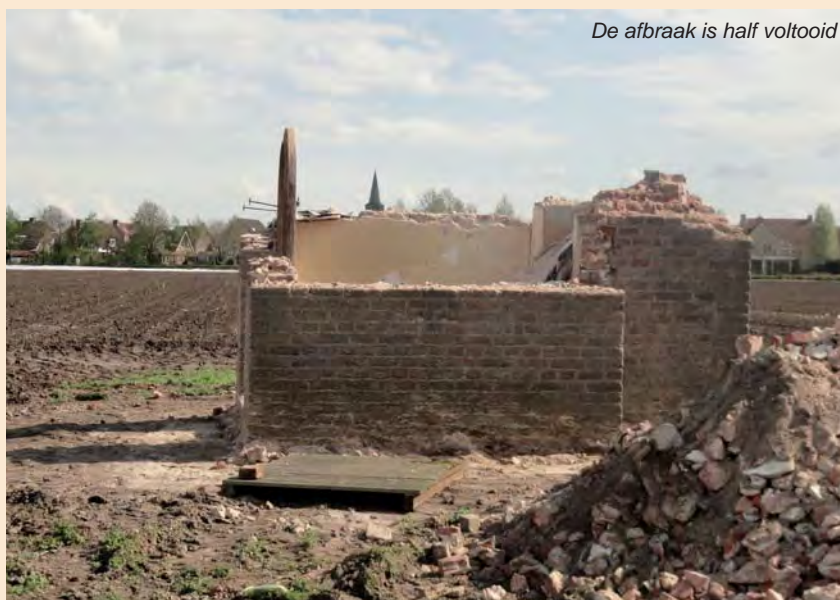
De afbraak is half voltooid

De Stichting Kruisen en Kapellen zorgde voor de nodige vergunningen en garantie op financieel gebied en de buurtbewoners gingen belangeloos aan de slag na voldoende informatie uitgewisseld te hebben over de gang van zaken. Steen voor steen werd de oude kapel gesloopt en zorgvuldig werden deze stenen schoon gemaakt en gerangschikt. De opzet was om de vele stenen op dezelfde plek terug te laten komen.