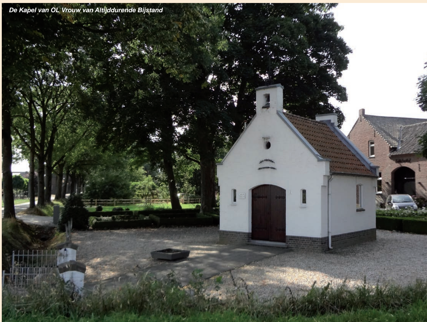
De Kapel van OL Vrouw van Altijddurende Bijstand