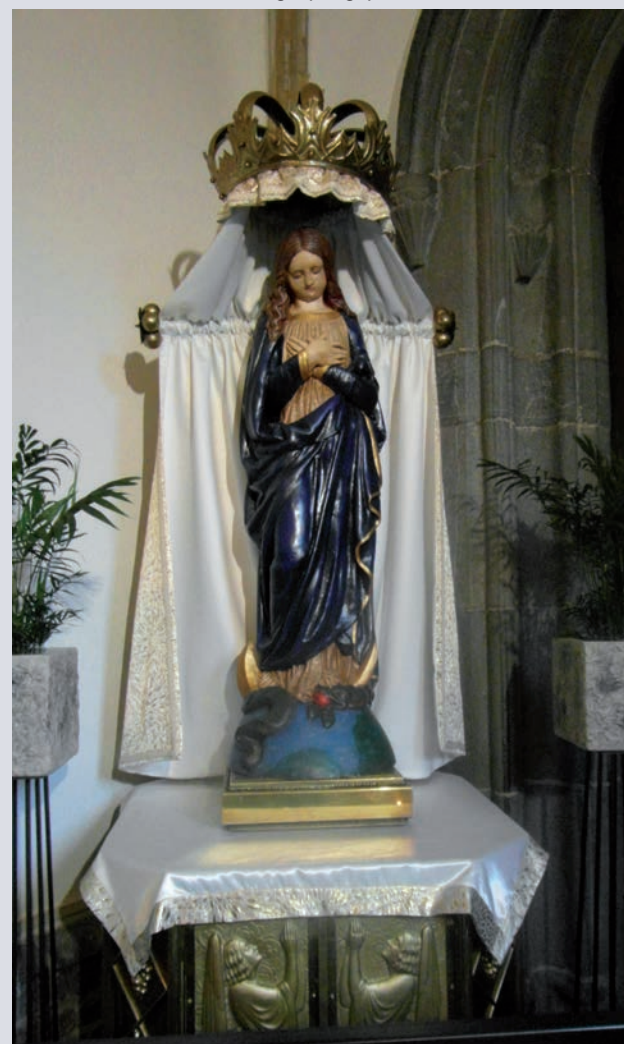
Het in de dagkapel geplaatste mariabeeld