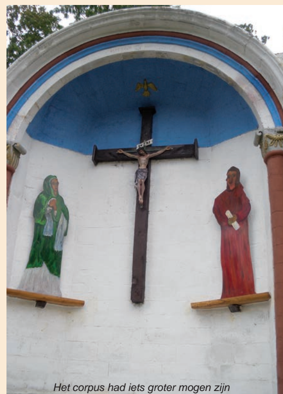
Het corpus had iets groter mogen zijn