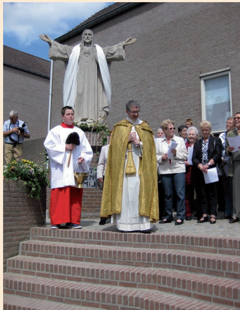
De inzegening door pastoor Achten op 23 juni 2012