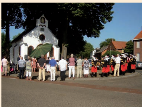
De Rochuskapel weer in volle glorie

Op zondag 19 augustus 2012 vond in het buurtschap Eiland in Stevensweert de herinzegening van de kapel toegewijd aan de H. Rochus plaats. Zo'n 120 belangstellenden waaronder de voltallige schutterscompagnie woonden de plechtigheid bij. Wanneer de eerste Rochuskapel werd gebouwd is niet meer te achterhalen maar na een overstroming van de Maas in 1850 werd besloten tot herbouw van het voormalige kapelletje. Op 16 juli 1866 werd het kapelletje ingewijd. In 1919 werd de kapel vanwege de toenemende aantallen bezoekers afgebroken en vervangen door de huidige kapel.