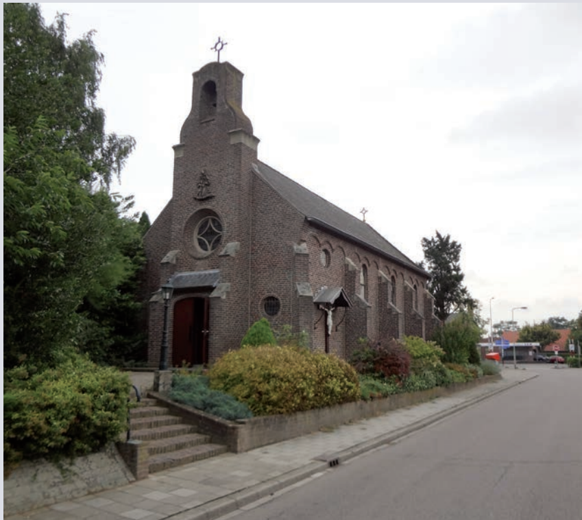
De Kapel van OL Vrouw van het H. Hart

De kapel is tot op de dag van vandaag in gebruik. 's Zondags is er om kwart voor negen een eucharistieviering, terwijl er voorts wordt gedoopt en huwelijken worden gesloten.