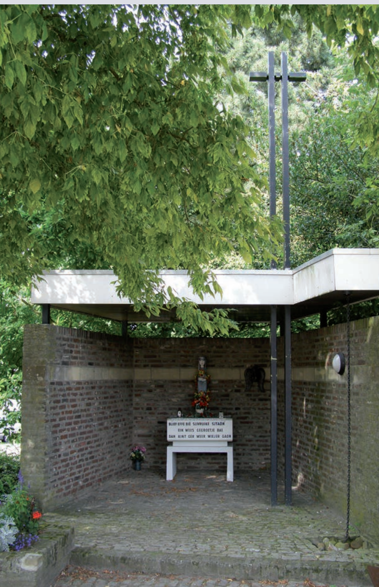
De Mariakapel in de huidige situatie

Een mooie aanleiding om contact op te nemen met de architect en een klein artikel te schrijven over deze kapel.