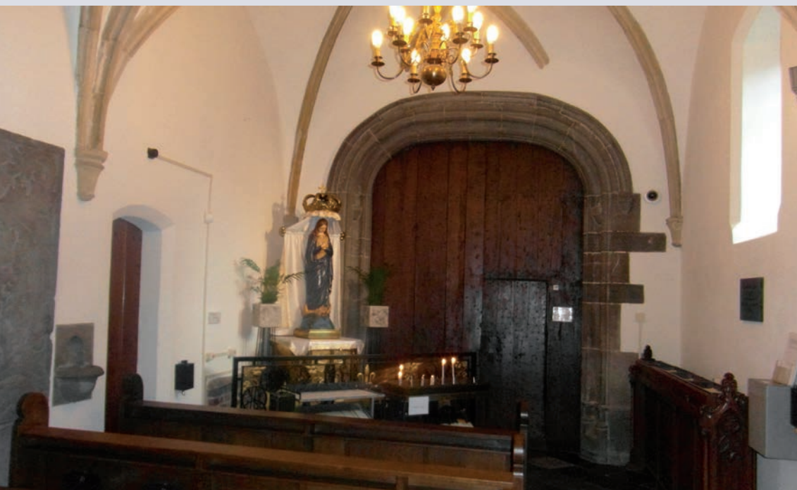
De Mariadagkapel in de Petrus'-Bandenkerk

Op Pinksterzondag werd in Venray een dagkapel ingezegend, die toegewijd is aan Maria.