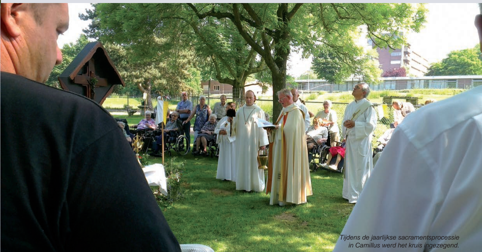
Tijdens de jaarlijkse sacramentsprocessie in Camillus werd het kruis ingezegend.

Daarom zijn wij nu blij met dit nieuwe kruis zomaar geschonken om hier troost te ervaren om teken van leven in God te zijn Sacrament van Mens voor de mensen en zegen van de Nieuwe Dag dat wij allemaal de Helper mogen ervaren geheiligd in Zijn Naam geloofd om zijn gaven van Liefde Adem die de ziel geneest waarin ons leven vrucht mag dragen vanaf de Oorsprong alle dagen.