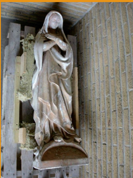
Het Mariabeeld, voordat het in vele stukken uiteen was gevallen.

De Zusters Benedictinessen van de Altijddurende Aanbidding van het Allerheiligst Sacrament van de priorij Nazareth in Tegelen zijn op zoek naar een Mariabeeld.