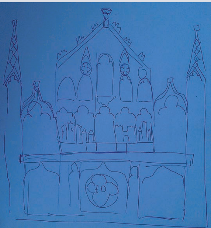
Een schetstekening van het altaar

Enige tijd geleden ben ik benaderd of ik een bestemming wist voor neogotisch houtsnijwerk. Het gaat om onderdelen van een (devotie)altaar. Op foto's die ik toegestuurd kreeg zag ik al dat het ging om één grote puzzel van onderdelen uiteenlopend van manshoge achterwanden tot losse ornamenten zoals hogels en kapitelen. Mijn interesse was gewekt, hoewel ik niet direct een bestemming voor ogen had. Op een goede dag ben ik gaan kijken en al puzzelend heb ik een reconstructietekening (schets) kunnen maken, die mogelijk nog wat bijgesteld moet worden omdat niet alle onderdelen direct te identificeren waren. Deze tekening heb ik verder uitgewerkt en staat bij deze oproep afgebeeld.