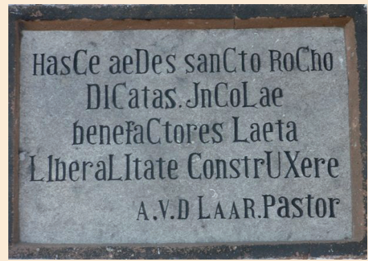
Het chronogram met het jaartal 1919

De vertaling van de latijnse tekst luidt: "Dit gebouw, aan de H. Rochus toegewijd, hebben inwoners-weldoeners met blijde vrijgevigheid opgericht". De Romeinse cijfers bij elkaar opgeteld staan voor het jaartal 1919.