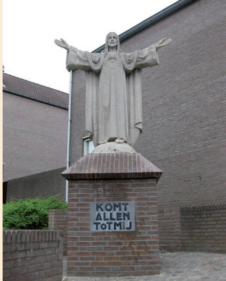
Het beeld in de Schoolstraat