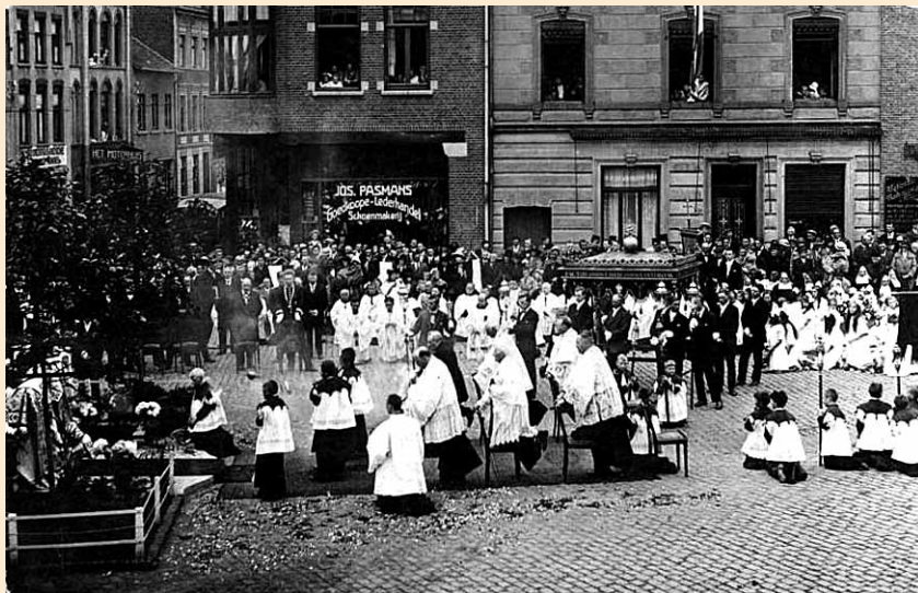
Inzegening van het kruis in 1920