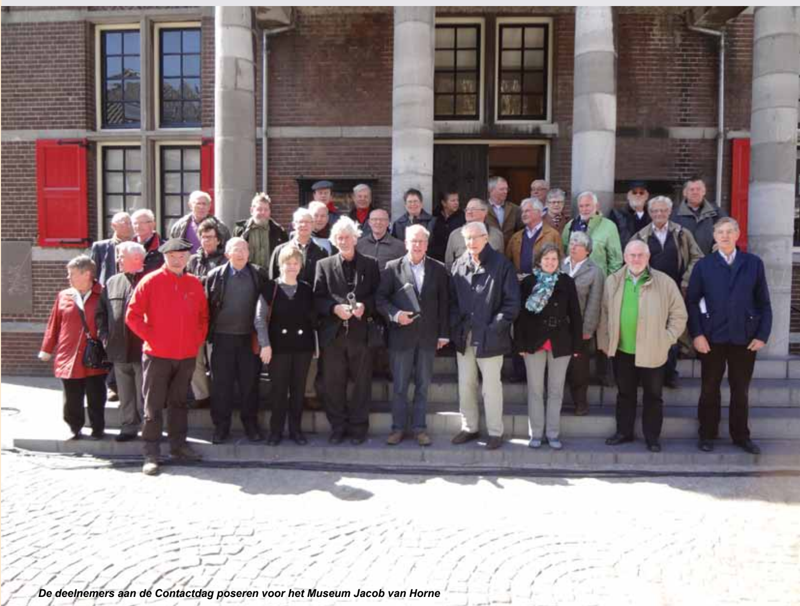
De deelnemers aan de Contactdag poseren voor het Museum Jacob van Horne

Tegen de klok van vieren was er weer een dag toegevoegd aan de lange reeks van Contactdagen.