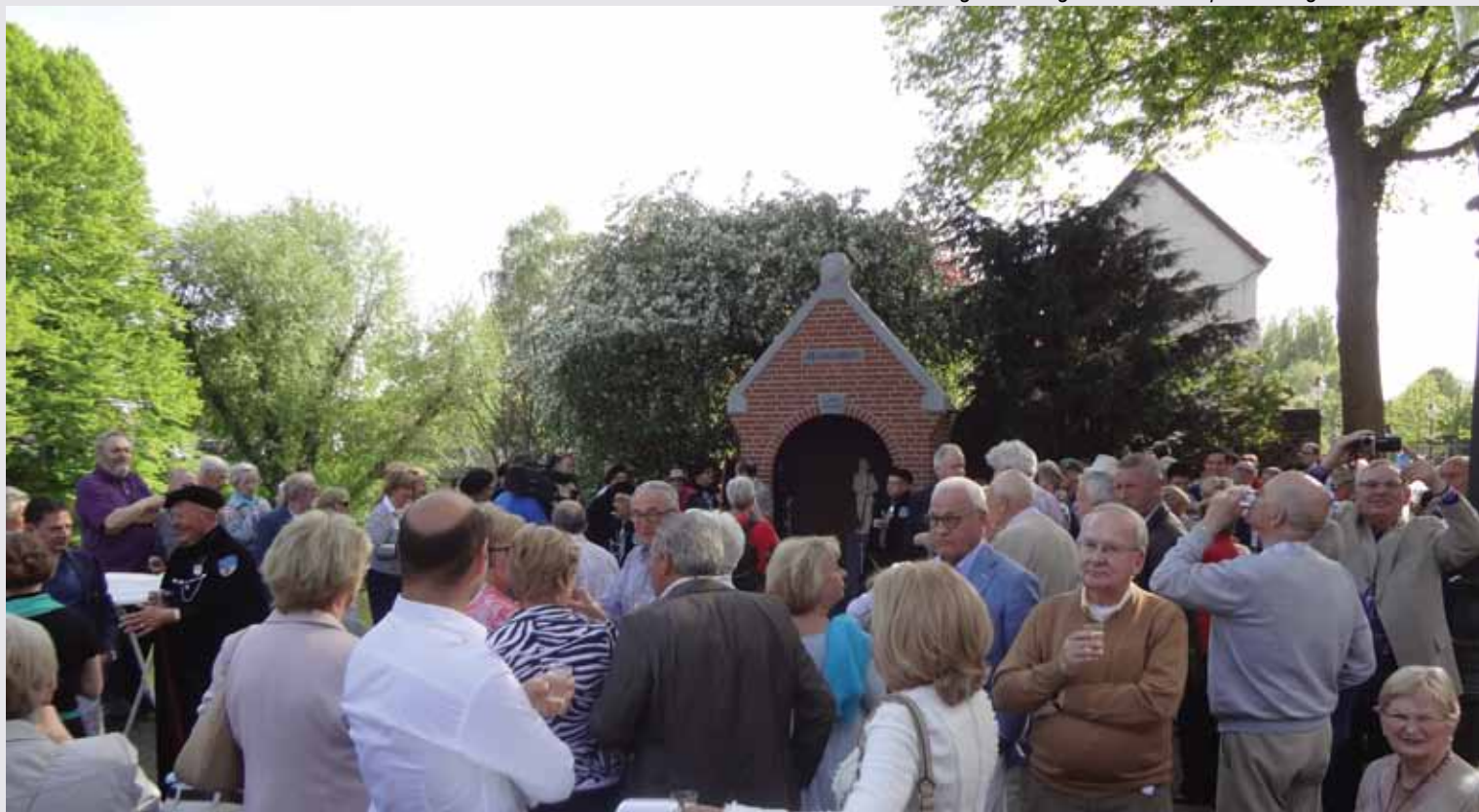
Een grote menigte is voor de kapel samengestroomd