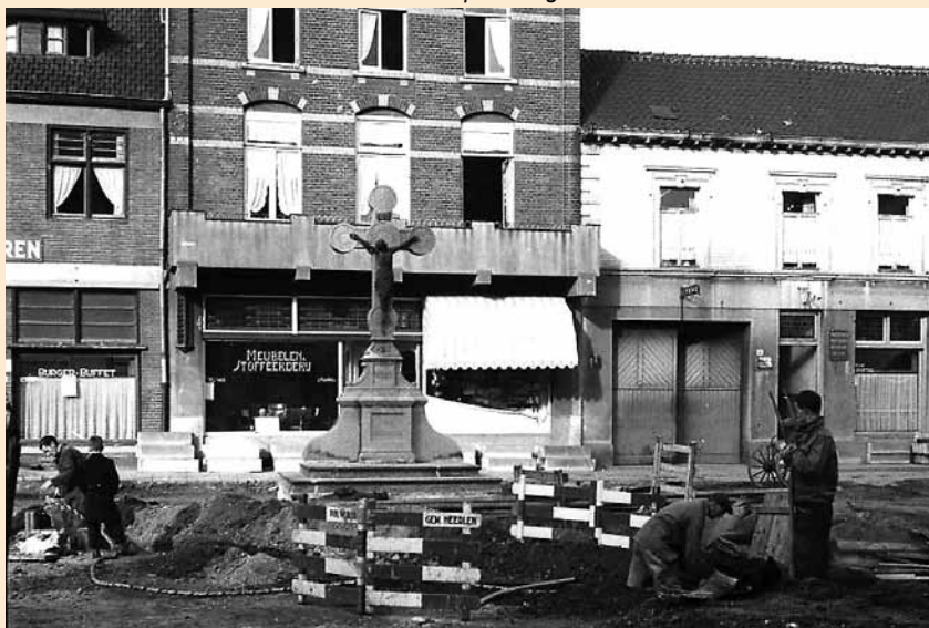
Verplaatsing van het kruis naar achteren in 1951