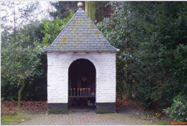
De Mariakapel te Beers, gebouwd in 1942 als protest tegen de internering van Jan de Quay