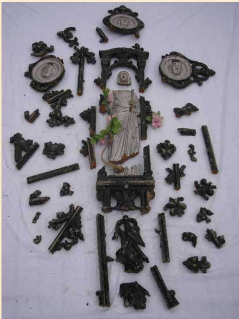
Het kruis in 48 stukken