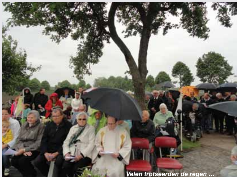
Velen trotseerden de regen ...