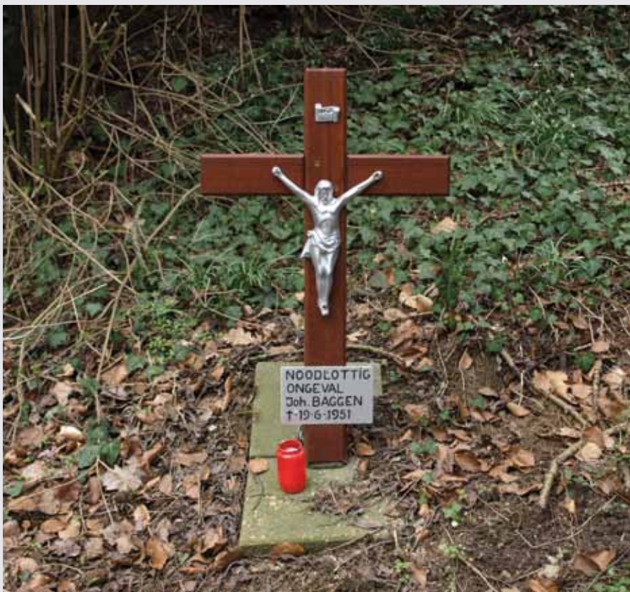
Het in 2013 geplaatst ongevalskruis