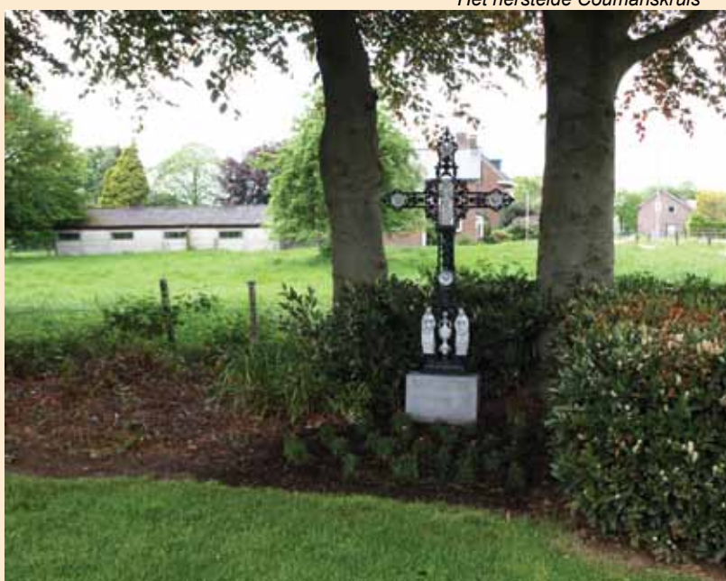
Het herstelde Coumanskruis