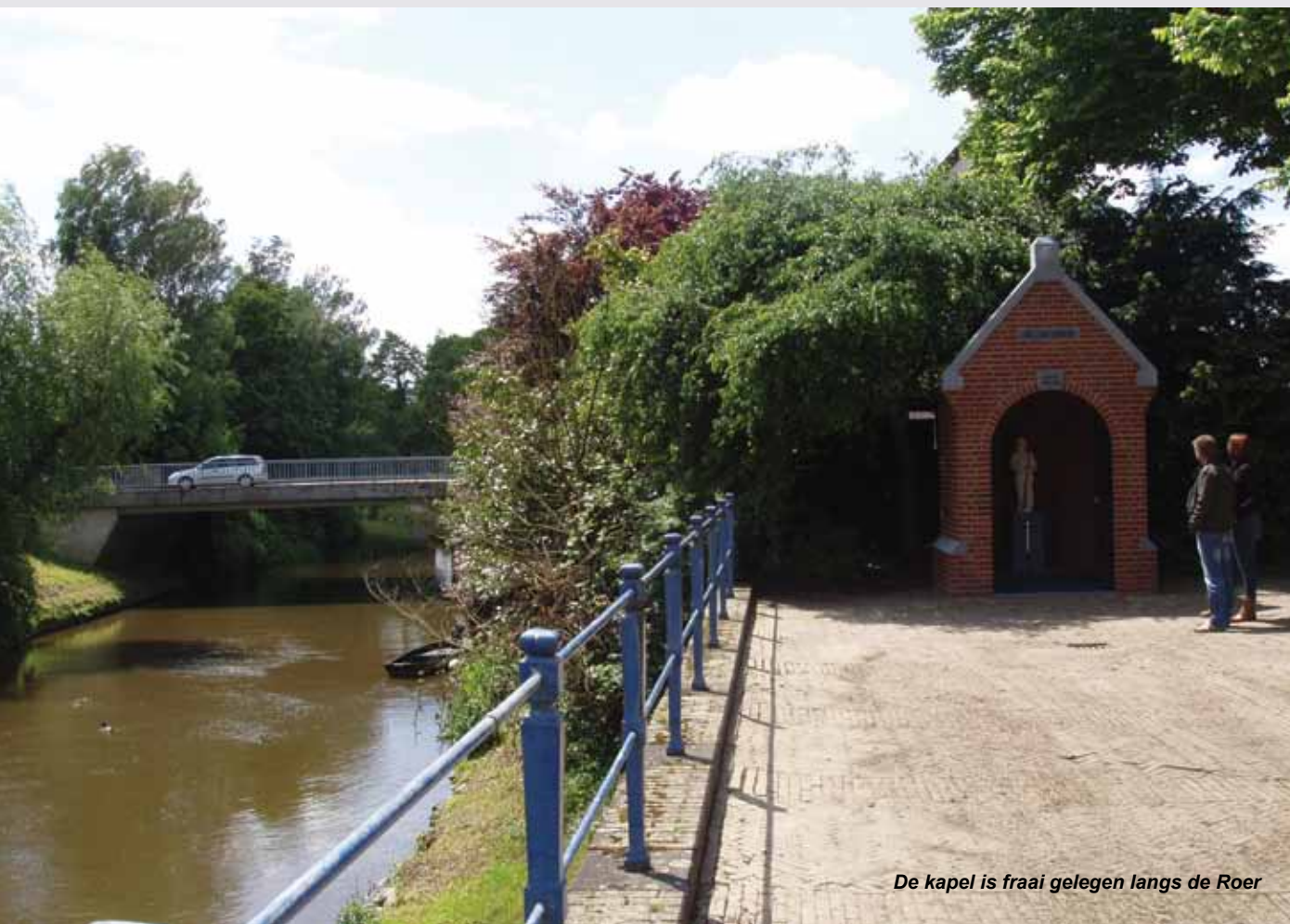
De kapel is fraai gelegen langs de Roer

Het was dus geen toeval, dat via hem beide organisaties elkaar vonden in het idee om een kapel te bouwen.