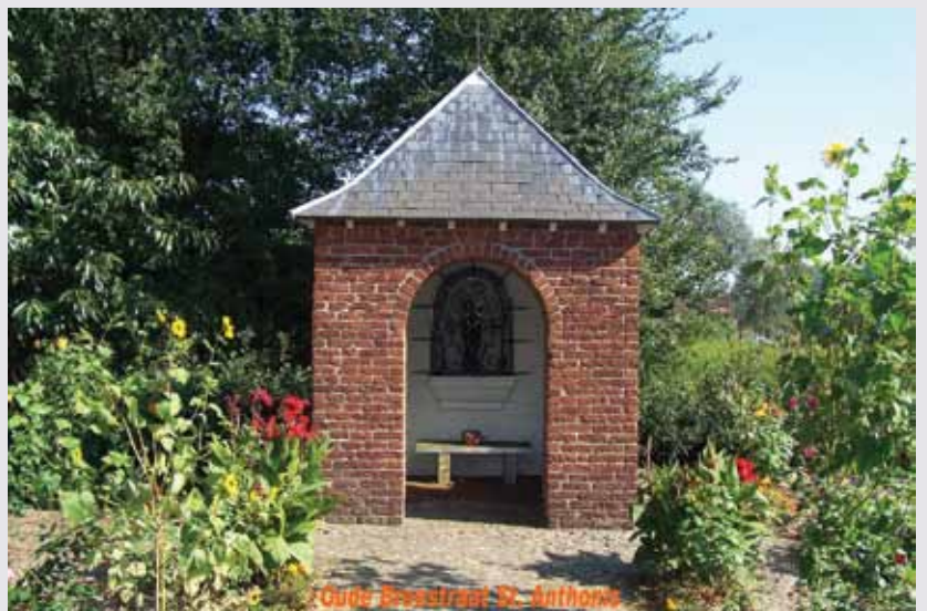
In 1947 bouwden het Studentengilde een kapel in Sint Anthonis

Deze kapel is gelegen op de historische begraafplaats langs de Dommel. Het gebouwtje is zeer eenvoudig uitgevoerd. Het heeft een rieten zadeldak en een halfronde absis. Bij de bouw van de kapel is gebruik gemaakt van oude stenen, afkomstig van de blootgelegde fundamenten van de oude middeleeuwse kerk. In 1968 is De Hogert opnieuw als begraafplaats in gebruik genomen. Het kapelletje dient tegenwoordig als knekel- /opslaghuisje.