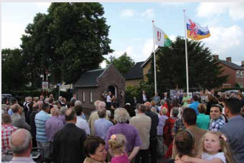
Vele tientallen belangstellenden