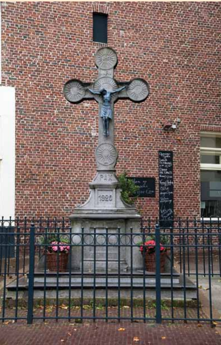
Het kruis in de huidige situatie op de Pancratiusstraat/Dautzenbergstraat/Willemstraat

U kent het ongetwijfeld, u komt er regelmatig langs en zelden zult u zich afvragen wat is er gebeurd, waarom en wanneer is dit enorme kruis geplaatst.