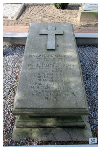
Grafmonument voor de familie Geurts

Tekst en foto's: René ten Dam, Stichting Dodenakkers.nl