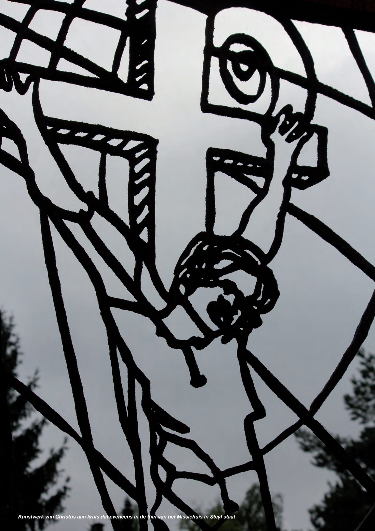
Kunstwerk van Christus aan kruis dat eveneens in de tuin van het Missiehuis in Steyl staat