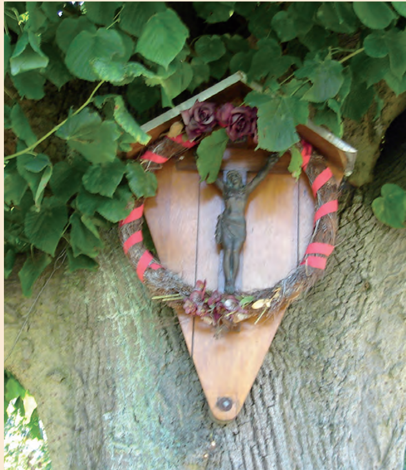
Kruisbeeld Terhagen uit boekje Kleine Monumenten Stein. (Jan Berix)

De mooie plaatsing van beide monumentjes, zowel boom als kruisbeeld, nodigt je bij een wandeling naar het bos uit, even op die plek stil te staan en zo men wil een groet te brengen.