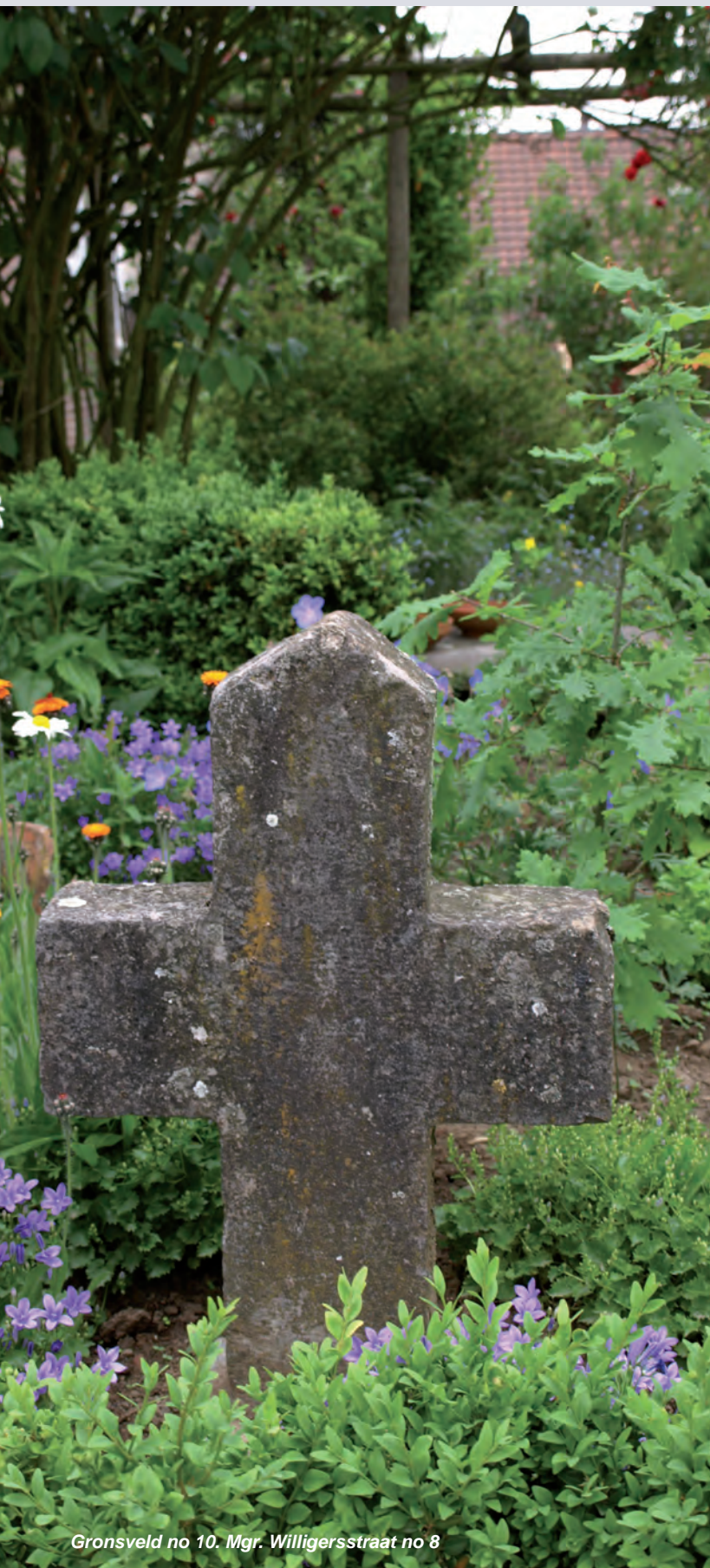
Gronsveld no 10. Mgr. Willigersstraat no 8