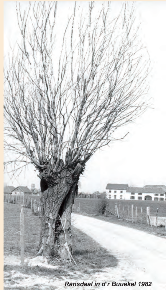
Ransdaal in d'r Buuekel 1982