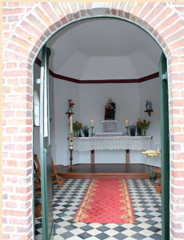
Interieur van de H. Anna kapel