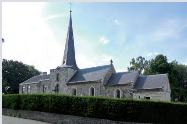
St. Lambertuskerk Holset