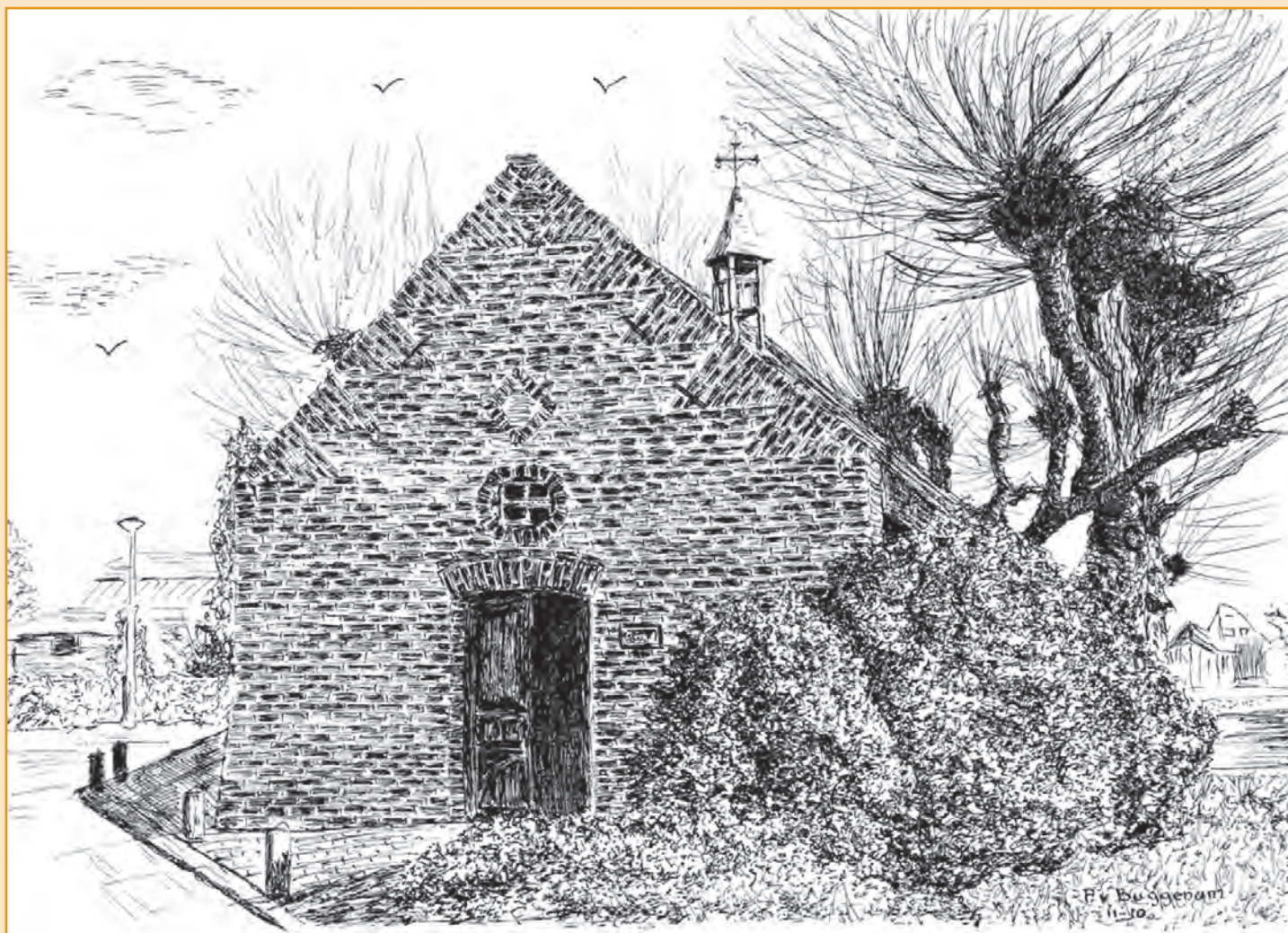
Pentekening Heijer kepelke van P.v.Buggenum

De helft van de prachtige dubbele eikenhouten deur staat uitnodigend open. Ik treed binnen in het kleine oude Mariakepelke in de buurtschap Heide te Swalmen. Een wit geschilderd altaar in barokke stijl prijkt tegen de achterwand. Het madonnabeeldje staat in een nis midden op het altaar.