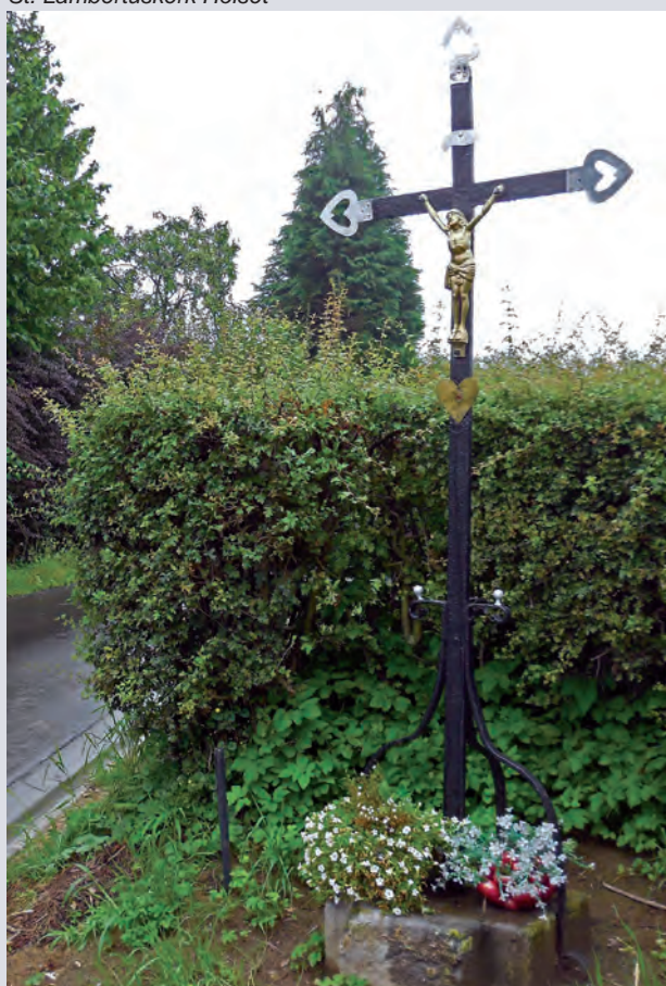
Kruis aan de Weijersweg