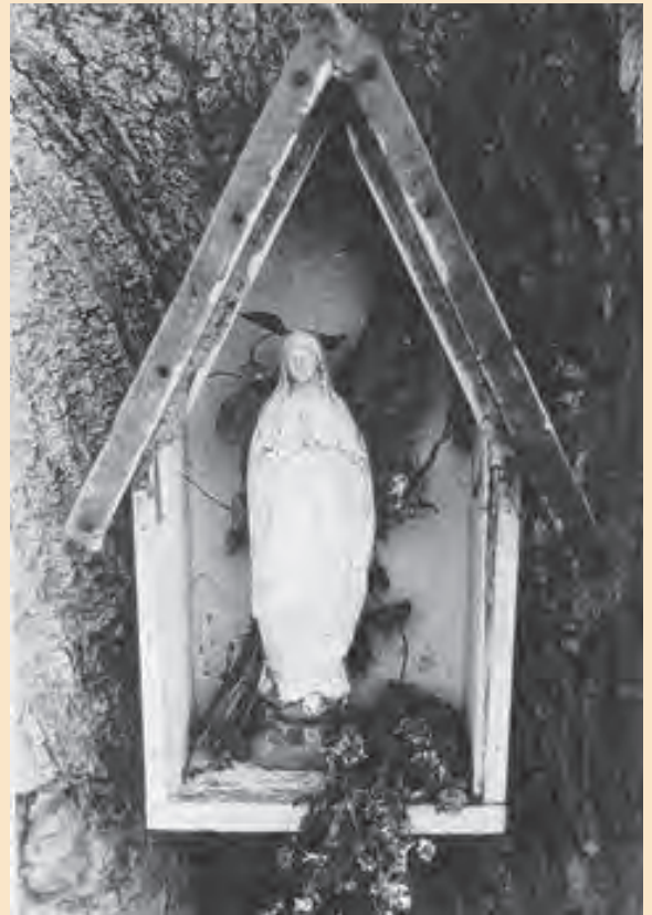
Boomkappelletje uit 1936