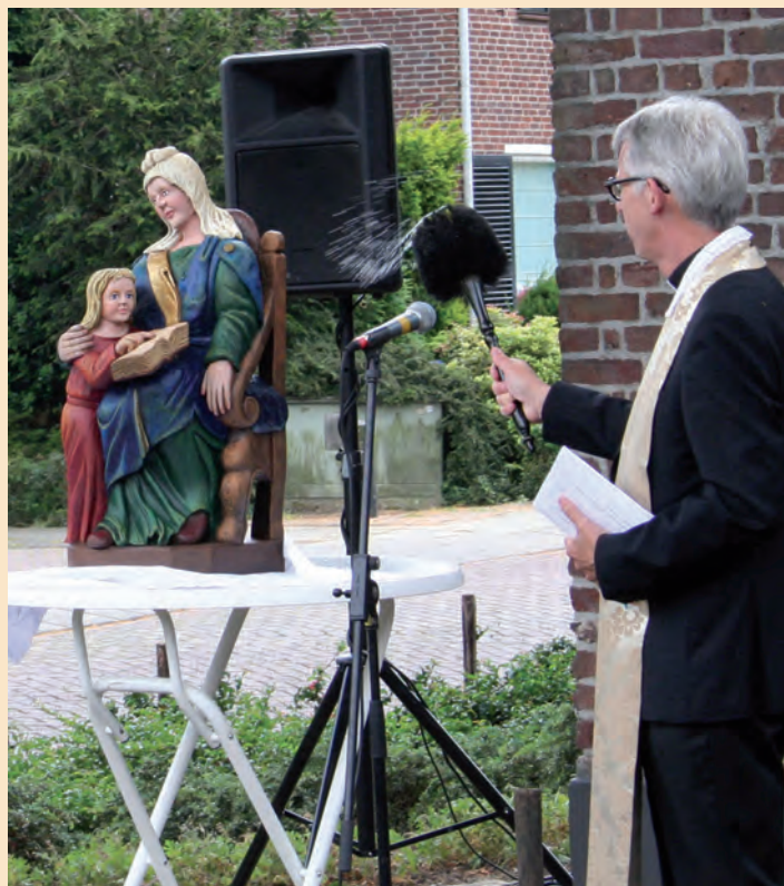
Inzegening van het beeld van de H. Anna