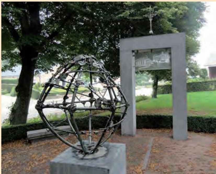
Herinneringsmonument aan de afgebroken kloosters van de Zusters en Paters van de Montfortaanse Congregatie in Schimmert