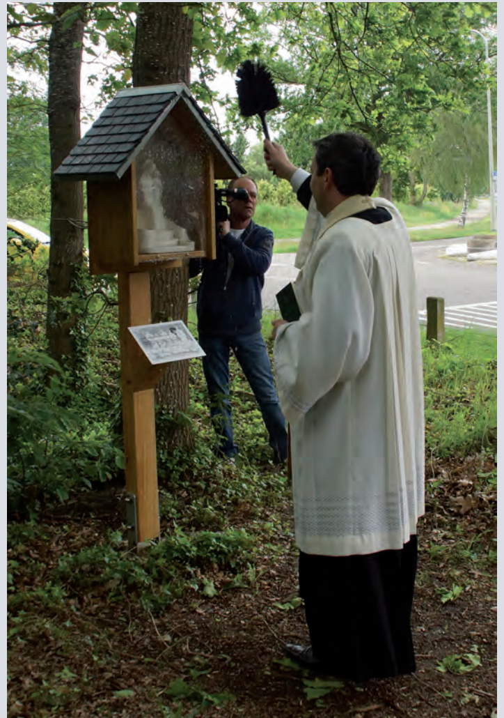
Herinzegening nieuw Mariakastje

Het zou mooi zijn als zich mensen melden die misschien andere informatie hebben dan tot nu bekend is over de plek en het beeld.