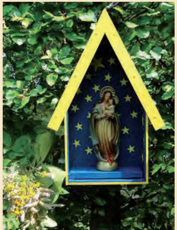
Boomkappelletje herplaatst in 2014