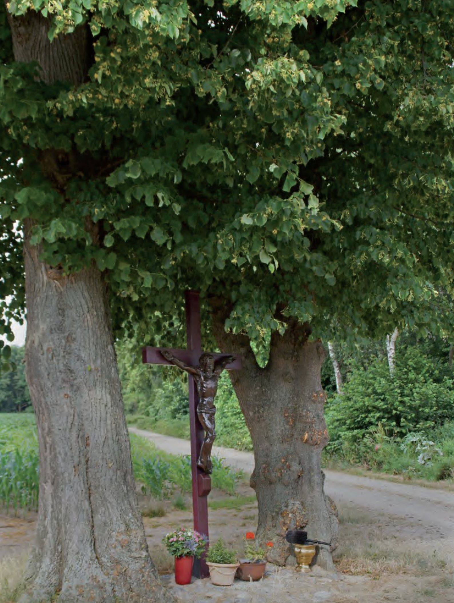
Kruisbeeld aan de Stekstraat in Baexem