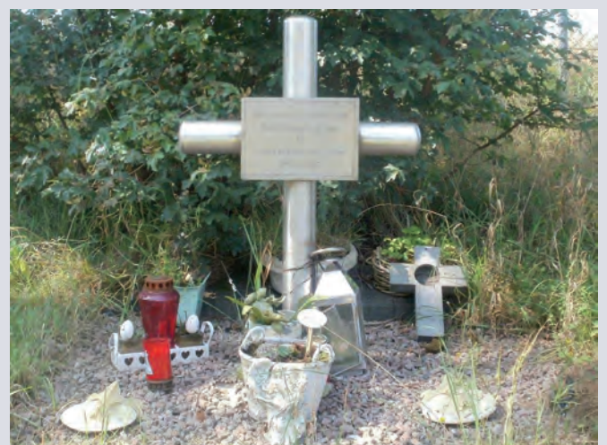
Ongelukskruis Luukie van Wanrooy

Op het gedenkplaatje dat op het kruis is bevestigd staat naast de namen van de verongelukte kinderen de toepasselijke tekst: Gedenk hen.