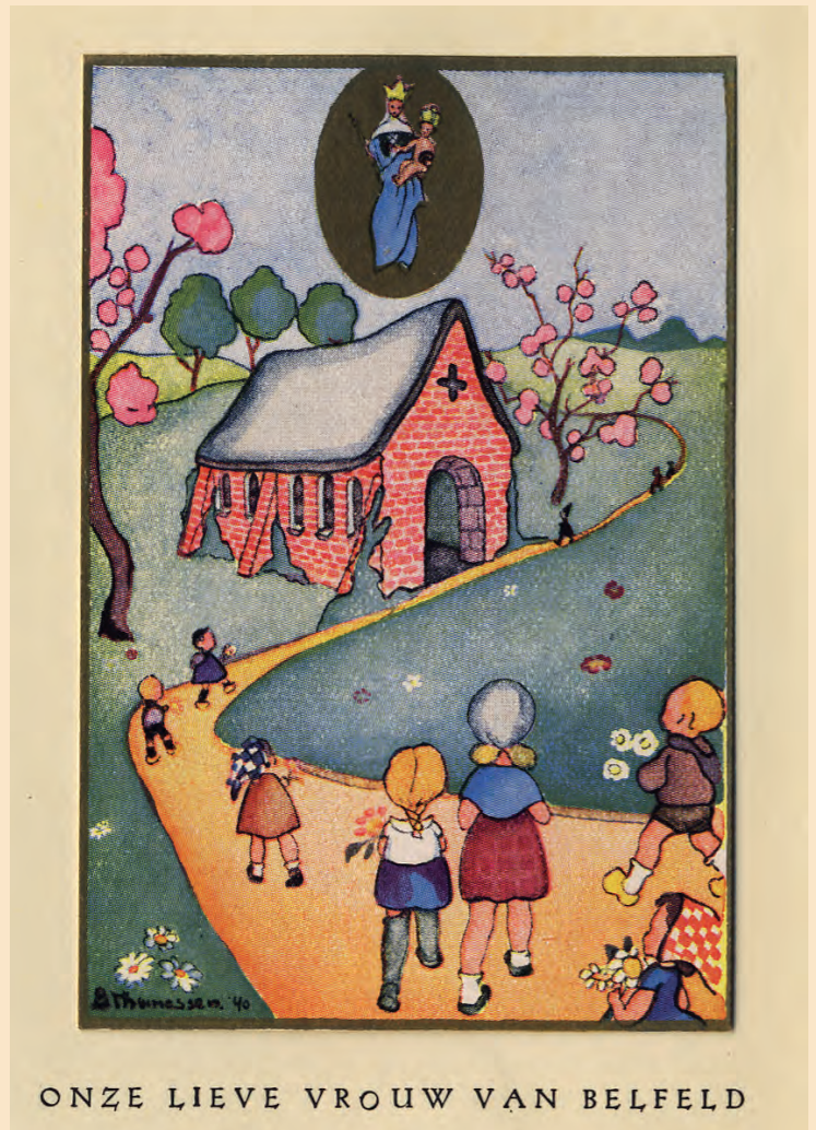
ONZE LIEVE VROUW VAN BELFELD

De bomen groeiden als een stolp van doorschijnend groen over de kapel heen en daar binnen staat Maria glimlachend te wachten op groot en klein, op rijk en arm, op ziek en gezond, en niemand gaat van hier ongetroost heen.