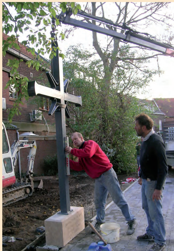
Plaatsen van het kruis met de gedenksteen op 28 oktober 2014