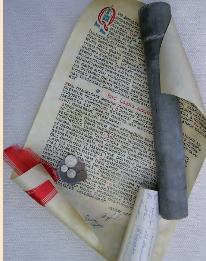
Loden koker met oorkonde, documenten met namen getuigen en munten