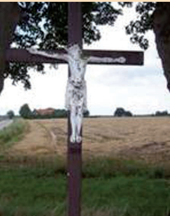
Baexem Stekstraat. 5 februari 2005

In maart 2015 werd bij het atelier van de Stichting Kruisen en Kapellen in Venray door Gerrit Verstegen uit Venray via zijn vriendin mevrouw Vrenken uit Heythuysen een corpus gebracht dat in een sloot ter plaatse gevonden was. Het moest waarschijnlijk dus daar ergens uit de buurt vandaan komen. Gerrit Verstegen wist dat men bij K&K Venray beelden restaureert en dacht dat zij er misschien iets mee konden doen. Een speurtocht volgde.