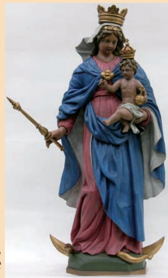
Het volledig gerestaureerde Mariabeeld, zoals het vanaf zaterdag weer in de Leenderkapel staat