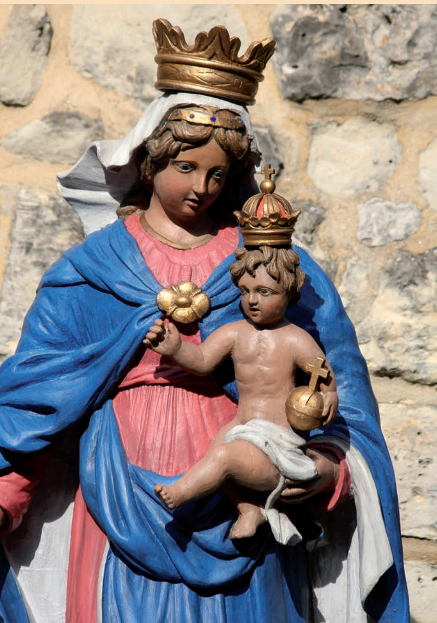
Het volledig gerestaureerde Mariabeeld zoals het vanaf zaterdag weer in de Leenderkapel staat.

Het meer dan 200 jaar oude Mariabeeld uit de Leenderkapel in Landgraaf is zaterdag 30 mei na een flinke restauratie opnieuw ingezegend. Dit gebeurt tijdens een eucharistieviering in de kapel, bij gelegenheid van de afsluiting van de meimaand-Mariamaand.