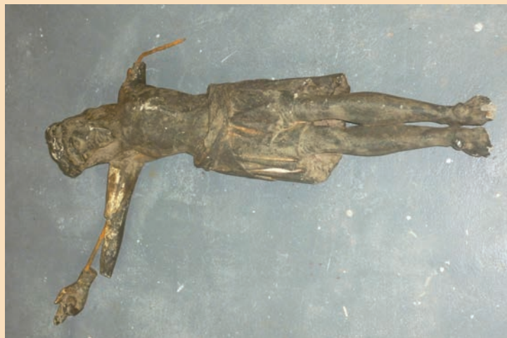
Het zwaar beschadigde corpus zoals het werd teruggevonden.