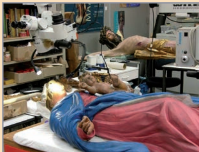
Het Mariabeeld van Leenhof op de restauratietafel in Maastricht.