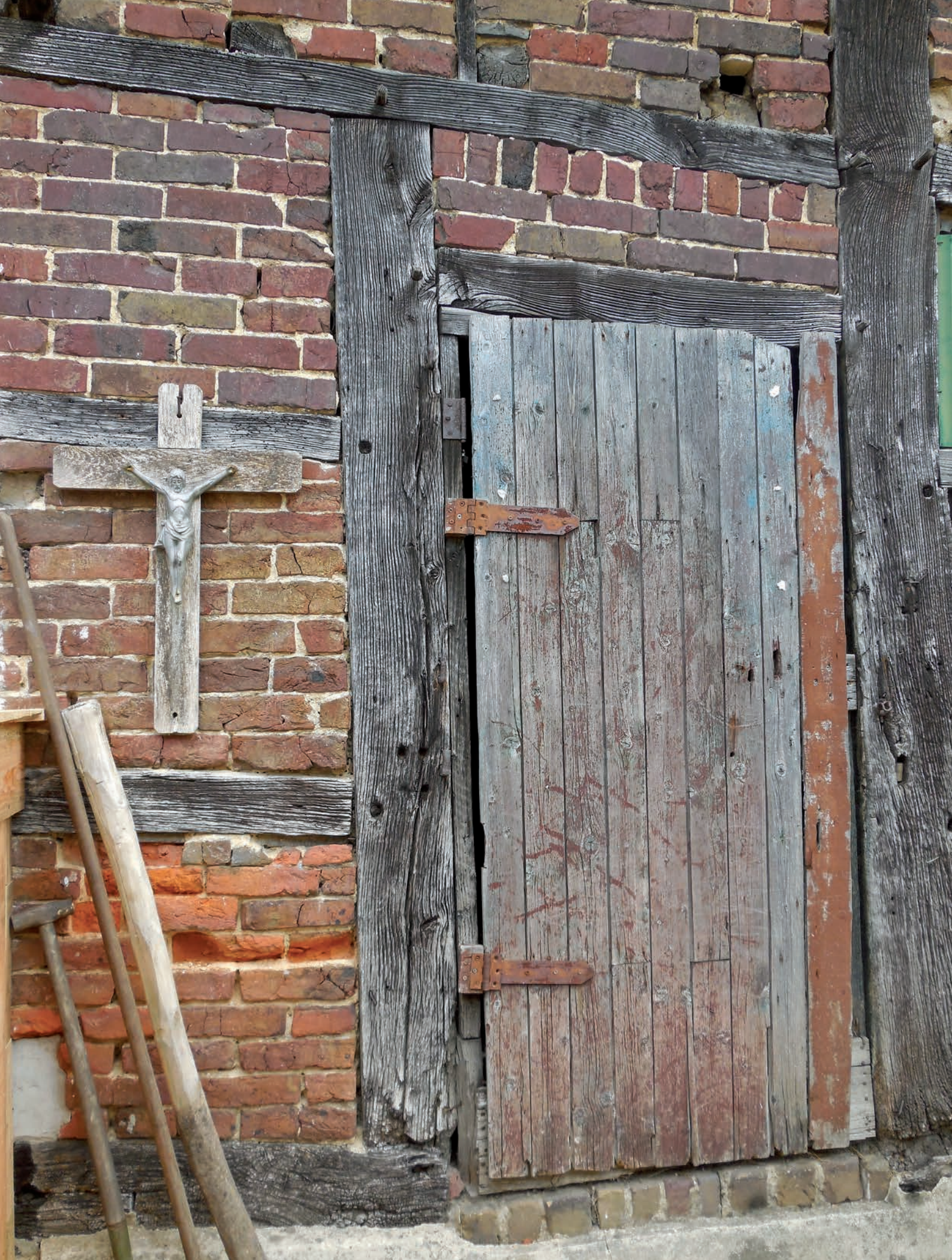
En daar pronkt het verweerde kruisje nu alsof het er altijd al heeft gehangen.