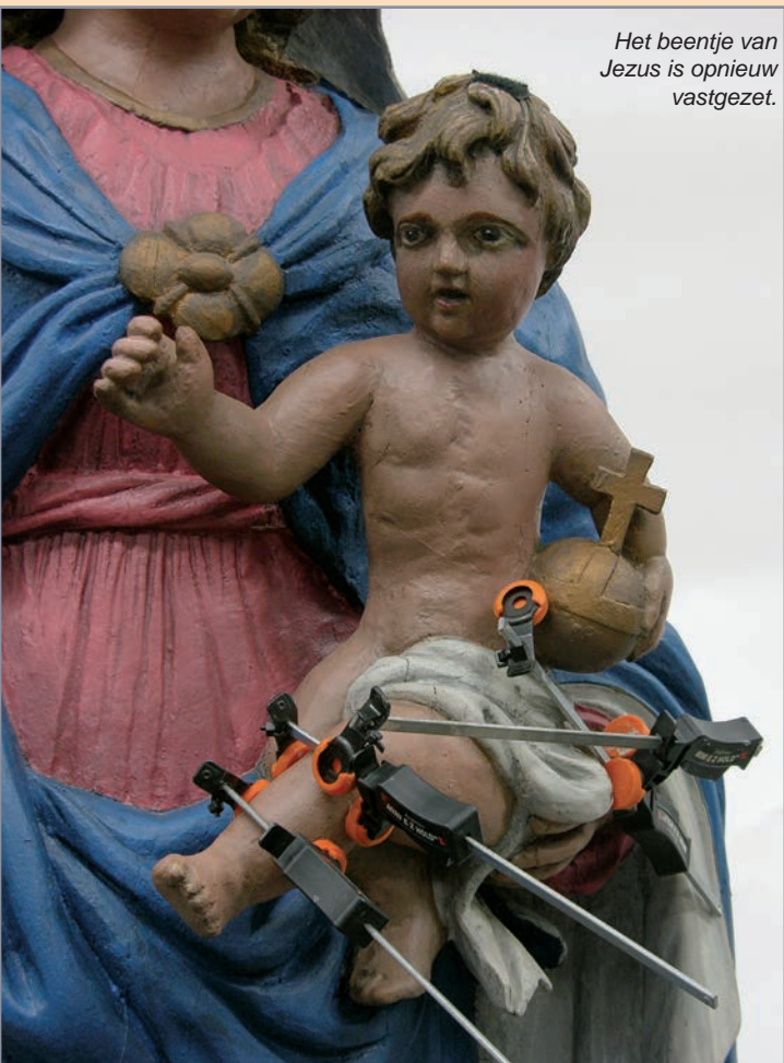
Het beentje van Jezus is opnieuw vastgezet.