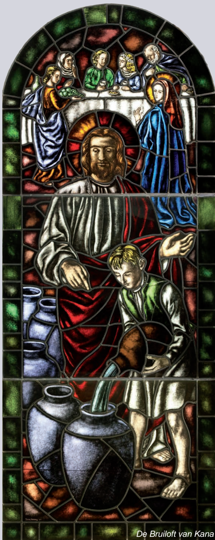
De Bruiloft van Kana

Een volgende stap was in overleg met de architect een nieuwe plek te kiezen voor de vier ramen. De oude plaatsen waren immers al ingevuld met nieuwe