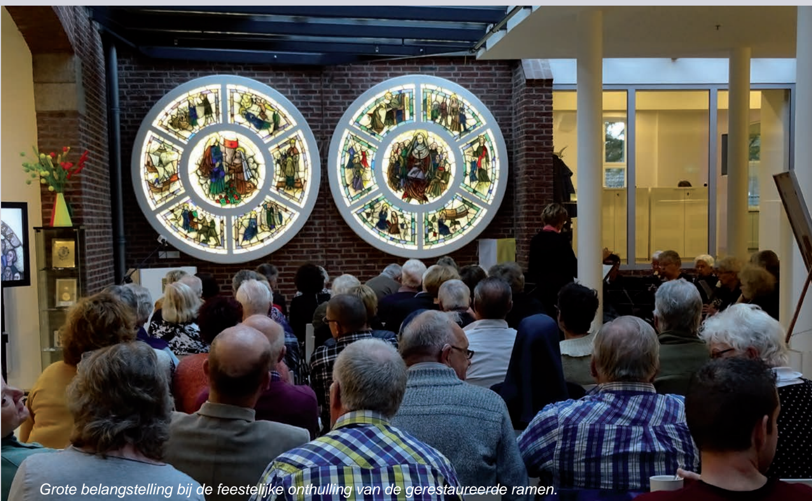
Grote belangstelling bij de feestelijke onthulling van de gerestaureerde ramen.