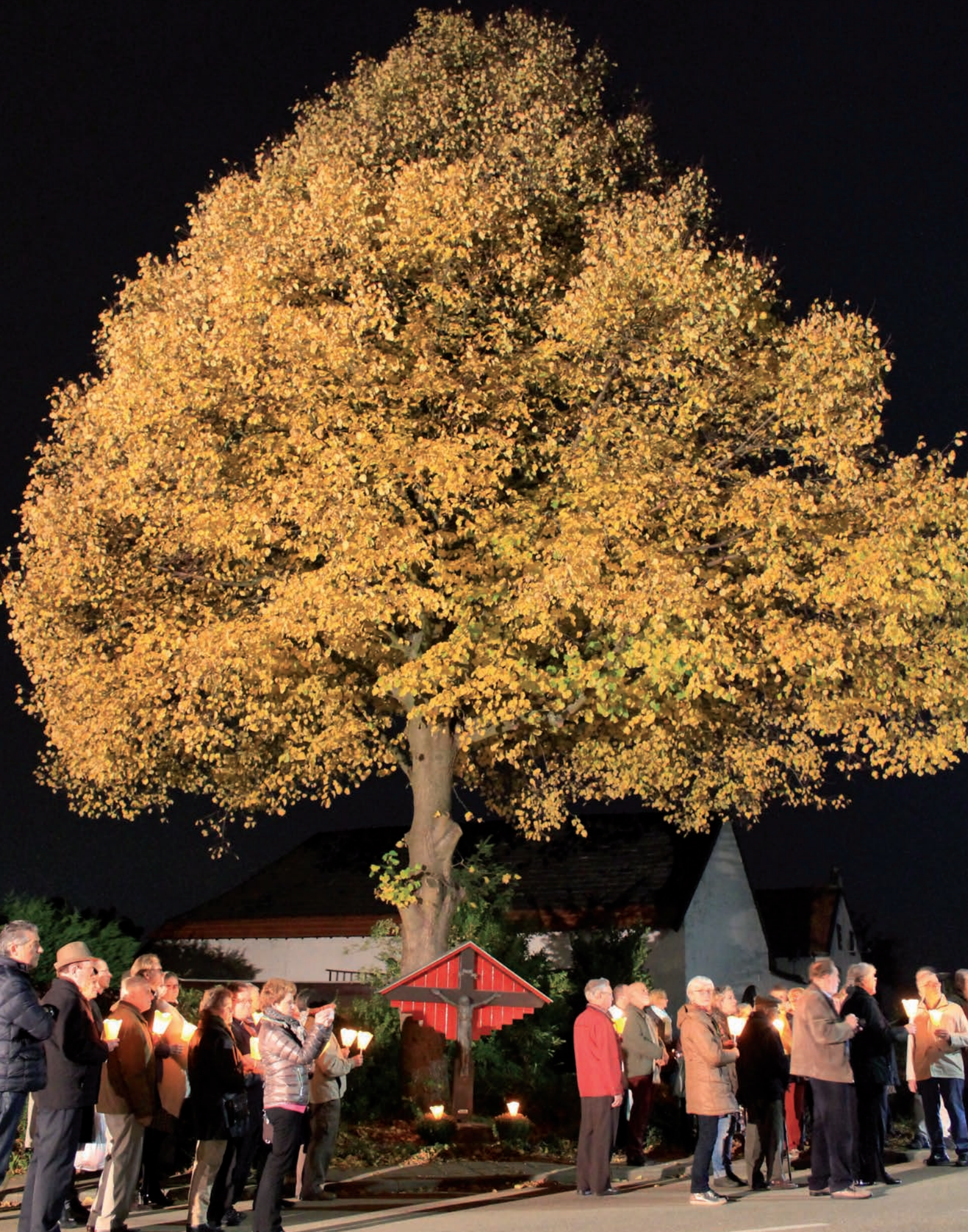
Inzegening kruis in Spaubeek (Heggerweg-Soppestraat-Kupstraat)