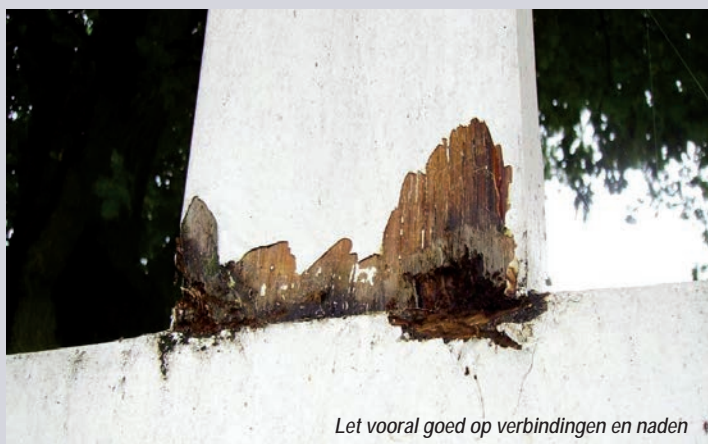
Let vooral goed op verbindingen en naden

Niet altijd worden muren alleen maar geschilderd 'voor het mooi', soms dient de verf ook als vochtwering. Het effect hiervan is echter sterk wisselend en moeilijk vooraf te voorspellen. Minerale verf en siliconen-emulsieverf leveren in het algemeen de beste resultaten op. Een dergelijk "oplossing" is echter alleen aan te raden als het op geen enkele andere wijze lukt te muur droog te krijgen. Op droge (binnen)muren kunnen ook goedkopere witkalk en latexverf worden aangebracht. De juiste materiaalkeuze is dus sterk afhankelijk van de ondergrond en de vochthuishouding. Raadpleeg bij twijfel altijd een deskundige om onnodige teleurstellingen te voorkomen.