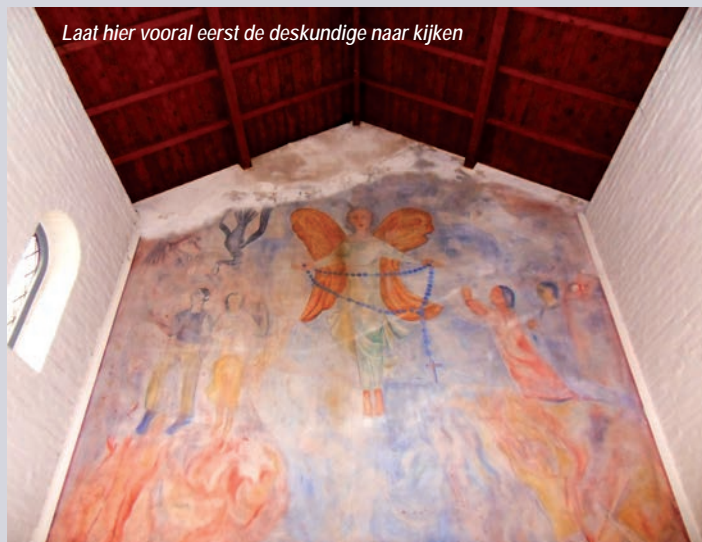
Laat hier vooral eerst de deskundige naar kijken

Bespaar dus nooit op de kwaliteit van de verf. Besparingen op het arbeidsloon zijn vele malen effectiever. Let er wel op dat u de schilderwerkzaamheden goed uitvoert en raadpleeg bij twijfel altijd een deskundige, bij voorbeeld de monumentenwacht.