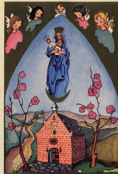
ONZE LIEVE VROUW IN HET ZAND, NEER

O. L. Vrouw van Neer houdt hier audiëntie. Het eigenlijk miraculeus beeldje zou in de buitengevel der kapel staan, terwijl in de kapel een mooi houten 16 de eeuws Mariabeeld