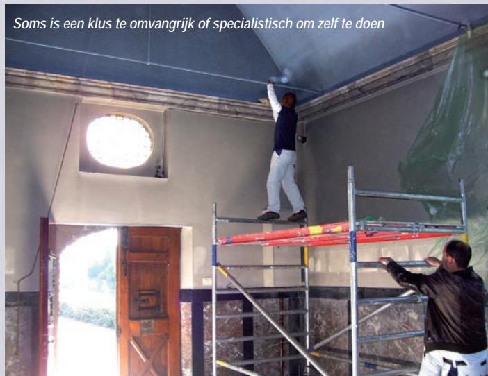
Soms is een klus te omvangrijk of specialistisch om zelf te doen

Vermijd vochtige omstandigheden (motregel, mist, dauw) of felle zon.