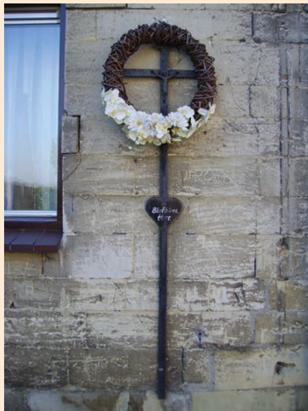
Ijzer op mergel, gevaar voor roestdruk

Controleer daarom regelmatig of ijzeren delen goed in de verf zitten en of zich nog geen (haar)scheurtjes hebben gevormd.