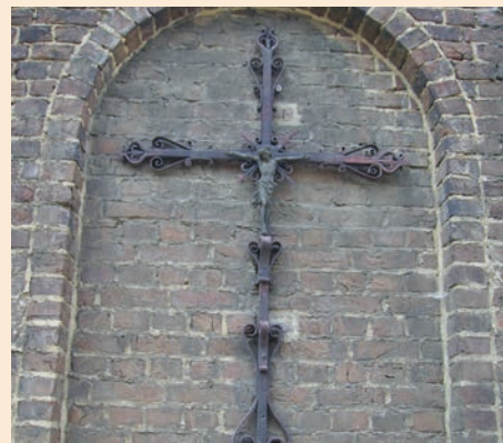
Ijzer op baksteen, gevaar voor roestdruk

Om bakstenen te maken wordt vochtige klei in een mal gedrukt. Om te voorkomen dat de klei aan de vorm blijft plakken, wordt daarin eerst een laagje zand gestrooid. Na het bakken vormt dit een geheel met de steen, de zogeheten bakhuid. Hoewel het zand eigenlijk een productietechnisch hulpmiddel is, biedt de bakhuid ook uitstekende bescherming, vooral tegen vochtinwerking. Behandelingen waarbij de bakhuid wordt aangetast of verwijderd (hogedrukreiniging, gritstralen) worden daarom ten zeerste ontraden. Indien gewenst is schoonmaken met een zachte bostel, lauw water en zonder agressieve reinigingsmiddelen een verstandigere aanpak. En vergeet niet dat het patina van de tijd ook z'n charme heeft en waardevol kan zijn om een deel van het verhaal van het bouwwerk te vertellen.