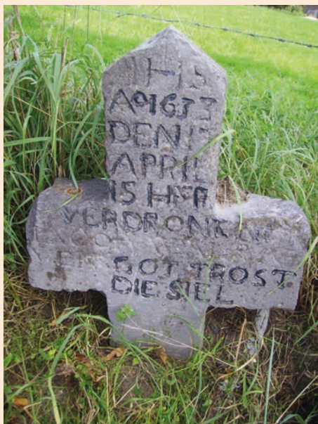
Historisch hardstenen kruis

Als sinds de verre oudheid wordt natuursteen gebruikt om bouwwerken en andere objecten een sierlijk aanzien te geven. Dat kan op allerlei manieren. Zo geven voetstukken, zuilen en kapitelen stijl aan een gevel. Ook een afwisseling van verschillende natuursteensoorten (en eventueel baksteen en pleisterwerk) kan de architectuur accentueren. Daarnaast kunnen uit natuursteen talloze ornamenten en zelfstandige objecten worden vervaardigd. Ook leent het materiaal zich voor het aanbrengen van reliëfs en teksten. Je komt deze onder meer tegen op grafzerken en gevelstenen (spreuken, jaartallen). In een aantal zeer oude natuurstenen wegkruisen zijn de naam van de overledene en de doodsoorzaak gebeiteld. Vanzelfsprekend moet je op zulke bijzondere objecten extra zuinig zijn.