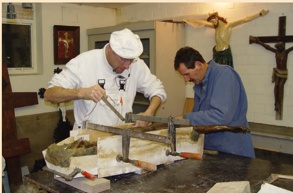
Leden van de Corpusgroep maken de mal voor de replica van het beeld van Koppe Tiës.

Voor de pelgrim uit Stramproy was het een voettocht van circa 150 kilometer (heen en terug). Hij volgde grotendeels het zelfde traject als