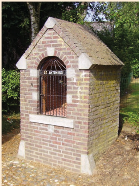
Kapelletje volledig in baksteen met natuursteen accenten