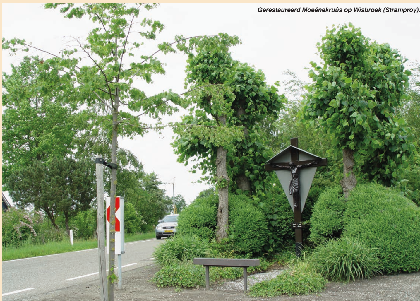
Gerestaureerd Moeënekruûs op Wisbroek (Stramproy).

In de bocht bij het Moeënekruûs werden bochtschilden geplaatst. Eén van die borden stond precies voor het kruis. In overleg met de gemeente werd een bord verplaatst zonder dat de verkeersveiligheid geweld werd aangedaan. Vroeger werden met de giften uit de offerblok de armen van Stramproy ondersteund, nu waakt het Moeënekruûs over het alsmaar drukker worden verkeer dat langs raast. Tijd om bij het kruis stil te staan, zoals vroeger de voorbijganger dat deed, gunt men zich helaas niet meer. Het bankje voor het kruis nodigt daar wel voor uit!