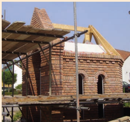
Nieuwbouw in baksteen

Ook bakstenen zijn er in vele soorten en maten. In het algemeen zijn oude soorten groter, poreuzer en zachter dan de nieuwere. Bovendien komen bij oude soorten, ook binnen een zelfde partij, aanzienlijke verschillen voor in de kwaliteit van de afzonderlijke stenen. Dat heeft te maken met de vroegere wijze van produceren in veldbrandovens. Stenen die dicht bij het vuur waren opgestapeld, werden hard gebakken; exemplaren die ver van het vuur af stonden, bleven bros en breekbaar. De dieprode tot paarsbruine veldbrandsteen komt nog veel voor in Limburg, ook bij kapellen. De zogeheten strengpersstenen, die sinds ongeveer 1890 machinaal worden geproduceerd, zijn relatief hard, veel minder poreus en vooral van een nagenoeg constante kwaliteit.