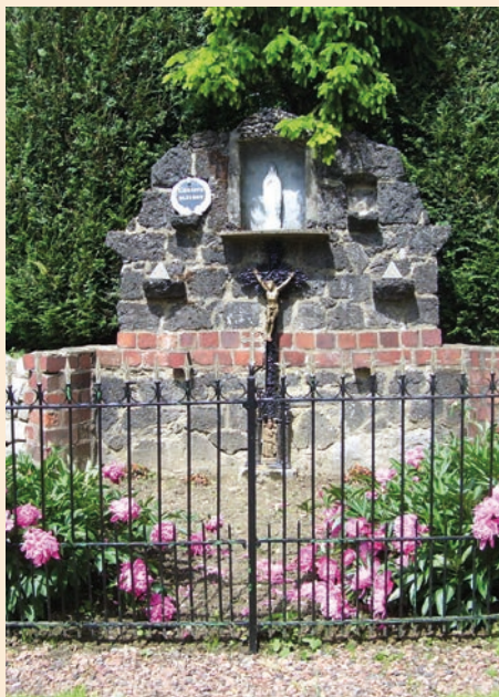
Combinatie van natuur- en baksteen