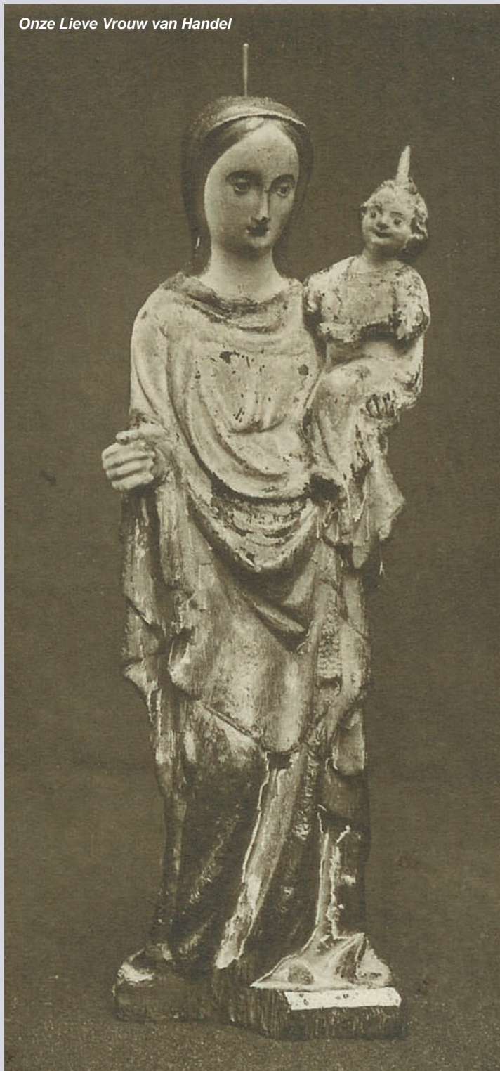
Onze Lieve Vrouw van Handel

waarbij ook de put waarin het genadebeeld ooit was gevonden, in het complex werd geïntegreerd. De Kapel in het Zand is vervolgens tot de dag van vandaag een bruisend bedevaartsoord gebléven. Zelfs de onderbreking tijdens de Franse Tijd, tussen 1797 en 1802, heeft daaraan niets kunnen veranderen. In 1862 vestigden de paters Redemptoristen zich bij de kapel en bouwden er een