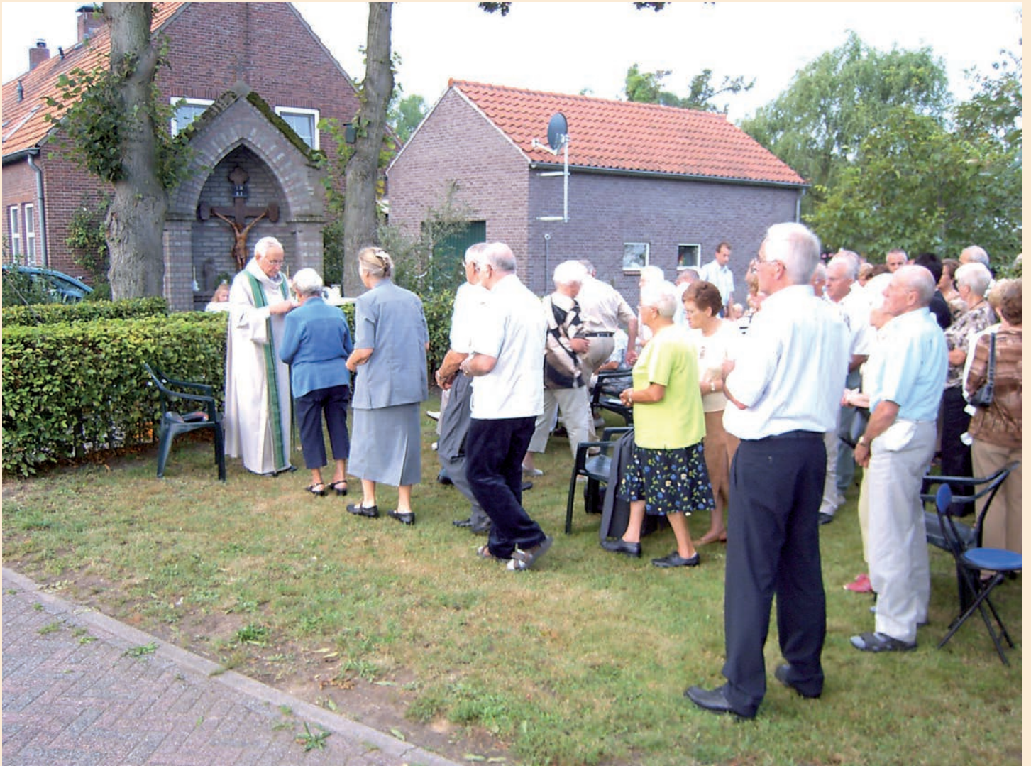
Viering 100-jarig bestaan van de kapel aan de Hoofstraat