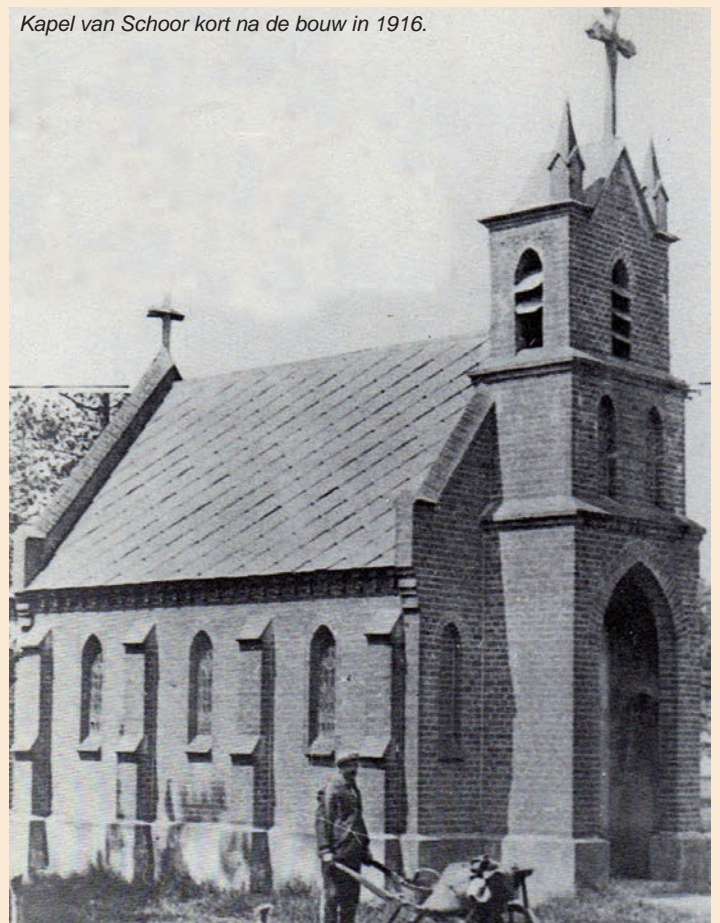
Kapel van Schoor kort na de bouw in 1916.