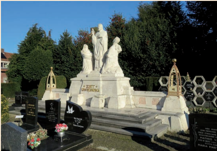
Heilig Hartmonument op de begraafplaats van Ospel