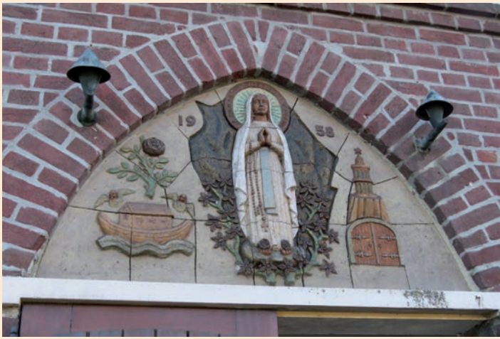
Latei boven de ingang van de kapel van Schoor