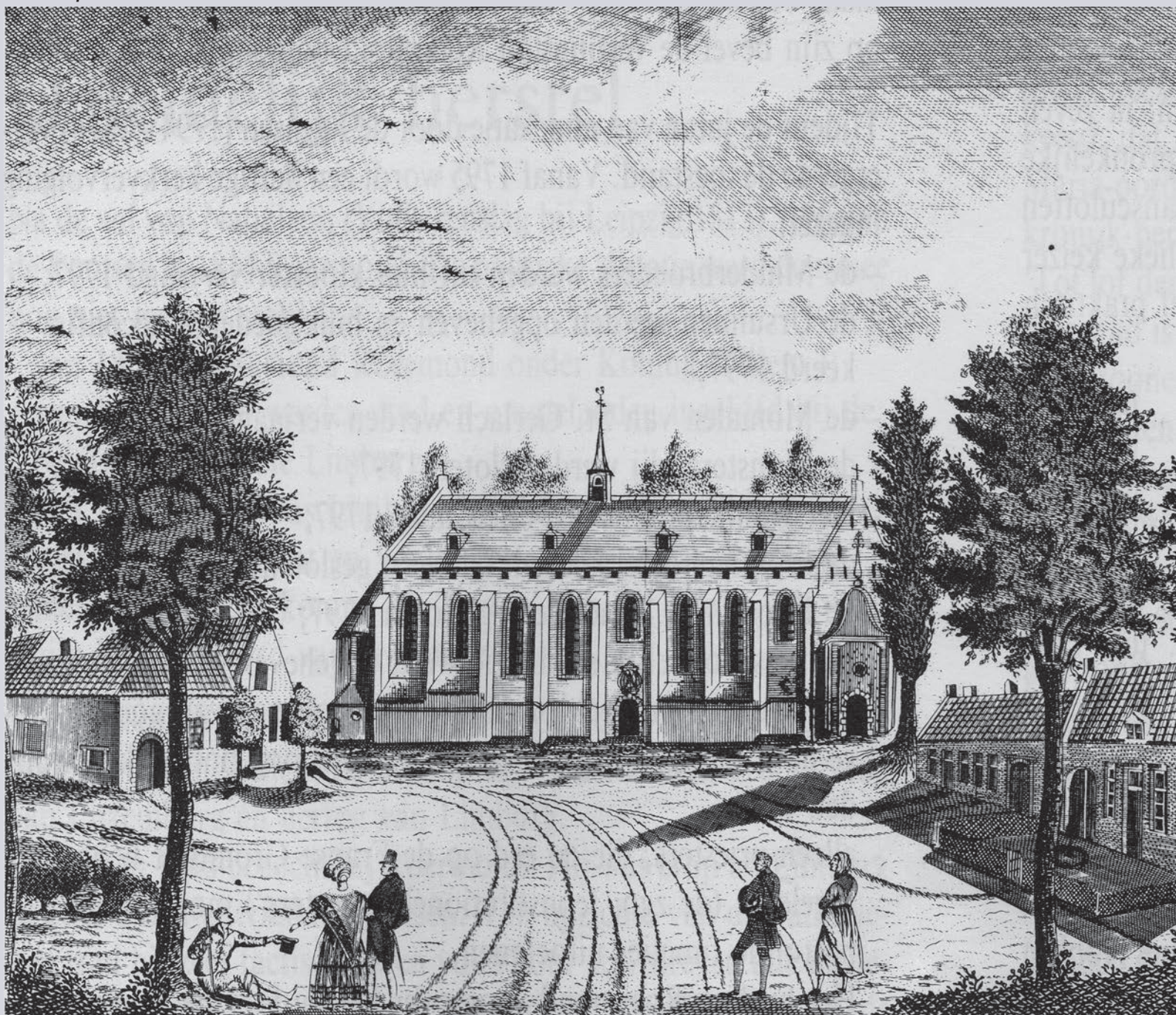
Kapel in 't Zand Roermond

Het leidde tot een stormachtige ontwikkeling van het bedevaartsoord. De kapel was op dat moment reeds tot een echte bedevaartskerk uitgegroeid (de huidige Kaarsenkapel) en zeven jaar later werd een barokke koepelkapel, de Genadekapel, gebouwd. Kevelaar is een typisch bedevaartsoord van de Contrareformatie geworden, omdat zeer veel pelgrims uit de calvinistische Republiek en het protestants geworden hertogdom Kleef er toevlucht hebben gezocht bij Maria, Troosteres der Bedrukten.