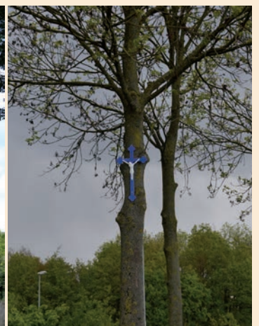
2018 boomkruis Weustenrade