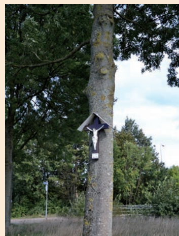
2015 boomkruis Weustenrade