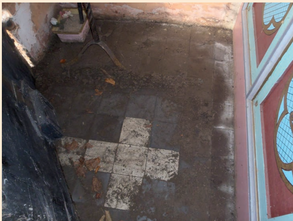
Gebrek aan aandacht

Vloeren zijn vaak voorzien van tegels, gebakken stenen of natuursteen. Gebruikssporen (slijtage van het oppervlak, hier en daar een barst) zijn acceptabel en kunnen de vloer zelfs meer karakter geven. Bij ernstige verzakkingen en losraken van elementen is herstelwerk nodig. Probeer zo goed mogelijk aan te sluiten bij de bestaande materialen. Breng elementen niet klemmend aan en gebruik geen sterk uithardende (voeg)mortels; ook een stenen vloer moet een beetje kunnen werken. Bij halfopen kapellen kan de vloer het best licht naar buiten afwateren. Onder houten vloeren moet goede ventilatie mogelijk zijn.