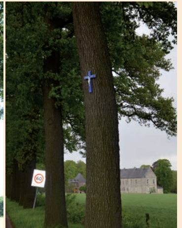
2018 boomkruis Retersbeek