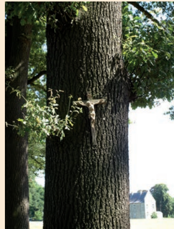
2013 boomkruis Retersbeek