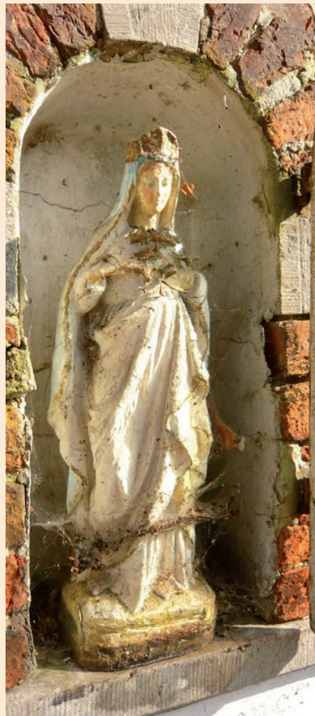
Interieur in het klein

moeten ze beter beveiligd zijn. Dit kan onder meer door een goede bevestiging, afsluiting van de toegang en sociale controle. Een alternatief kan zijn het origineel elders onder te brengen, bijvoorbeeld in een streekmuseum, en een veel minder waardevolle replica in de kapel te plaatsen.