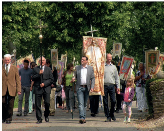
2013 - Begin Sacramentsprocessie

door vier kerkmeesters. Verder liepen natuurlijk ook mee: het processiekruis voorop, de fanfare, de bruidjes, de misdienaars (zwaaiend met het wierookvat), de flambouwen en alle verenigingen met hun prachtige vaandels. Langs de route werden diverse rustaltaren opgericht bij o.a. de Syperhof, waar op de binnenplaats als aankleding laurier- en oranjeboompjes in kuipen stonden en bij een veldkruis onder vier hoge kastanjabomen of bij het H. Hartbeeld voor de oude pastorie. Na een korte plechtigheid werd dan telkens de zegen gegeven. In de deuropening of achter het raam van vele woningen plaatsten de bewoners H.Hartbeelden, omringd door brandende kaarsen en bloemen, op mooi geborduurde kanten kleedjes. Veel mensen uit de grote omtrek komen deze processie nog altijd bewonderen.