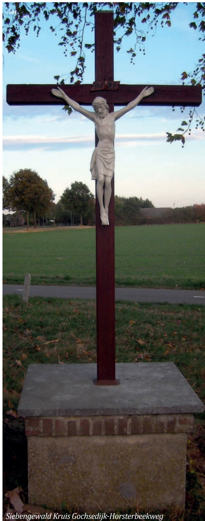
Siebengewald Kruis Gochsedijk-Horsterbeekweg