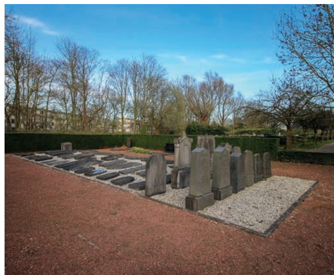
Joodse begraafplaats Sittard

Dicht gelegen bij de grens was Sittard in de jaren dertig een toevluchtsoord voor veel Duitse joden. Al in mei 1940 werd de synagoge gesloten en tussen de zomer van 1942 en eind maart 1943 zijn de meeste joodse inwoners gede-