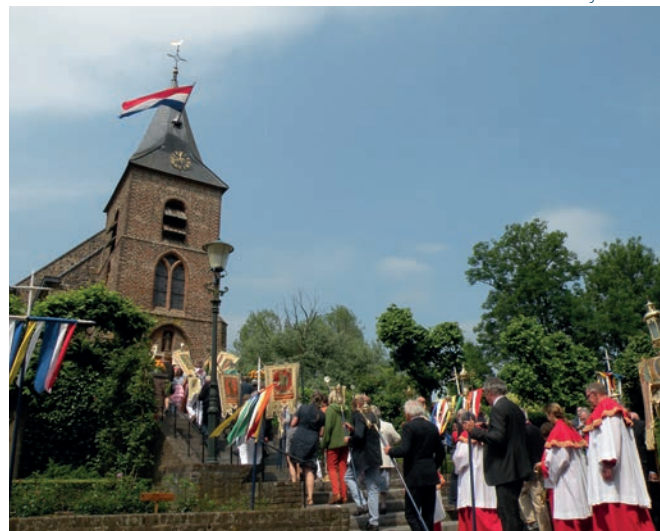
2013 - Aankomst bij de kerk

Bewerking uit het boek: "Asselt aan de Maas" door Dirk Jan van der Ven, 1947: Jan Coopmans