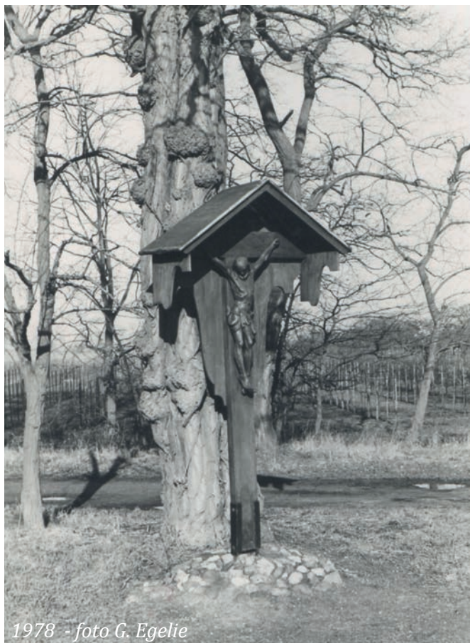
1978