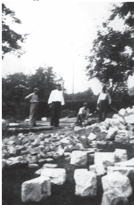
De stenen liggen klaar ...