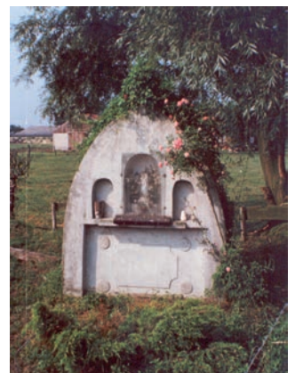
Klötjeskapel anno 1978