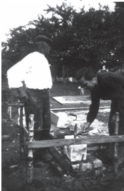
Er wordt aangevangen ...