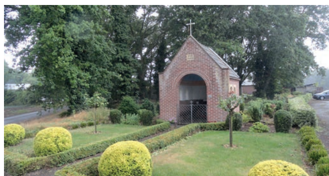
Mariakapel Langhout Kapel van de H. Familie

Een groep jonge mannen die zich in het nabijgelegen kreupelhout schuil hield ontsnapte tijdens de razzia's, aan de Duitse zoektocht. Ze beloofden samen 'We zullen een dankbaarheidskapel bouwen als we hier veilig vandaan komen'. Ook zij hebben deze belofte waar gemaakt. De kapel wordt door de buurtbewoners gekoesterd en onderhouden.