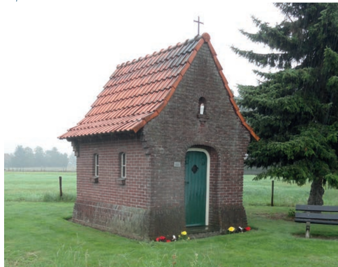
O.L.Vrouw van de Goede Duik