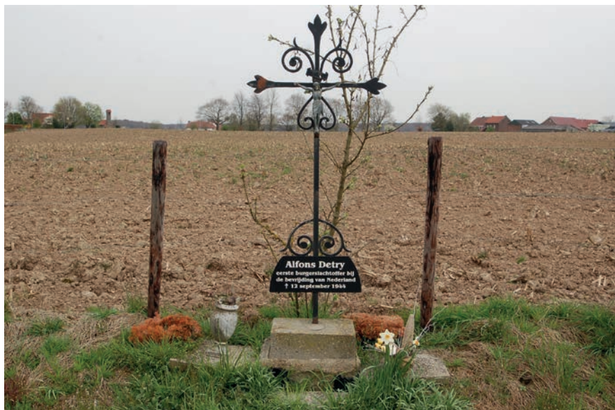
Oorlogsmonument van Alfons Detry