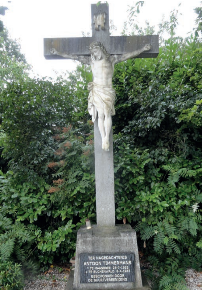
Memoriekruis Breesse Peelweg-Hulsingbroek