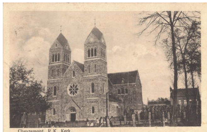
Chevremont, R.K. Kerk.