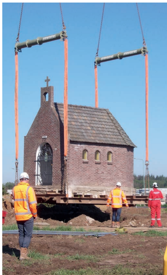
Met grote precisie ging de kapel naar zijn nieuwe plek. Er verschoof geen dakpan; het beeld had op het altaar kunnen blijven staan.

Op Sint Lindertsdag 6 november 1954 werd de nieuwe kapel ingezegend en in gebruik genomen. In de jaren zestig werd de kapel nog door bedevaartgangers bezocht. Daarna werd nog drie decennia bij gelegenheid van Sint Lindertsdag een Heilige Mis opgedragen. Dan was er ook een kleine kermis. De celebrant en zijn misdienaren