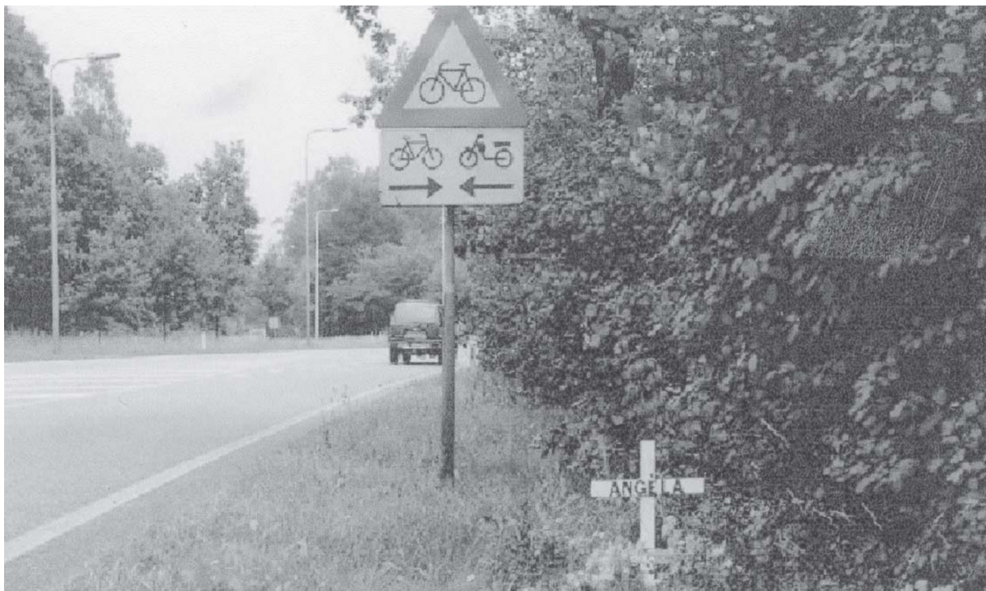
Dit kruis zal uiteindelijk verdwijnen en aan de overkant van de weg als stenen kruis voortbestaan.