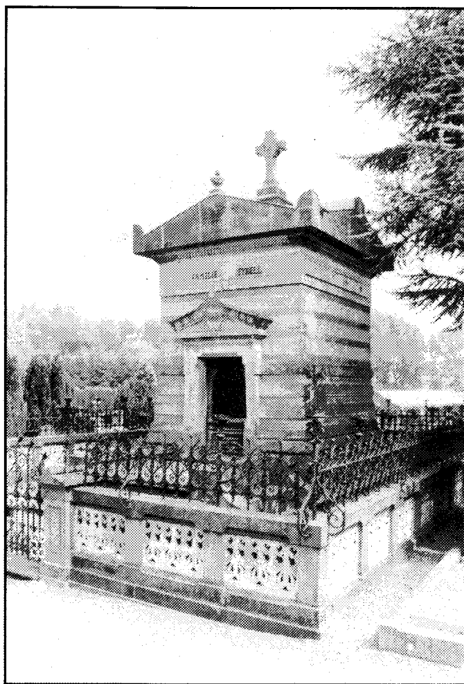
Neo-classicistische grafkapel van de familie Tyrell te Vaals. In 1990 Beschermde als Rijksmonument.