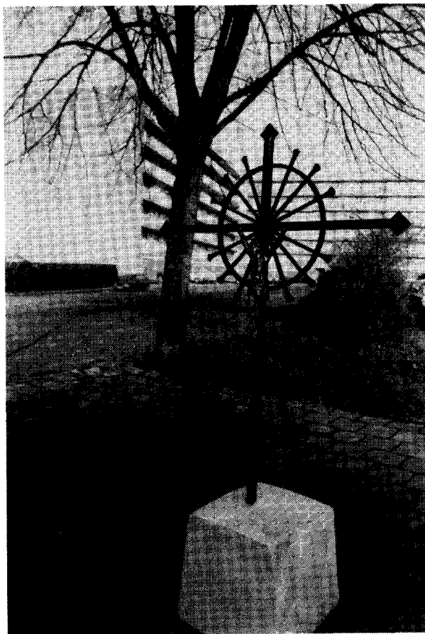
Heer: Nieuw door P.L.Beckers ontworpen kruis. De twaalf vanuit het hart van het kruis wegschietende pijlen symboliseren de 12 naar alle windstreken gezonden apostelen.