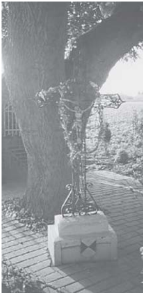
Het veldkruis, dat met het schilderij van O.L. Vrouw van Altijddurende Bijstand ontvreemd werd.