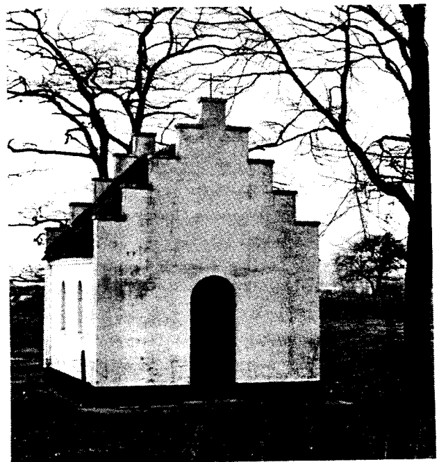
Sint Josefkapel in Blerick-Boekend